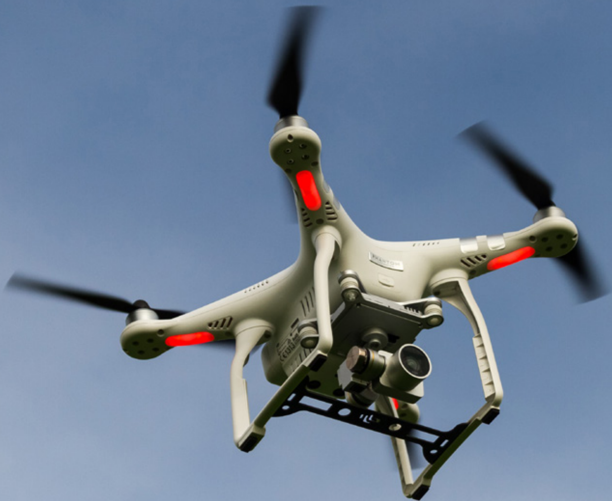
Een DJI Phantom-drone. Niet-statelijke actoren en landen met kleine defensiebudgetten schaffen dergelijke civiele, relatief goedkope drones aan om in te zetten voor militaire doeleinden