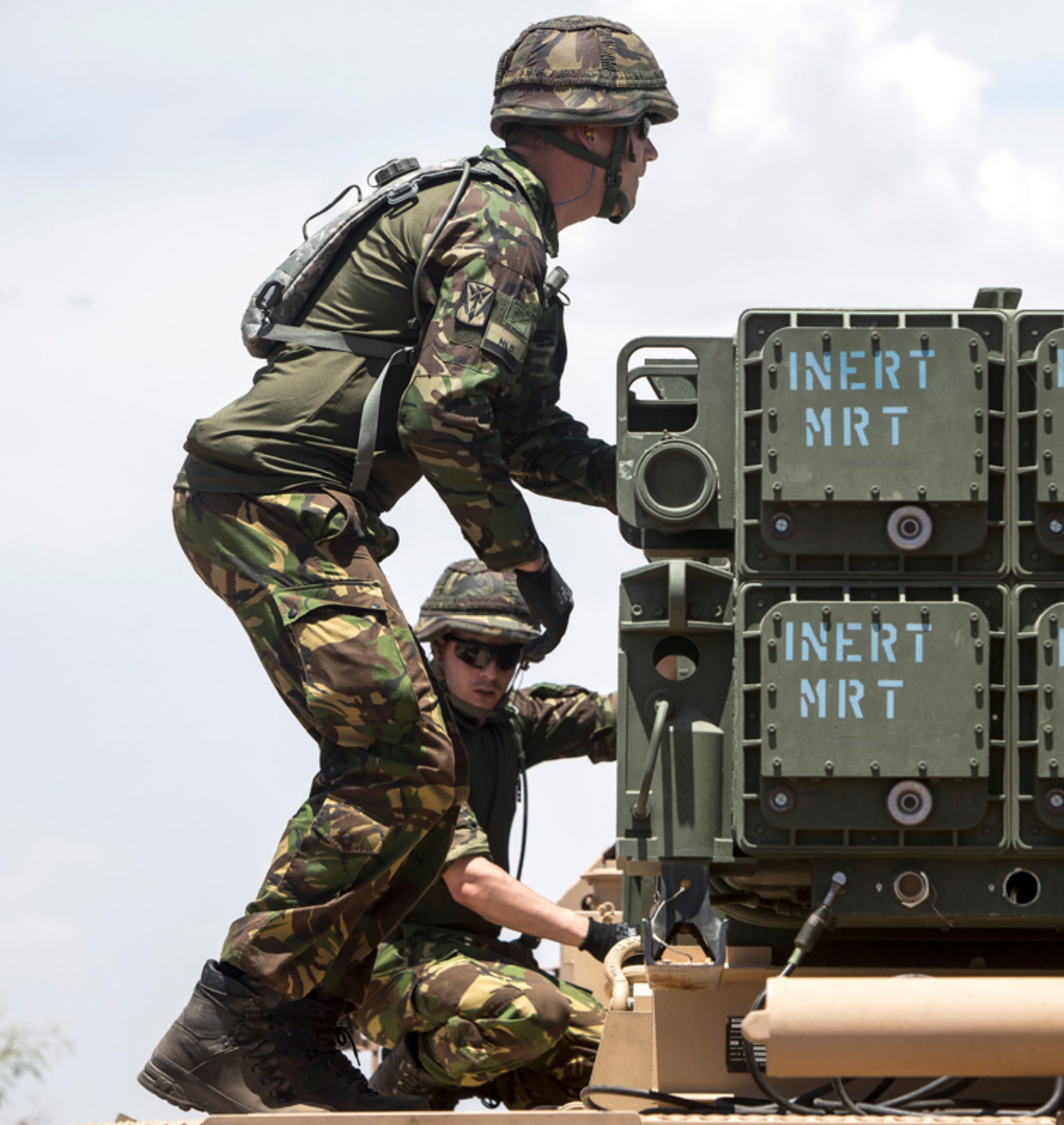
Nederlandse militairen oefenen in de VS met de voertuigen en handelingen van het Patriot-systeem. De Nederlandse Patriots kunnen kruisraketten, kortereafstands raketten en vliegtuigen onderscheppen