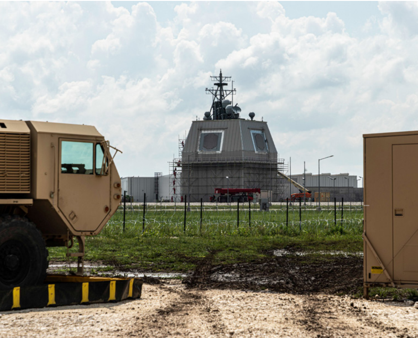
Het Amerikaanse Aegis Ashore-systeem verdedigt Europese NAVO-bondgenoten tegen ballistische raketten. Het systeem is gehuisvest op de Roemeense basis Deveselu