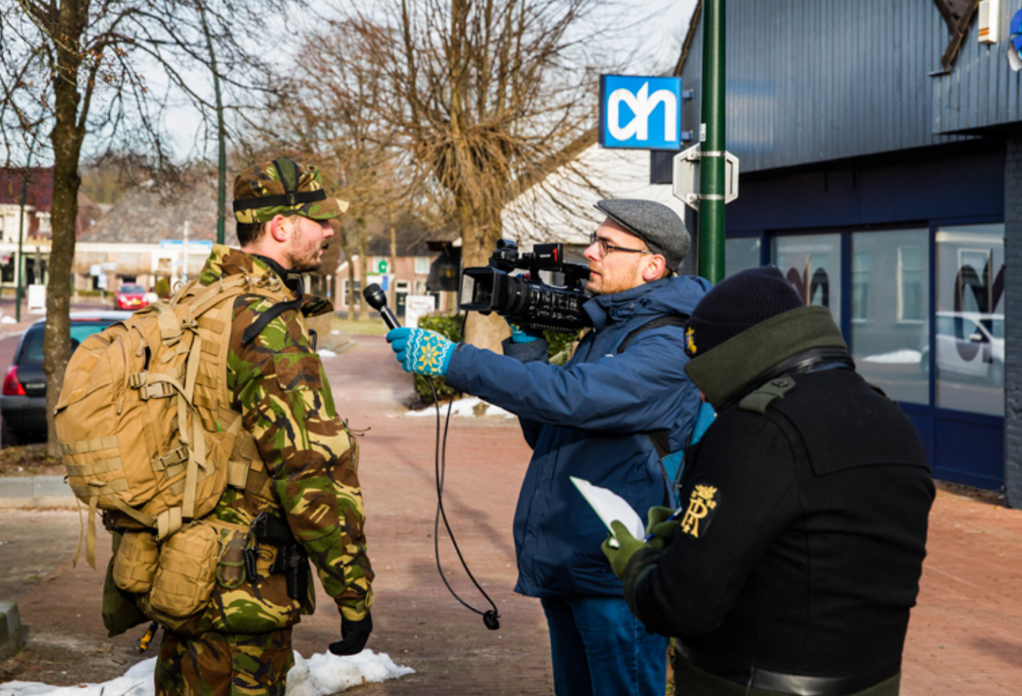
In de strijd tegen desinformatie moet Defensie de strategische communicatie goed op orde hebben, zodat de Nederlandse samenleving een duidelijk en begrijpelijk verhaal te horen krijgt