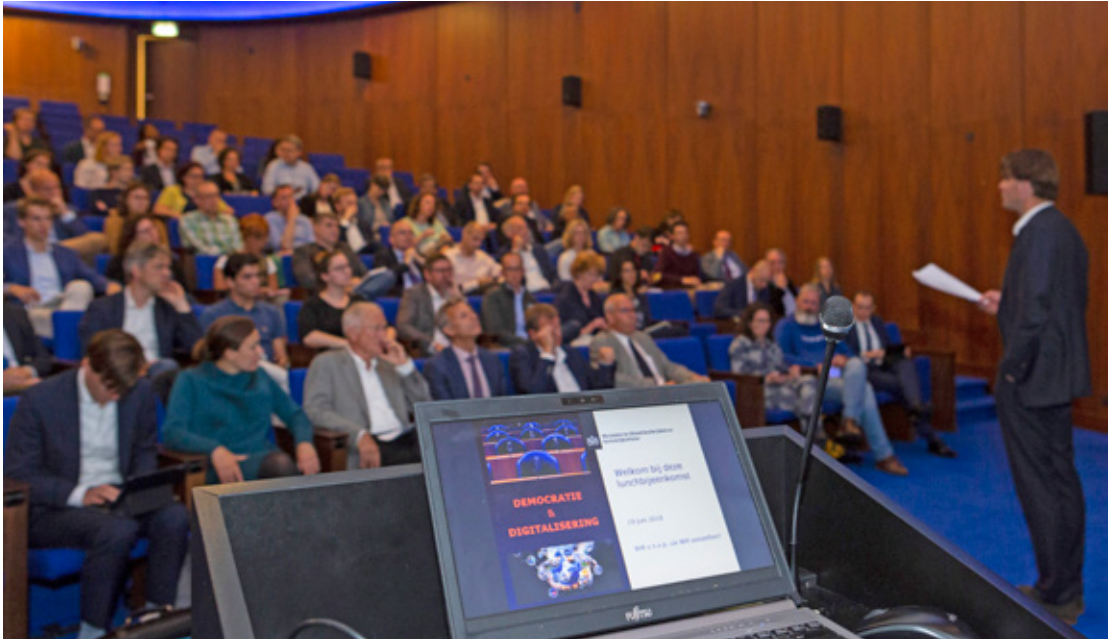
De bestrijding van desinformatie is belegd bij het ministerie van BZK, waarbij de effecten van de digitalisering op de democratie de aandacht hebben

misleidende informatie, met als doel om schade toe te brengen aan het publieke debat, democratische processen, de open economie of nationale veiligheid. [...] Desinformatie hoeft niet altijd onjuiste informatie te bevatten. Het kan een combinatie zijn van feitelijke, onjuiste en deels onjuiste informatie, maar altijd met de intentie om te misleiden en te schaden. 30