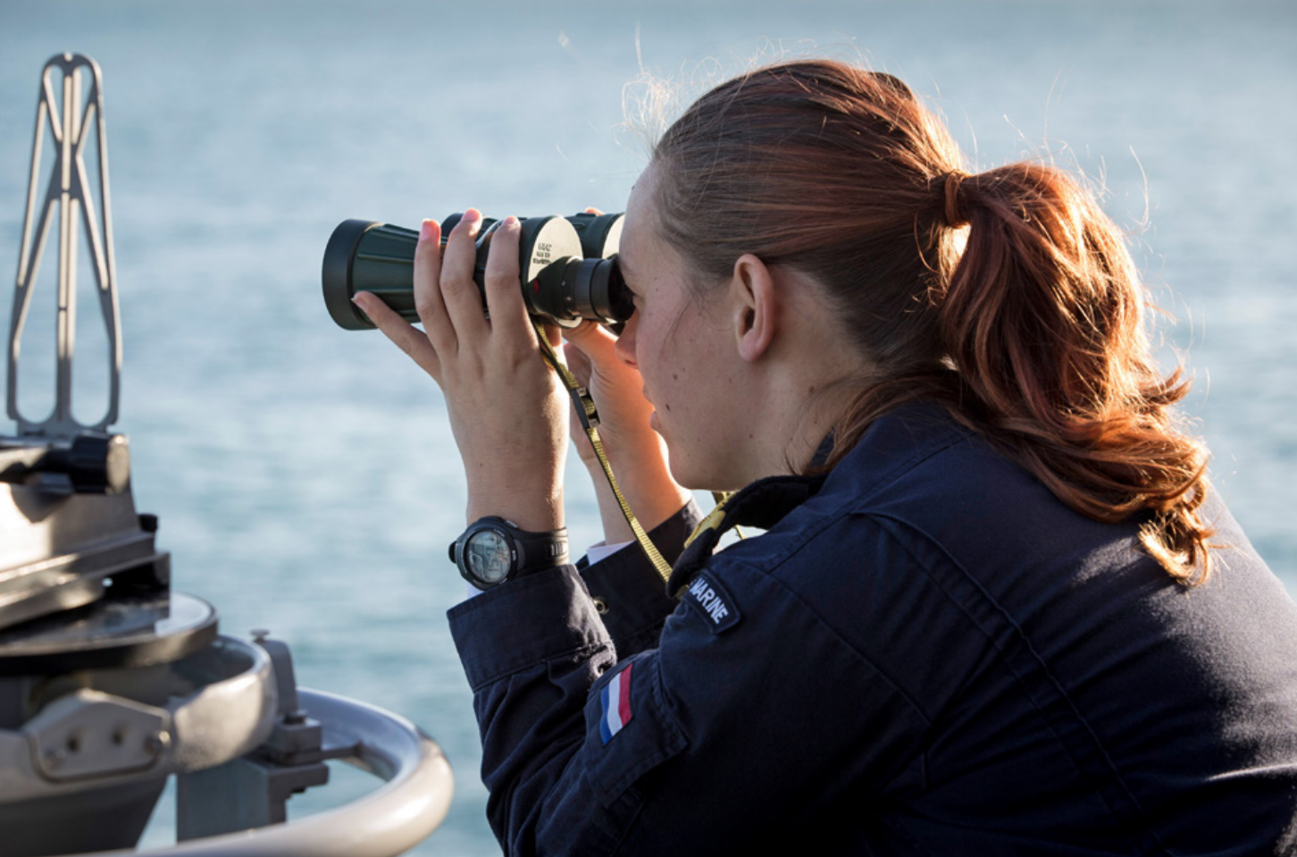
Speuren naar de periscope van een onderzeeboot. Onderzeebootbestrijding is een belangrijk element van handelsbescherming