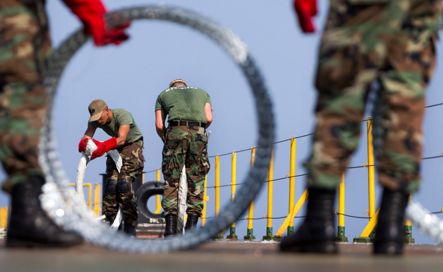
Een VPD-team neemt maatregelen om een schip te beschermen. Alle methoden van bescherming werden ingezet bij de bestrijding van Somalische piraterij