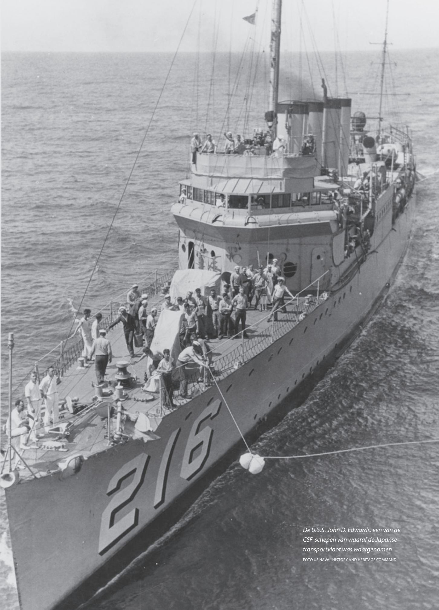
De U.S.S. John D. Edwards, een van de CSF-schepen van waaraf de Japanse transportvloot was waargenomen