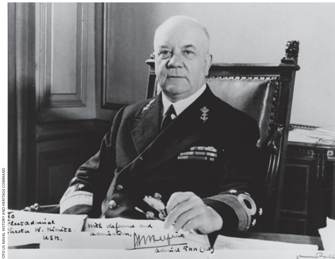
Dat ook vice-admiraal Helfrich kritiek op Doorman had en hem aanspoorde tot offensiever optreden, vermeldde Bosscher slechts in een noot

van de uitval op 4 februari, ver in de Indische Oceaan, op twee mogelijke rendez-vousplaatsen, te weten 14 graden Z 116 graden O en 14 graden Z 118 graden O, brandstof over te nemen uit tankers. Als derde rendez-vousplaats zou Doorman Fremantle, op de westkust van Australië, hebben aangewezen.