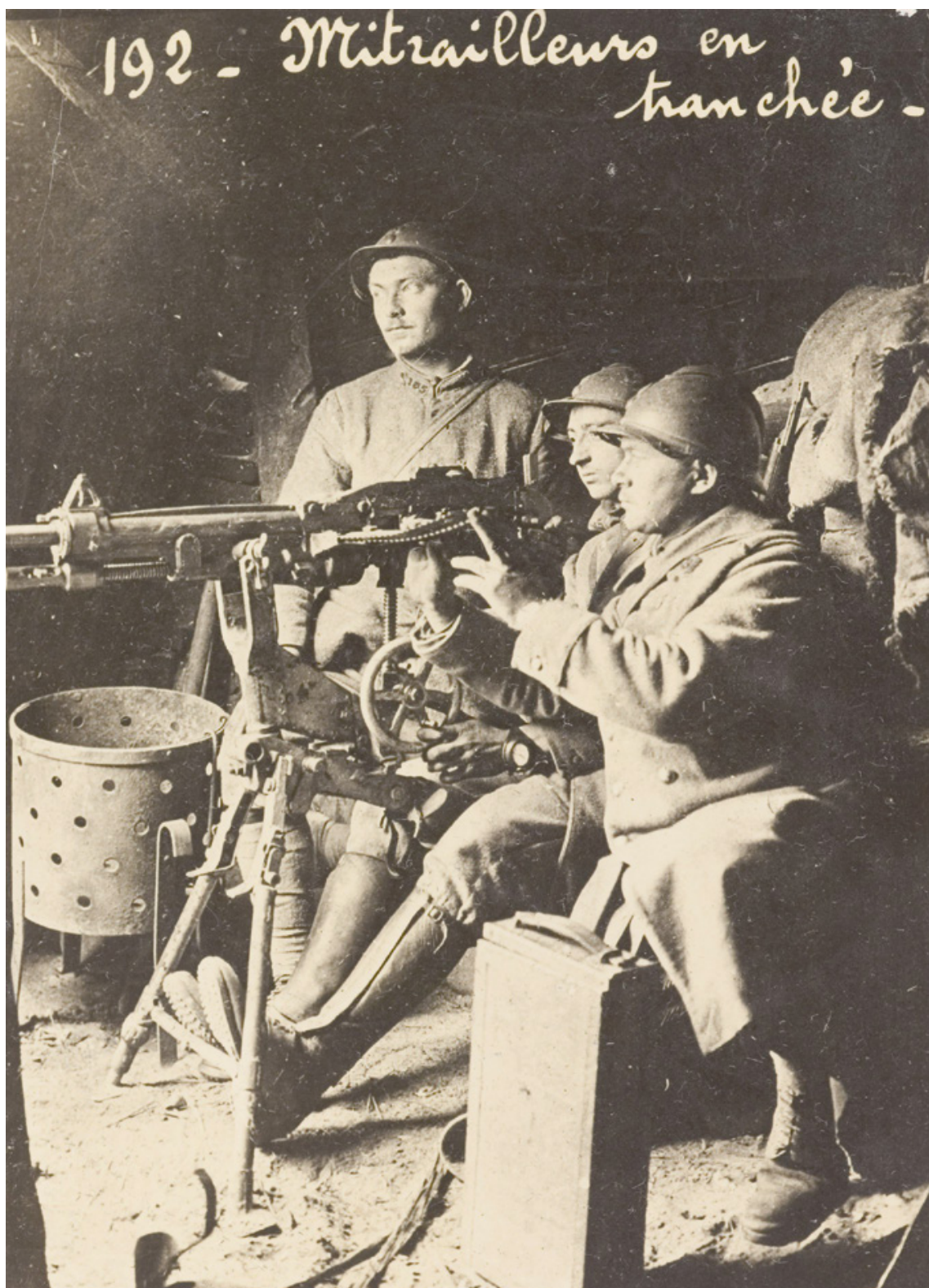
Drie Franse militairen met een mitrailleur in een loopgraaf tijdens de Eerste Wereldoorlog