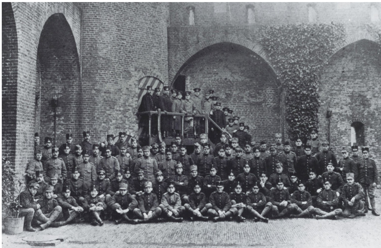
In een van de oorlogsscenario's keek de Generale Staf naar de terugtocht van het veldleger op de Vesting Holland, waar de verdediging kon worden voortgezet