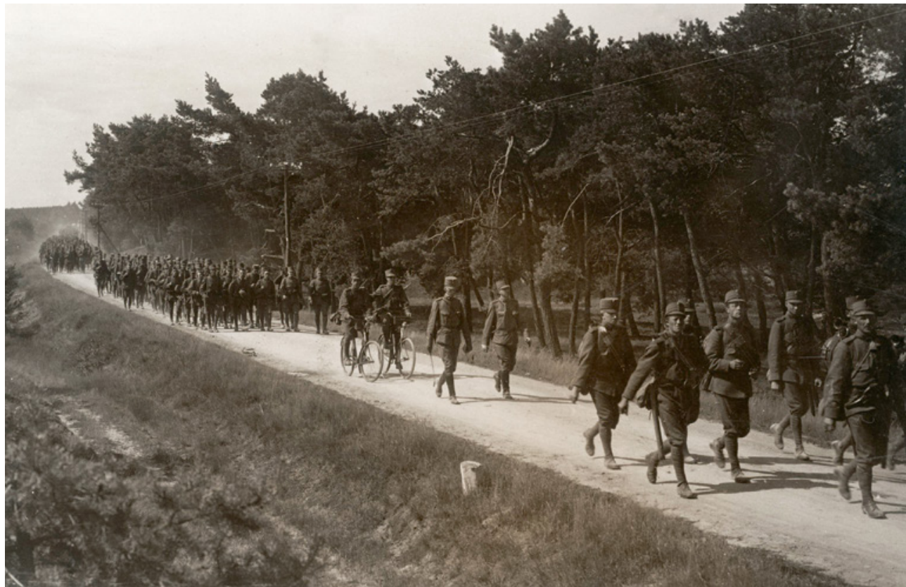
Een landstormcompagnie op mars tijdens de Eerste Wereldoorlog, 1915