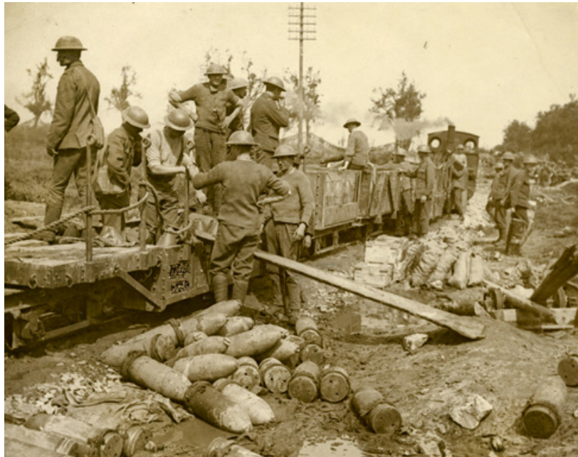
Industriële productie, wetenschappelijke innovatie en de wil tot het uiterste te gaan zouden de uitslag van de oorlog gaan bepalen