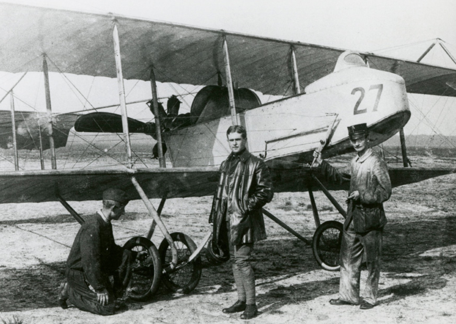
Geen enkel ander neutraal land was zo ver gegaan de gemobiliseerde krijgsmacht, zo'n 200.000 man, voortdurend op oorlogssterkte te velde te houden