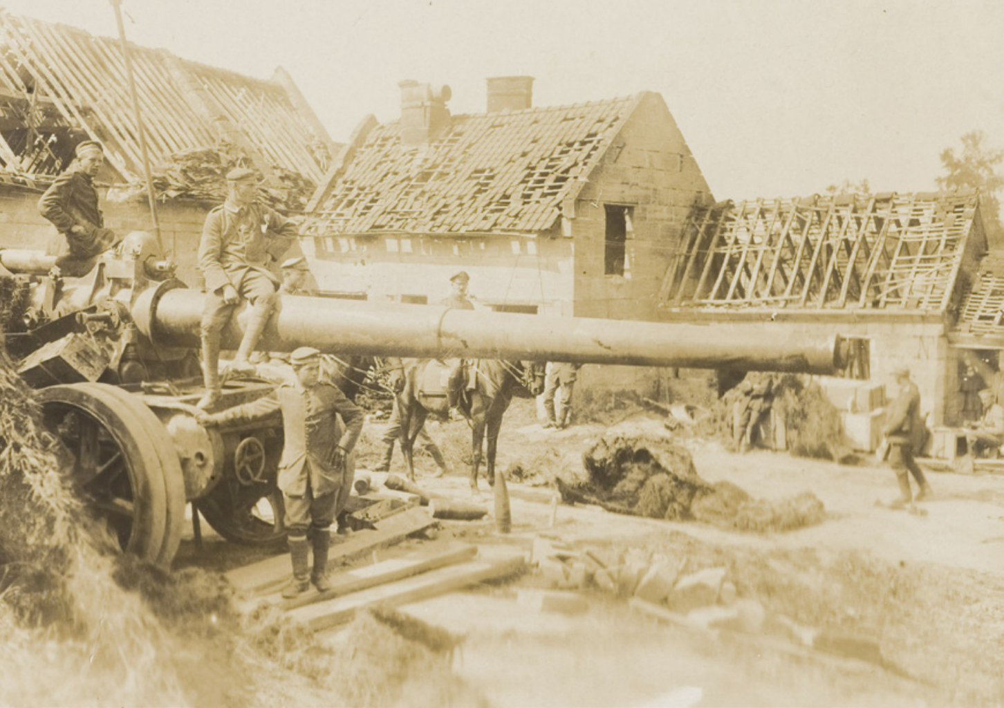
Experts adviseerden rond 1920 op basis van bestudering van de Eerste Wereldoorlog een aanzienlijke uitbreiding van de artillerie, in omvang en in typen geschut, maar alleen een kleine modernisering van het veldgeschut bleek medio jaren 20 mogelijk