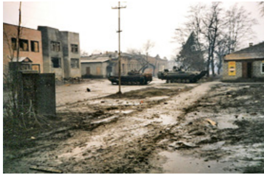
Strijd bij het presidentiële paleis en elders in Grozny