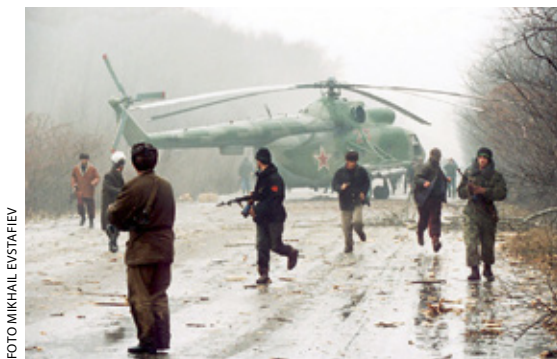
Tsjetsjeense rebellen bij een neergehaalde Russische Mi-8 helikopter, december 1994

Met de Tsjetsjeense hoofdstad in Russische handen, verspreidt de oorlog zich naar de dorpen. Vele daarvan ondergaan hetzelfde lot als Grozny. De rebellen, kwetsbaar in het open landschap, trekken zich verder terug de bergen in. De voornamere rebellenleider Sjamil Basajev heeft als commandant van het Abchazische Bataljon tijdens de gevechten om Grozny een belangrijke rol gespeeld. Toen Jeltsin in november 1991, na het uitroepen van de Tsjetsjeense onafhankelijkheid, dreigde met een militaire interventie, was het tevens Basajev die het fenomeen ‘Tsjetsjeens terrorisme’ introduceerde. Als reactie op het samentrekken van Russische troepen aan de grens, kaapte hij met twee medeplichtigen een Toepolev TU-154 van Aeroflot, die vanuit de Russische Kaukasus op weg was naar Ankara. Vanuit Turkije vlogen ze terug naar Grozny, waar de passagiers werden