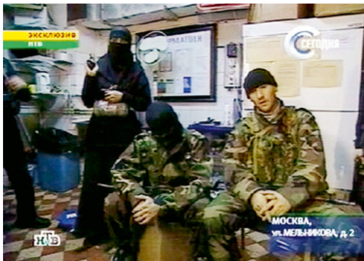
Tientallen islamitische Tsjetsjenen – mannen en vrouwen – gijzelen in oktober 2002 bijna duizend mensen in het Dubrovka-theater in Moskou

Terwijl Tsjetsjenië na 2002 tot een grotendeels autonome republiek binnen de Russische Federatie transformeert, komen de rebellen-