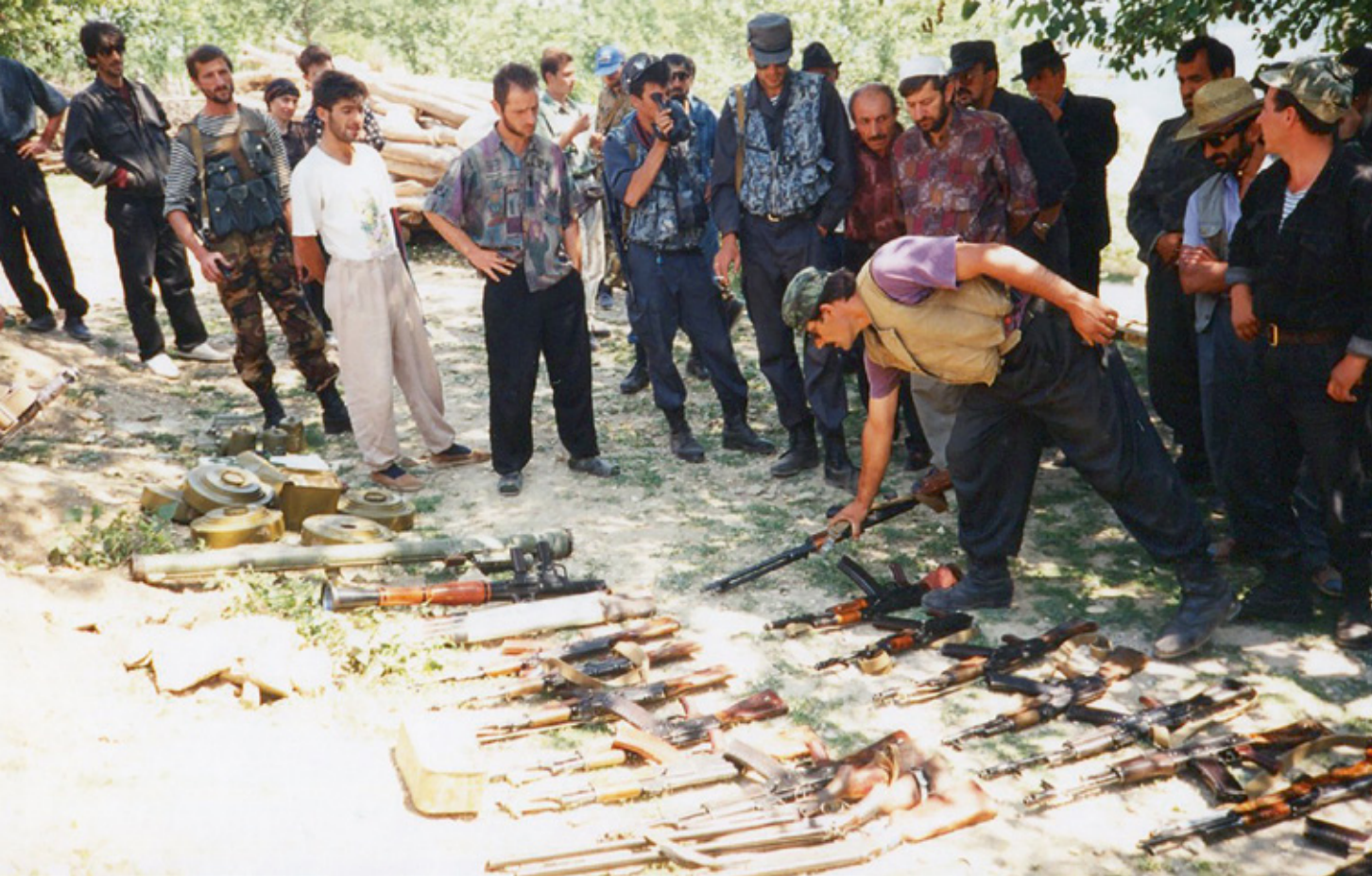
Ondanks de ontwapening wemelt het in Tsjetsjenië na het vredesakkoord van Khasavyurt in 1996 nog van de wapens en munitie