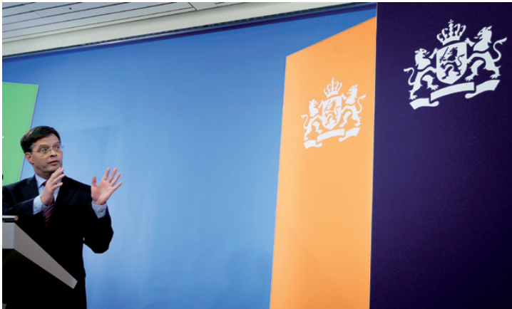
Sinds toenmalig minister-president Jan Peter Balkenende verklaarde dat de overheid sneller haar rekeningen aan ondernemers moest betalen hebben Defensie en andere ministeries belangrijke stappen gezet