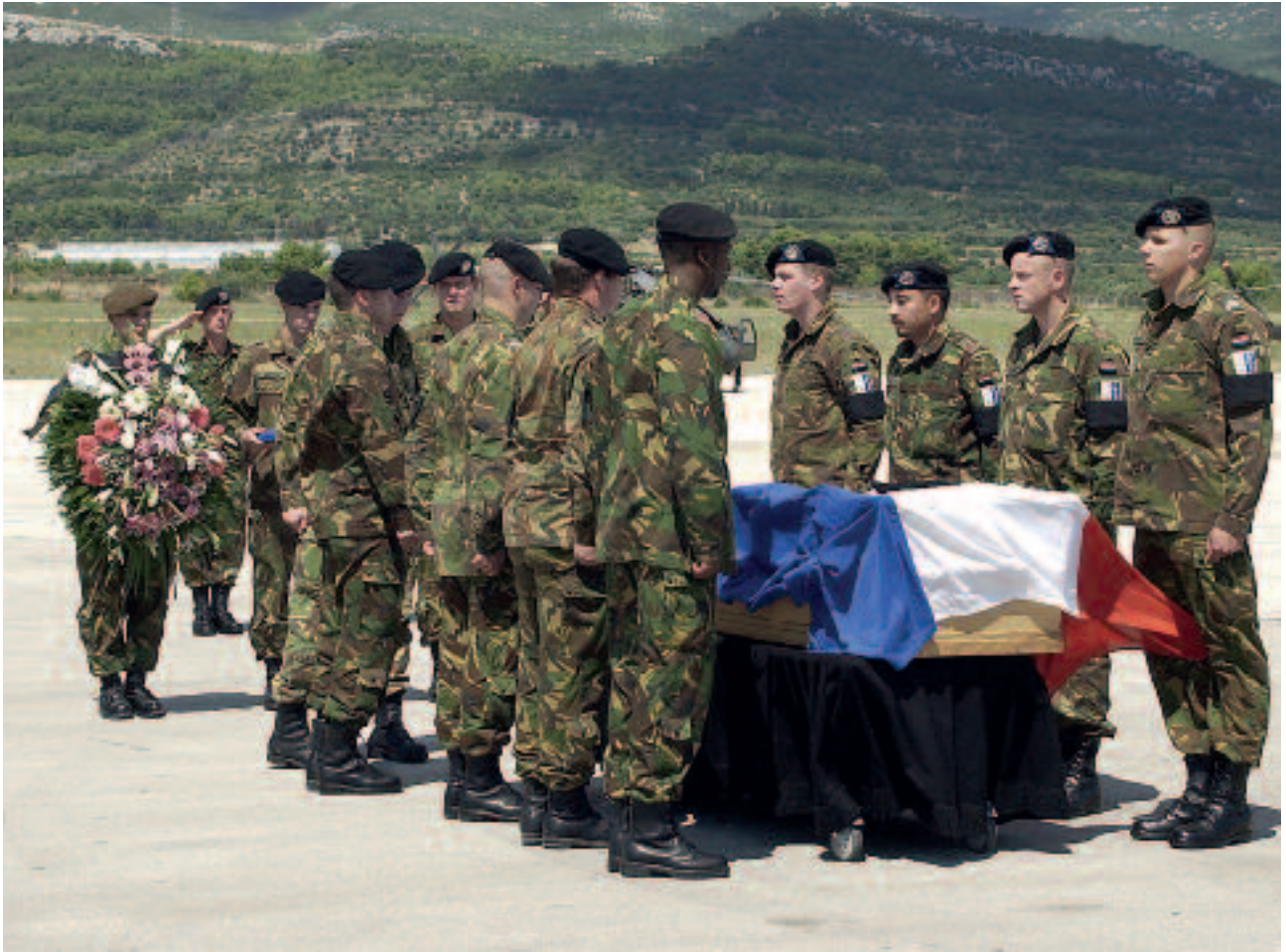
Uitvaart van een Nederlandse SFOR-militair, Bosnië-Herzegovina. Mede vanwege de risico's die militairen kunnen lopen is goede geestelijke verzorging in de krijgsmacht een noodzaak

macht kenmerken vertoont van een totale organisatie. Vanwege haar aandacht voor de spirituele dimensie draagt ze bij aan een menswaardig leefklimaat binnen de krijgsmacht. De krijgsmacht is een organisatie waarbij het uitoefenen van geweld een belangrijke plaats inneemt. Aandacht voor de verschillende spirituele vragen die dat oproept komt ten goede aan een klimaat van zorgvuldige morele besluitvorming en verantwoording binnen de krijgsmacht.