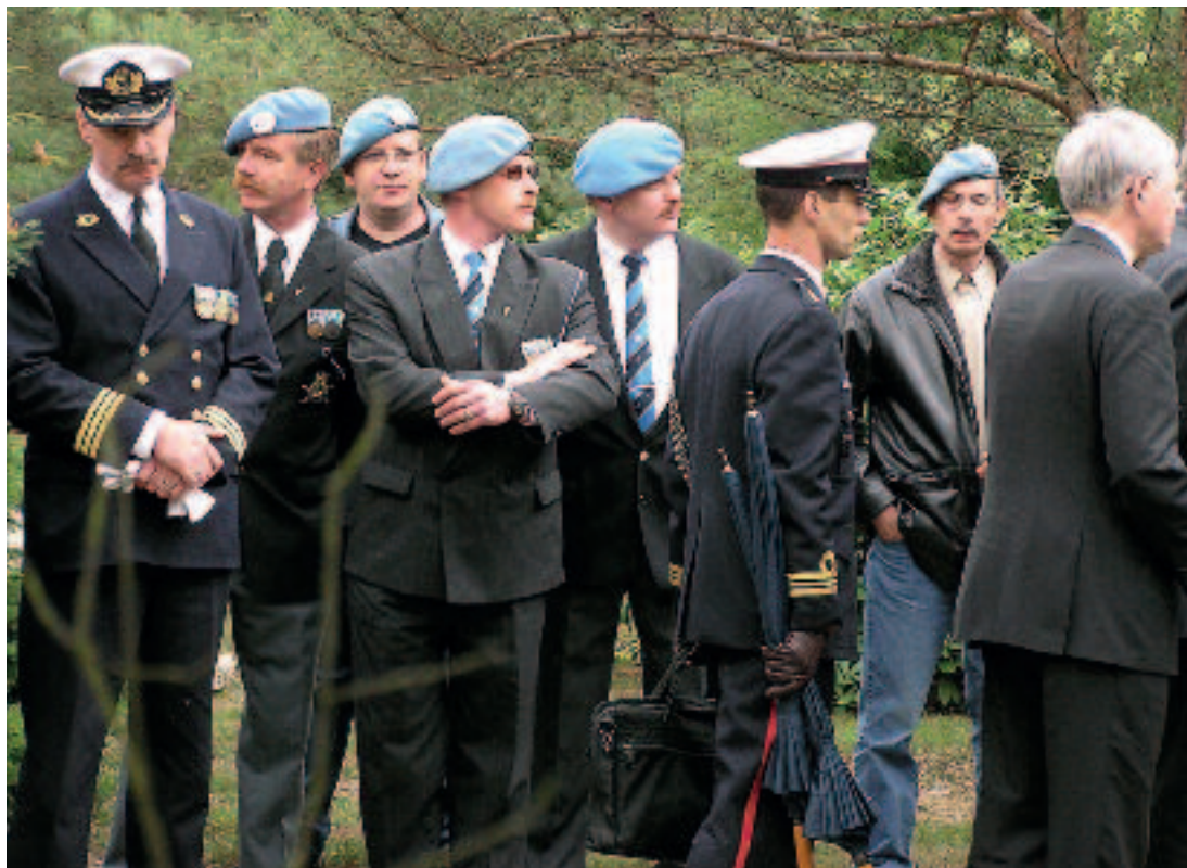
Veteranen van de vier operationele commando's ontvangen het Veteraneninsigne (2005). Geestelijke verzorging heeft aandacht voor de spirituele dimensie en draagt zo bij aan een menswaardig leefklimaat binnen de krijgsmacht

defensiepersoneel, veteranen en het thuisfront'. 17 In deze missie van de diensten Geestelijke Verzorging horen we de echo van opvattingen binnen de World Health Organization waarin de spirituele dimensie één van de pijlers van gezondheid en welbevinden is. 18 Deze opvattingen worden gestaafd door diverse wetenschappelijke onderzoeken. 19 Zorg en aandacht voor de spirituele dimensie van het leven blijkt een van de belangrijke factoren te zijn die bijdragen aan een gezond (geestelijk) leven en aan het welbevinden, de veerkracht en de weerbaarheid van mensen.