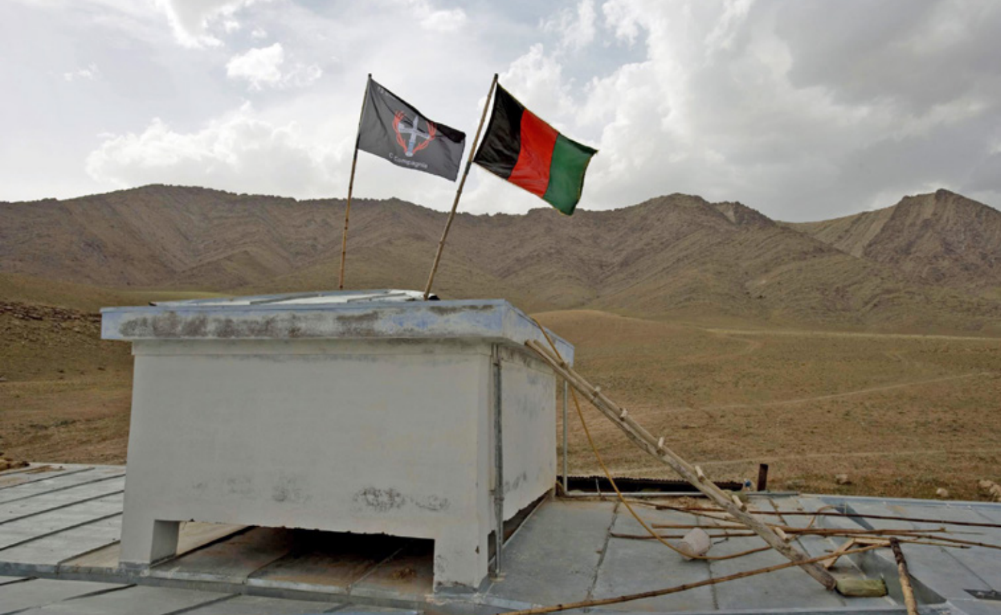
De regimentsvlag van 13 Regiment Stoottroepen Prins Bernhard en de nationale Afghaanse vlag hangen tijdens de Slag om Chora op het dak van de White Compound