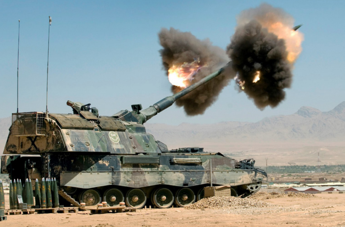
De pantserhouwitser brengt in de ochtend van 16 juni 2007 vuursteun uit aan Nederlandse troepen in Chora