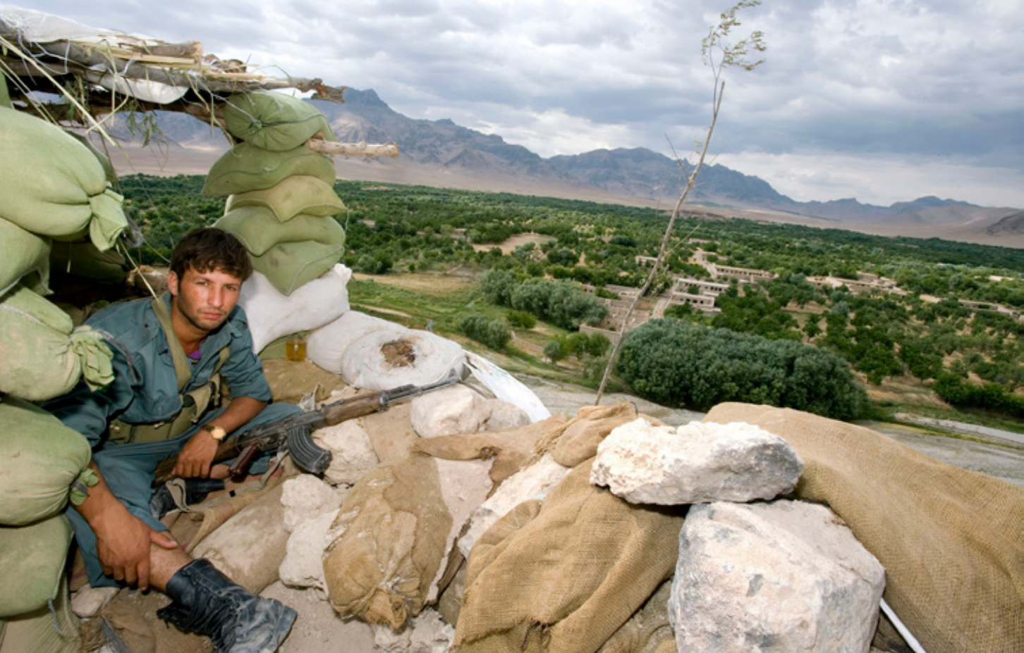
Een Afghaanse politiepost met zicht op de green zone