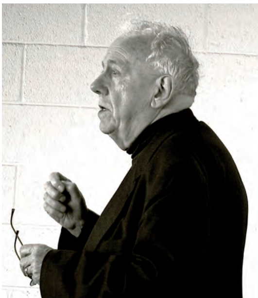
Onderwijs, gezondheidszorg, maar ook de militaire praktijk kan als een 'praxis' worden aangemerkt. Mensen zoeken een praxis die bij ze past, en waarin ze zich verder kunnen ontwikkelen. Alasdair MacIntyre (zie foto) heeft een theorie ontwikkeld hoe per specifieke praxis een daarop afgestemd karakter kan worden gedefinieerd

De definitie geeft verder aan dat door deelname in de praxis zogeheten 'internal goods' worden gerealiseerd. Dit begrip vergt enige toelichting. Een praxis heeft voor mensen al of niet een bepaalde aantrekkingskracht. De mate van aantrekkingskracht doet iemand besluiten wel of niet aan een praxis deel te nemen; ze hebben verwachtingen over de verrijking die ze in die praxis kunnen opdoen, de mate van plezier die ze daarin hopen te vinden. Dit betekent dat mensen een praxis zoeken die bij hen past, en waarin ze zich verder kunnen ontwikkelen.