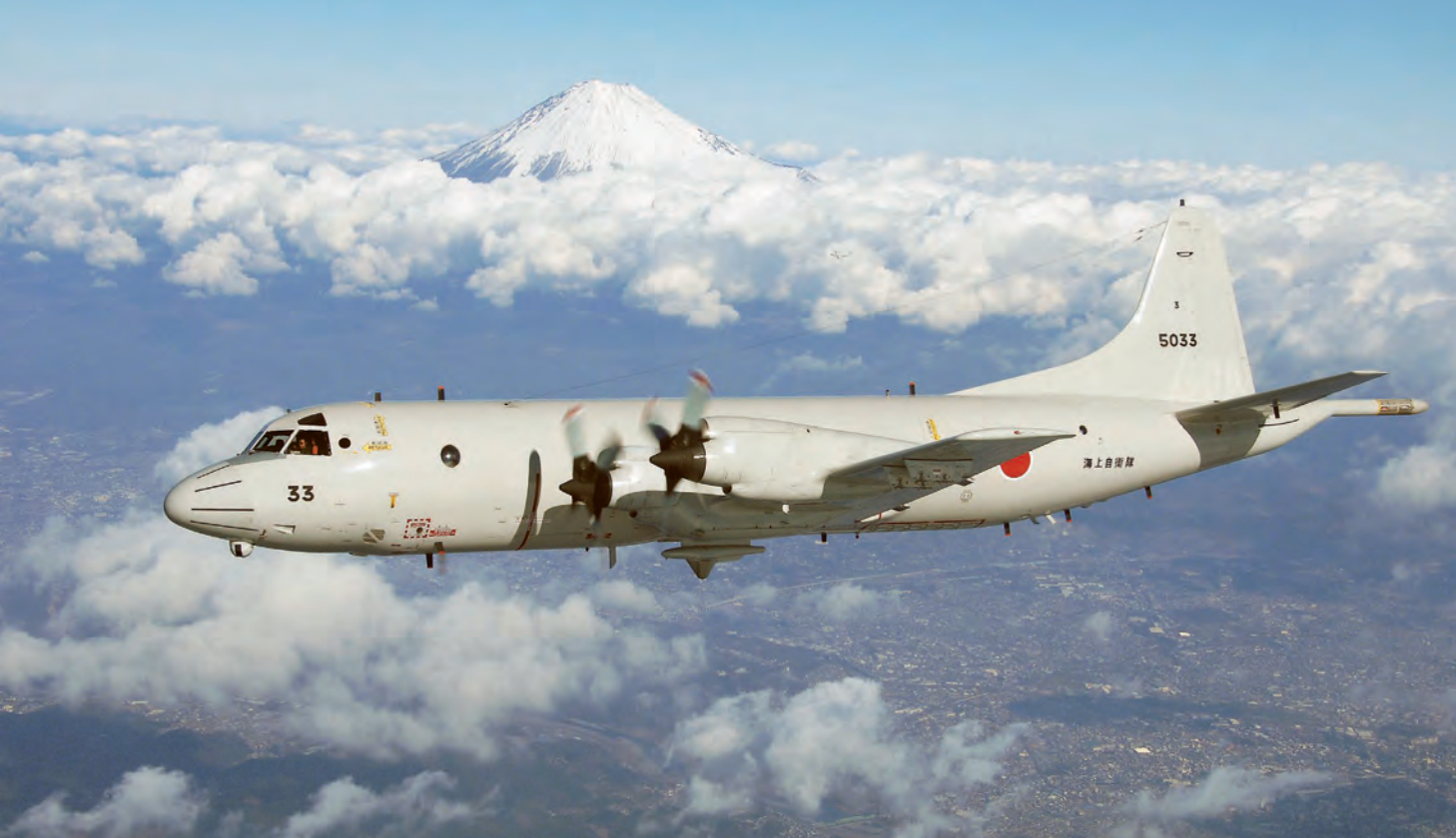
De Lockheed P3-C Orion, zowel ingezet voor ASW als de patrouille- en surveillancetaak, worden uitgefaseerd en vervangen door een Japans toestel