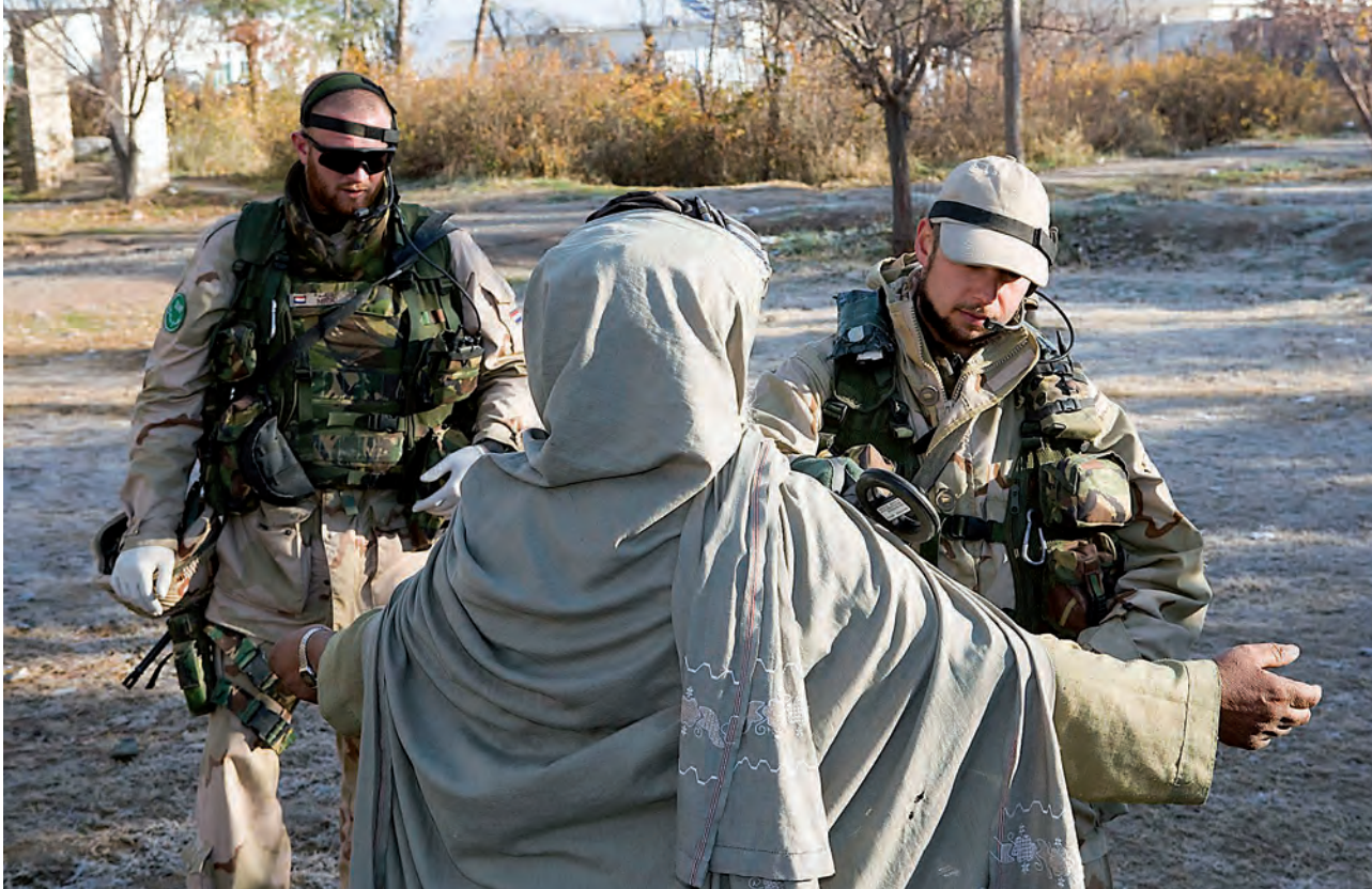
Een militair kan en mag niet bij de pakken neerzitten. Hiervoor is veerkracht vereist. Veerkracht betekent fysieke én mentale weerbaarheid

de verwachtingen die ze hebben over de inhoud van het militair zijn. 14 Om het overzicht te behouden zal ik per deel van de militaire praxis ingaan op de daaraan verwante intrinsieke aantrekkingskrachten.