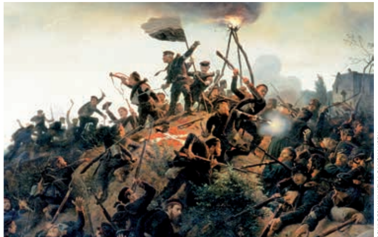
SCHILDERIJ WILHELM CAMPHAUSEN

Het gezamenlijke optreden van Pruisen en Oostenrijk tegen Denemarken in 1864 zorgde ook bij Nederlandse militairen tot ontzetting en zette de controverse tussen de legertop en kritische officieren op scherp