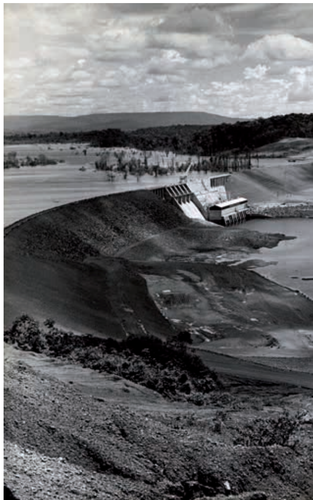
Het Brokopondostuwmeer met de Afobakadam, die onder meer met medewerking van de 'springploeg' van de TRIS werd gerealiseerd