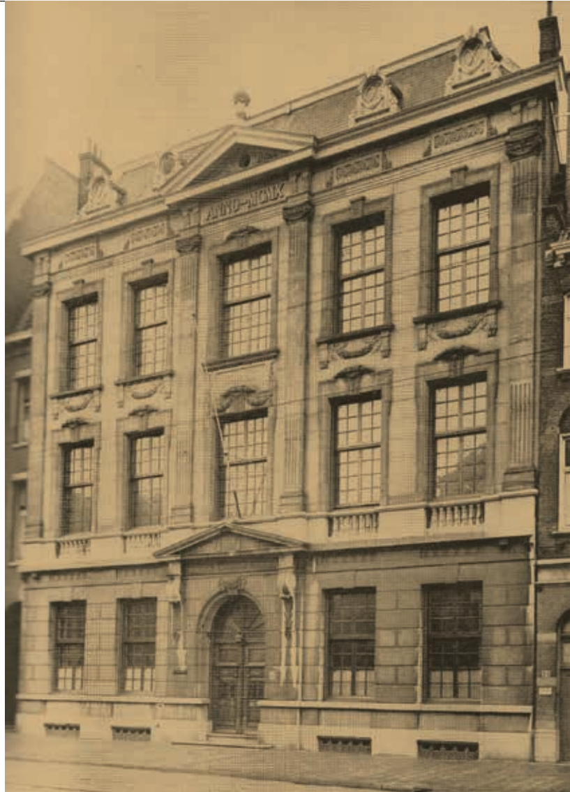
De VBK, die bijeenkwam in een pand aan de Fluwelens Burgwal, was in de beginjaren bij uitstek een Haagse club. De foto dateert van na de verbouwing van 1910

De VBK kreeg in de pers een positief onthaal. Onder de kop 'Eene goede zaak aangeprezen' heette ook De Militaire Spectator de nieuwe vereniging van harte welkom. Er was nu een middel geboren, schreef het blad, 'waardoor bij niet-militairen de zoozeer gewenschte bekendheid met krijgswetenschappen wordt in de hand gewerkt'. 18 Bij Blanken en de legertop viel de VBK, zoals te verwachten was, niet in goede aarde. Zij beschouwden haar als een 'comité van oproer en verzet'. 19 Verontwaardigd wezen zij een uitnodiging om lid te worden van de hand. Omdat de grondwet een frontale aanval