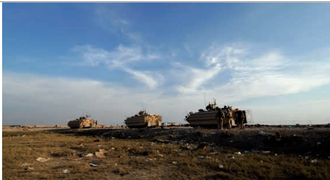
British Bulldog Armoured Vehicles on the outskirts of Basra, Iraq; changes led Western militaries to a point where they were no longer prepared for the conflicts they had to fight

militaries. Strategic factors could be found in the changing character of war and the subsequent political interference that increased as conflicts became more unconventional. Strategic factors had their greatest influence on the goals and strategies of military organizations. As the unconventional conflict moved towards the centre of warfare, strategic goals and objectives became less clearly definable. Because of these more complicated goals, the electoral risks of military operations also increased, causing a greater political interference in military operations. This went as far as strategic leadership managing tactical decisions, thereby influencing the conduct and outcome of operations.