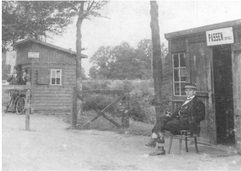
De douane nam vanaf 1920 de passencontrole op zich, zoals hier bij een doorlaatpost aan de oostgrens

De grensbewakingswet was bedoeld als een noodwet: een door de omstandigheden opgedrongen afwijking van het liberale dogma van een vrij personenverkeer zonder paspoortcontroles. In artikel 9 beloofde het kabinet dan ook plechtig een voorstel tot intrekking te doen als de wet niet langer nodig werd geacht. In de daaropvolgende decennia bleek de grensbewaking echter taaier dan gedacht, gezien het voortbestaan van de wet en de uiteindelijke opname in de Vreemdelingenwet van 1965. Zelfs het proces van Europese integratie maakte geen einde aan de grensbewaking, maar betekende slechts een verlegging van de controles naar de Europese buitengrenzen. Daarnaast ontstond aan de ‘open’ Nederlandse binnengrens een vorm van vreemdelingentoezicht door de Koninklijke Marechaussee. Zo hielden marechausseebrigades tot 1968 aan de in het kader van de Benelux opengestelde zuidgrens in de vorm van ‘gadeslaan’ tijdelijk een oogje in het