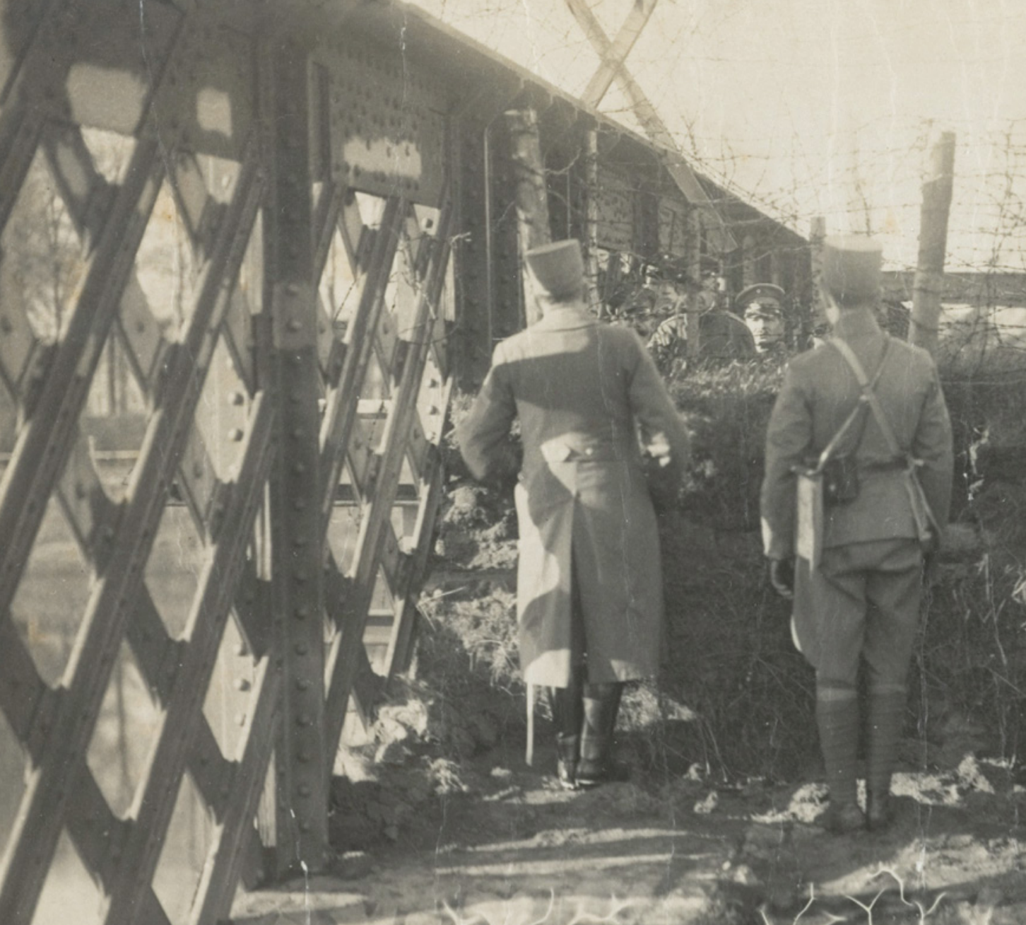
Nederlandse en Duitse militairen in gesprek bij de grensovergang over de Maas bij Roosteren (1918)