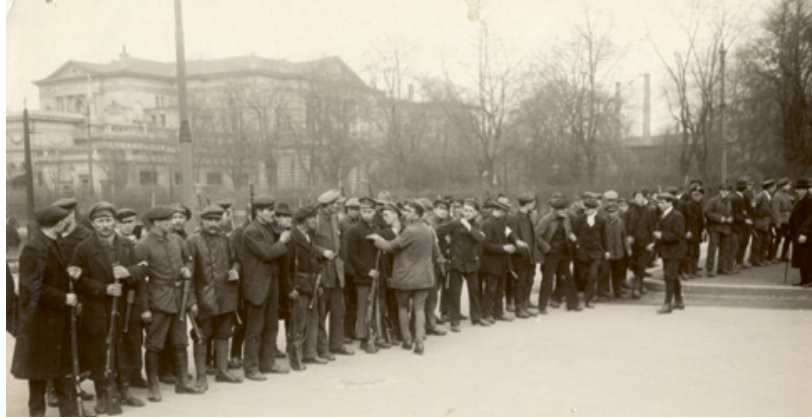
Een groep Spartakisten maakt zich op voor de strijd om Berlijn (1918-1919)

Het vooruitzicht de grensbewaking over te moeten nemen, stelde Heemskerk voor twee problemen. Ten eerste beschikte hij over onvoldoende bevoegdheden. De oude Vreemdelingenwet van 1849 – die bij intrekking van de staat van beleg weer zou gaan gelden – bood geen mogelijkheid het grensverkeer aan strenge beperkingen te onderwerpen. Het ontzeggen van het verblijf in het grensgebied was – volgens artikel 13 van de oude wet – alleen met veel omhaal mogelijk. Voor ieder individueel geval diende een Koninklijk Besluit te worden uitgevaardigd, dat tevens aan de Staten-Generaal moest worden medegedeeld. Politieke problemen met een kritisch parlement lagen in dat geval op de loer, wat voor Heemskerk een weinig aantrekkelijk vooruitzicht was. Bovendien was het artikel alleen van toepassing op vreemdelingen: gevaarlijke Nederlandse communisten en smokkelaars ontsprongen de dans. Met de bevoegdheden van de staat van beleg daarentegen kon Heemskerk gevaarlijke vreemdelingen én Nederlanders zonder veel haken en ogen het verblijf aan de grens ontzeggen. Deze bevoegdheden zouden echter eerst door beide Kamers moeten worden toegekend.