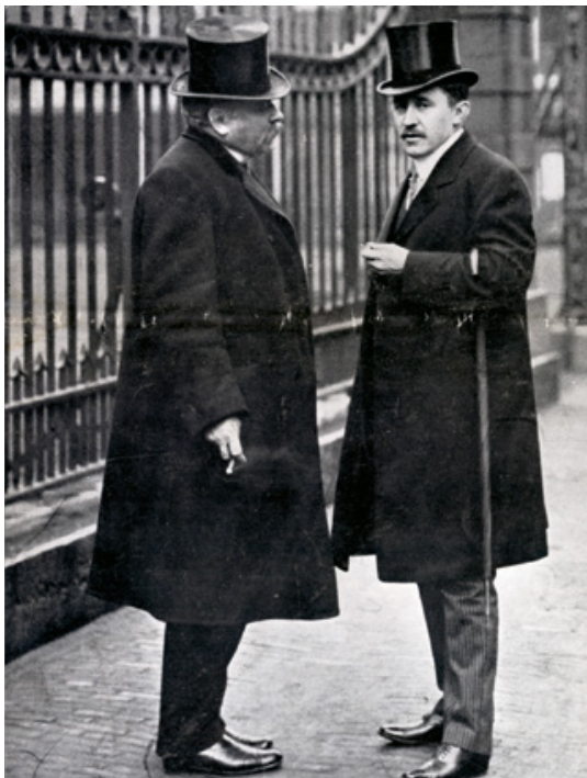
Minister Theodoor Heemskerk in gesprek met toenmalig minister van Justitie Edmond Regout (1913)