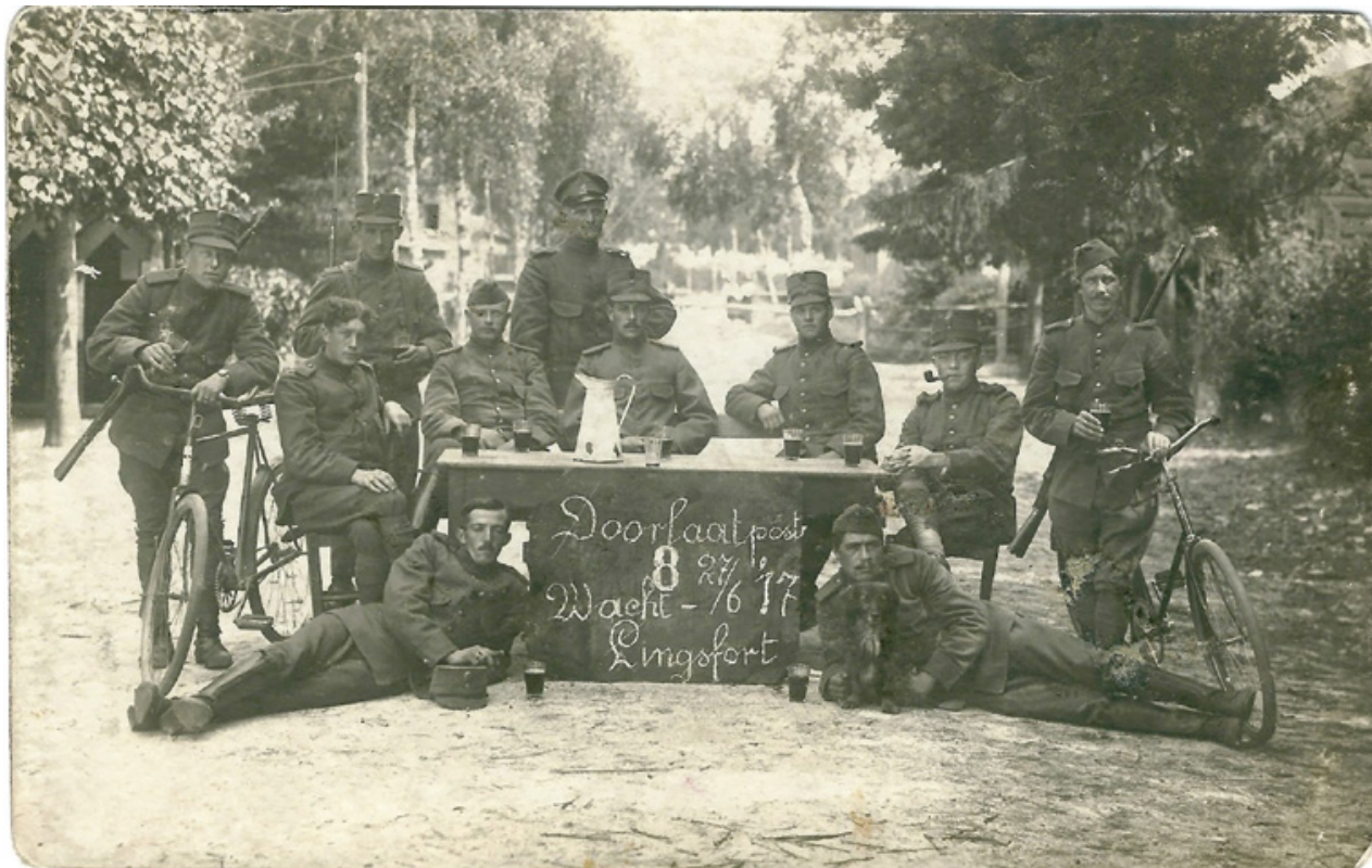
Grensbewakers bij 'Doorlaatpost 8' bij Arcen in Noord-Limburg