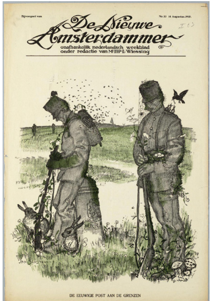
Spotprent op de cover van de Nieuwe Amsterdammer (augustus 1915)

Het afkondigen van de staat van beleg bood de militaire autoriteiten nog steeds geen mogelijkheid tot het instellen van paspoortcontroles. Het kabinet legde het militair gezag namelijk een belangrijke beperking op. Het mocht de bevoegdheden van de oorlogswet niet gebruiken voor het tegen hun zin uitzetten of afwijzen van 'vreemde burgers'. Dezelfde regeling zou later ook worden ingesteld ten aanzien van ontsnapte krijgsgevangenen en deserteurs: zij mochten niet tegen hun zin over de grens worden gezet. Door het militair gezag in het grensgebied aangetroffen gevaarlijke vreemdelingen mochten alleen naar het niet in staat van beleg verkerende binnenland worden 'uitgezet'. Humanitaire overwegingen speelden bij het kabinet een belangrijke rol: deserteurs wachtte bij het terugsturen naar hun voormalige leger zonder twijfel een zware straf, zo niet de kogel, terwijl premier Cort van der Linden ook het