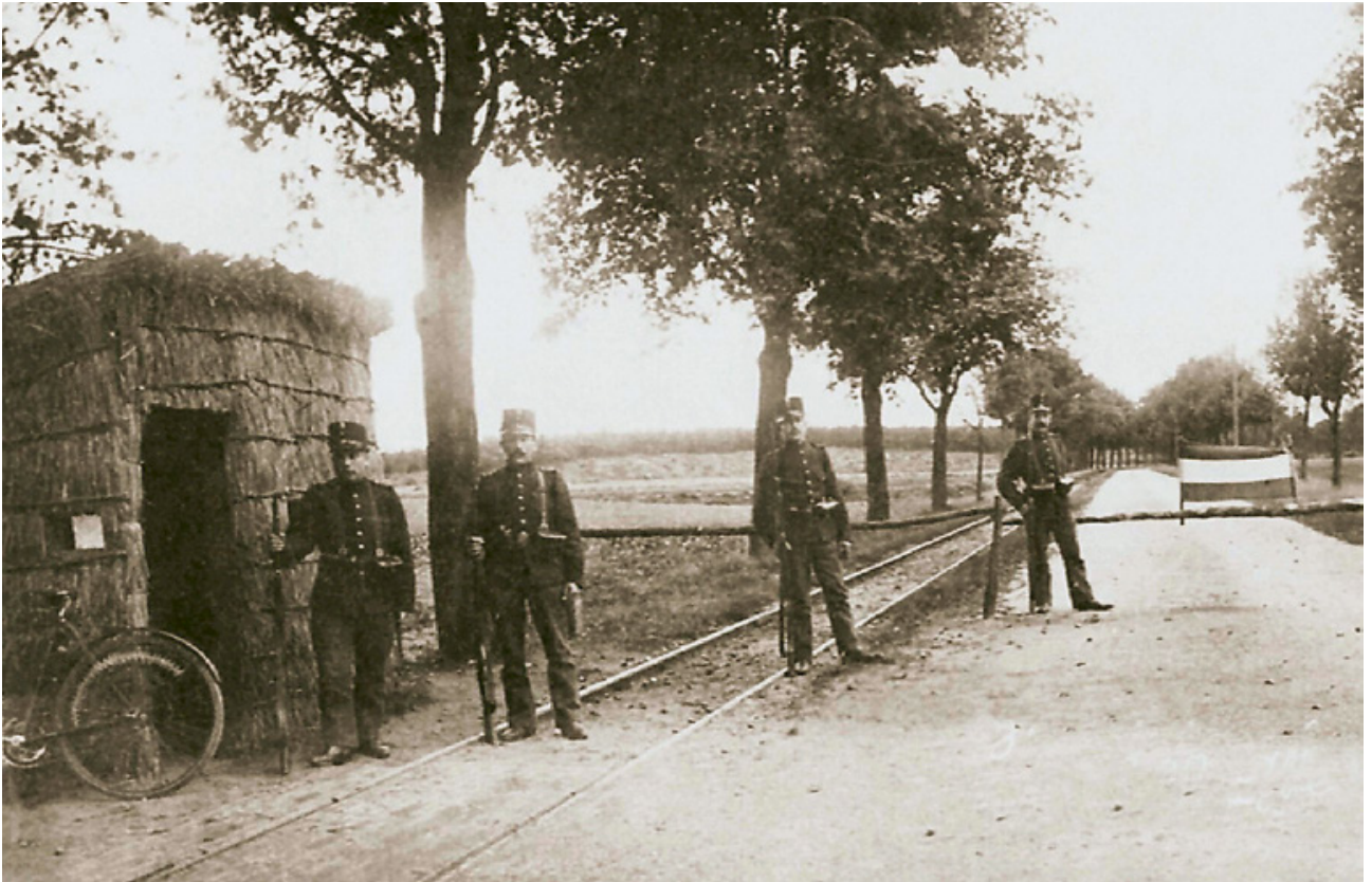
Een controlepost van de landweergrenswacht bij Well (1914). Controleposten moesten voorkomen dat vijandelijke militairen ongemerkt konden opstomen naar strategische punten