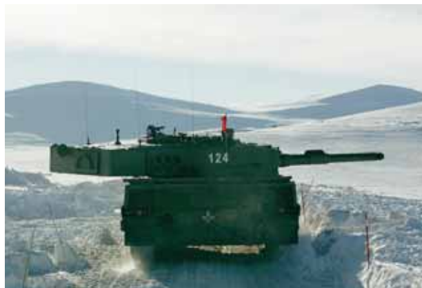
Er is ruimte genoeg om te oefenen in Noorwegen. Hier een Noorse Leopard 2A4 gevechtstank, die in 2004 van Nederland is gekocht

De totale parate sterkte van 7.400 moet ertoe leiden dat de ambitie van constant 700 landmachtmilitairen in buitenlandse missies gewaarborgd