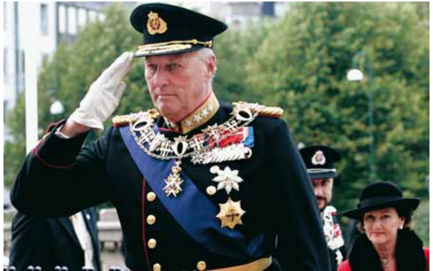
De Noorse koning Harald V tijdens de opening van het nieuwe Noorse politieke jaar in Oslo, 2006

Een belangrijke ligging kan ook gevaarlijk zijn. Dit heeft Noorwegen met de Duitse inval in 1940 ervaren. Deze ervaring heeft ervoor gezorgd dat men ernaar streeft om ingebed te zijn in allianties. Voor een deel verklaart dit de activiteiten van Noorwegen in de Verenigde Naties. Het zorgt er ook voor dat Noorwegen een trouw lid is van het NAVO-bondgenootschap, dat voorheen de Sovjet-Unie, en nu de