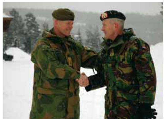
Luitenant-generaal Van Uhm en generaal-majoor Mood tijdens de ondertekening van het ACI in het besneeuwde Rena, februari 2007

Een voorbeeld waartoe deze samenwerking kan leiden is de samenwerking tussen de beide Militair-geografische organisaties. Niet alleen producten worden gedeeld (digitale kaarten) maar er wordt ook samen-