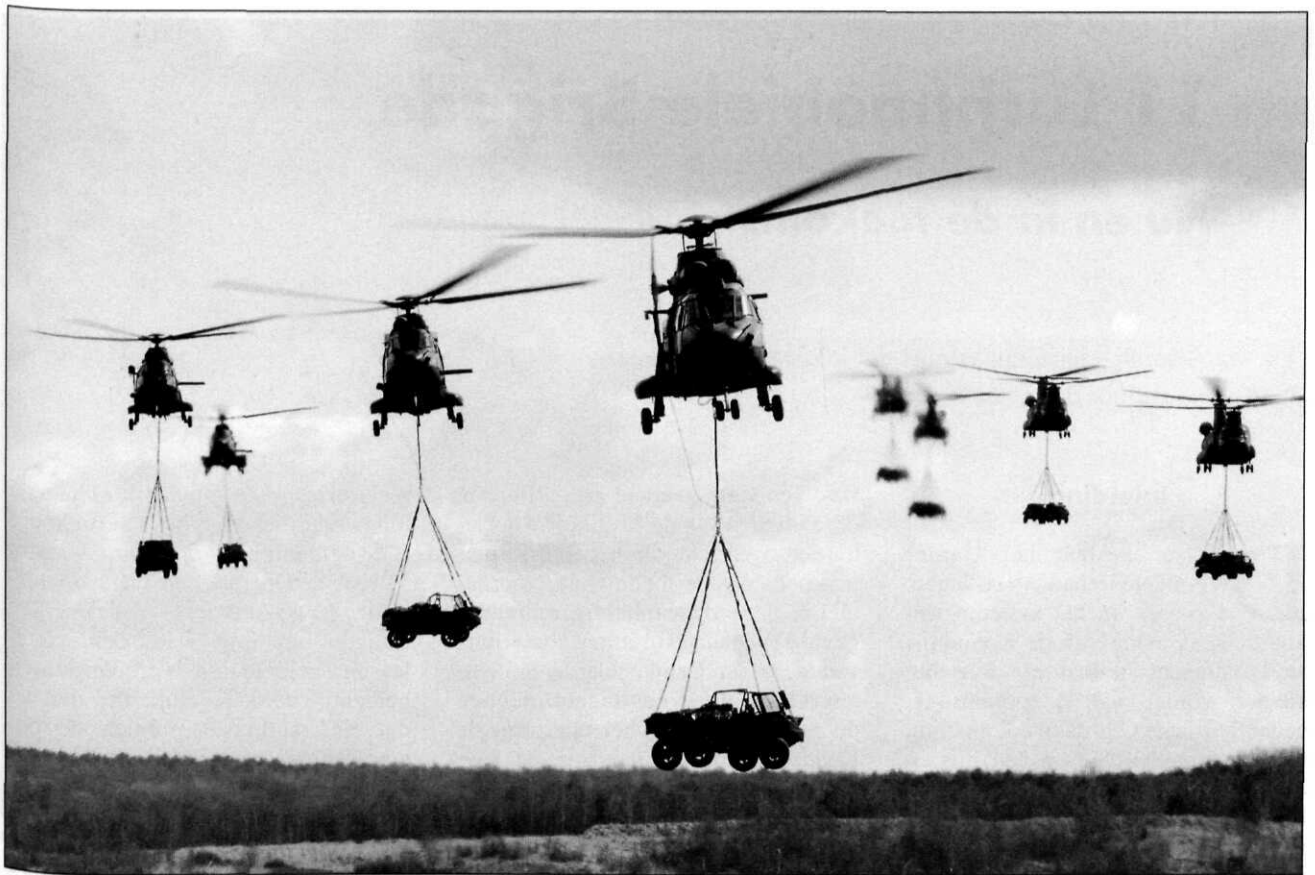
In oktober 2003 deed 11 Air Manoeuvre Brigade 'eindexamen' in Polen