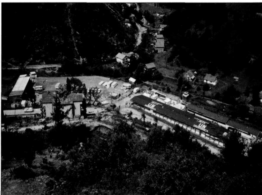
Bovenaanzicht van het basiskamp van Dutchbat bij Srebrenica-stad

De Serviërs, die beide gebieden belegerden, stelden de vastberadenheid