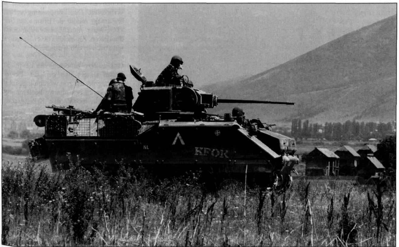
De Grenadiers en Jagers traden in Kosovo op als gemechaniseerde eenheid, uitgerust met de YPR-765