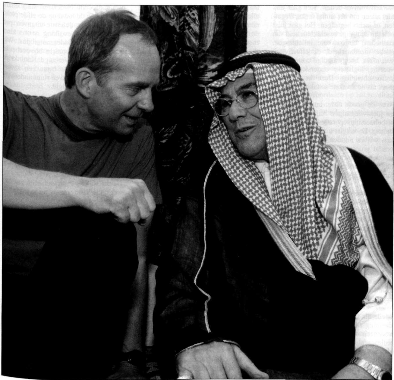
Minister Kamp bezoekt Bagdad en eenheden in Irak (september 2003).

Hij is op de tweede dag van zijn bezoek naar Bagdad gereisd om daar enkele leiders van SFIR te ontmoeten.