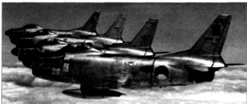
De K-versie van de F-86 'Sabre' was als 'Kaasjager' ook bij de klui in gebruik

optreden langs het gehele front ook in 1952 en 1953 voort te zetten.