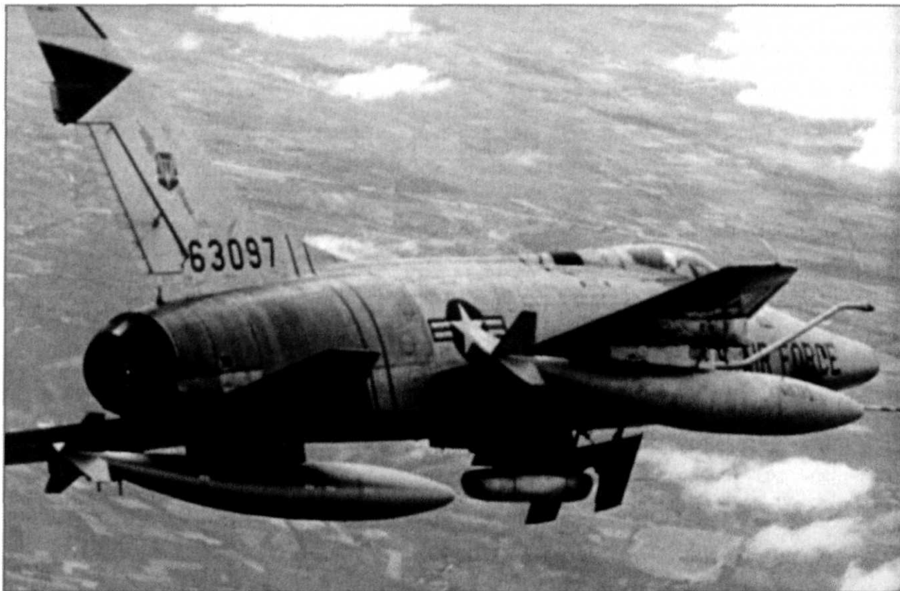
F-100 'Super Sabre' boven Vietnam

len binnen dertig mijl van de Chinese grens), het verbod om de rijstvelden en aanvoerlijnen aan te vallen (onder meer de haven van Haiphong en de spoorlijnen vanuit China). In de periode van de Vietnamoorlog hoorde men in USAF-kringen veelvuldig de verzuchting: