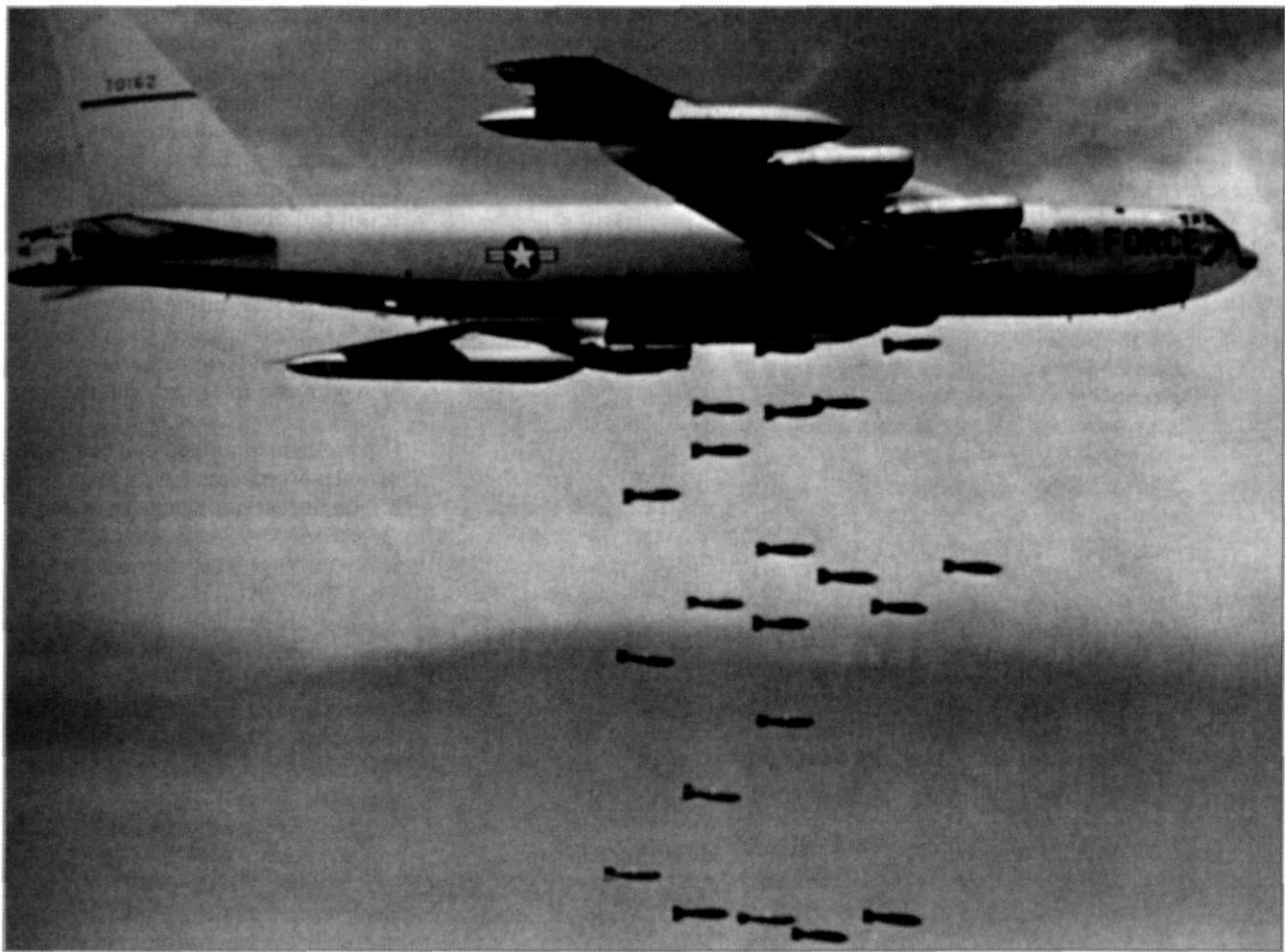
B-52 boven Vietnam

de reeks van aanvallen werden door Noord-Vietnam vooral gebruikt om zich te herstellen, te hergroeperen, logistieke ondersteuning te leveren en zich voor te bereiden op een nieuwe fase van verzet en militair optreden. Het was ook de periode van toenemende weerstand aan Noord-Vietnamese zijde, waarbij de dreiging van SAM en het luchtafweergeschut grootsere vormen aannamen. Op hun beurt beantwoordden de VS deze toename in luchtdreiging met adequate countermaatregelen onder meer in de vorm van zogenaamde hunter - killer teams (Wild Weasel-vliegtuigen) en specifieke ECM-vliegtuigen.