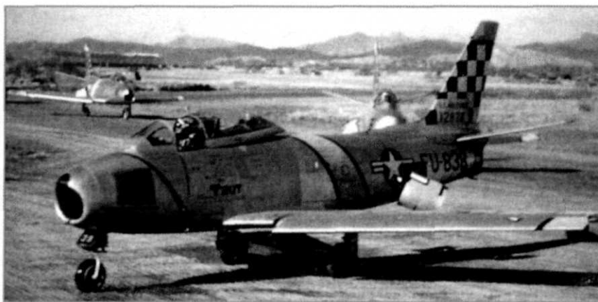
F-86 'Sabre'

van de aanvoer van voorraden voor de communistische troepen in de frontlijn via het Noord-Koreaanse wegen- en spoorwegstelsel. Met name door de inzet van zeer grote aantallen arbeiders, die klokkrond werkten om de aangerichte schade te herstellen, was van een echt succes van interdictie in het algemeen, en deze interdictieoperaties in het bijzonder, geen sprake. Ondanks de zware schade die de interdictieoperaties aanrichtten, heeft dit op zichzelf de communisten er nooit van kunnen overtuigen een wapenstilstand aan te gaan. Dit betekende dat de Noord-Koreanen en Chinezen in staat bleven hun offensief