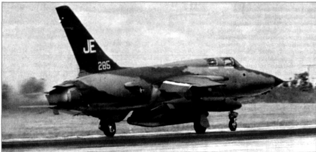
De F-105 werd intensief gebruikt in Vietnam

Op operationeel-tactisch niveau is een belangrijke les het hebben, of zonodig creëren, van eenheid in commandovoering. Tijdens beide conflicten bleken de Amerikanen met dit beginsel problemen te hebben. Ook het adagium 'centralized control, decentralized execution' is een belangrijke les die valt te leren. Overigens heeft de Golfoorlog aange-