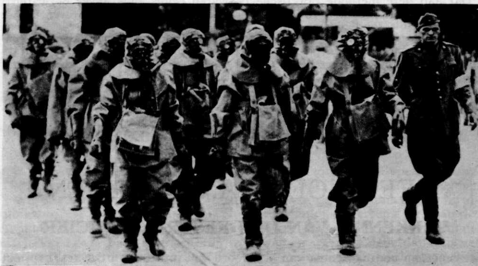
Italiaansche gasontsmettingsploeg bij de manoeuvres in 1935.

beroeps- onder officieren kan reeds, door de plaats gehad hebbende 3-weeksche cursussen, geacht worden voldoende op de hoogte te zijn gebracht voor hun taak. Bij aanvulling van dit korps, zal de gasofficier ook bij deze opleiding de noodzakelijke kennis moeten bijbrengen!