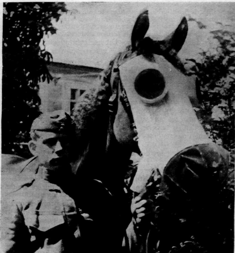
Paardengasmasker, dat in het Oostenrijksche leger in beproeving is. Bijzondere aandacht verdienen: 1e. de keuze van de afsluitlijn; 2e. de wijze waarop de teugel in het masker wordt binnengevoerd. (Zie het uitstekende gedeelte van het masker bij de hand van den Soldaat).

teur , gedurende de eerste opleidingsperiode en degene, die de werkzaamheden van dit personeel, vermeerderd met de alsdan onder de wapenen zijnde gasvaandrigen en reserve-gasofficieren, moet leiden gedurende de periode, waarin het aan hun geleerde praktisch bij den troep moet worden toegepast.