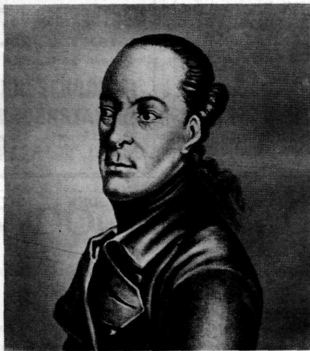
WILHELM I. GRAF ZU SCHAUMBURG—LIPPE.