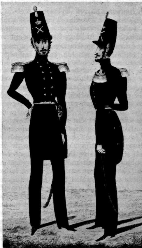
Officieren der artillerie van het Limburgsche contingent.

1830 niet had ingegrepen om het gezag van één zijner vorsten te handhaven, kwam echter met zijne aanspraken tusschen beide, toen de Koning der Nederlanden bij het Verdrag van Londen in 1839 er in toestemde, dat een gedeelte van Luxemburg aan België kwam. Het westelijk deel van Luxemburg — het Waalsche deel — kwam volgens dit verdrag aan België en trad geheel uit den Duitschen Bond, terwijl door de mogendheden aan België geen verplichtingen ten opzichte van den Duitschen Bond werden opgelegd. Den Koning werd een schadeloosstelling in grondgebied in Limburg toegewezen. De Bondsvergadering wilde hare toestemming tot de schikking alleen dan geven, indien het Hertogdom Limburg een deel van den Duitschen Bond zou uitmaken. Aan dezen eisch werd toegegeven.