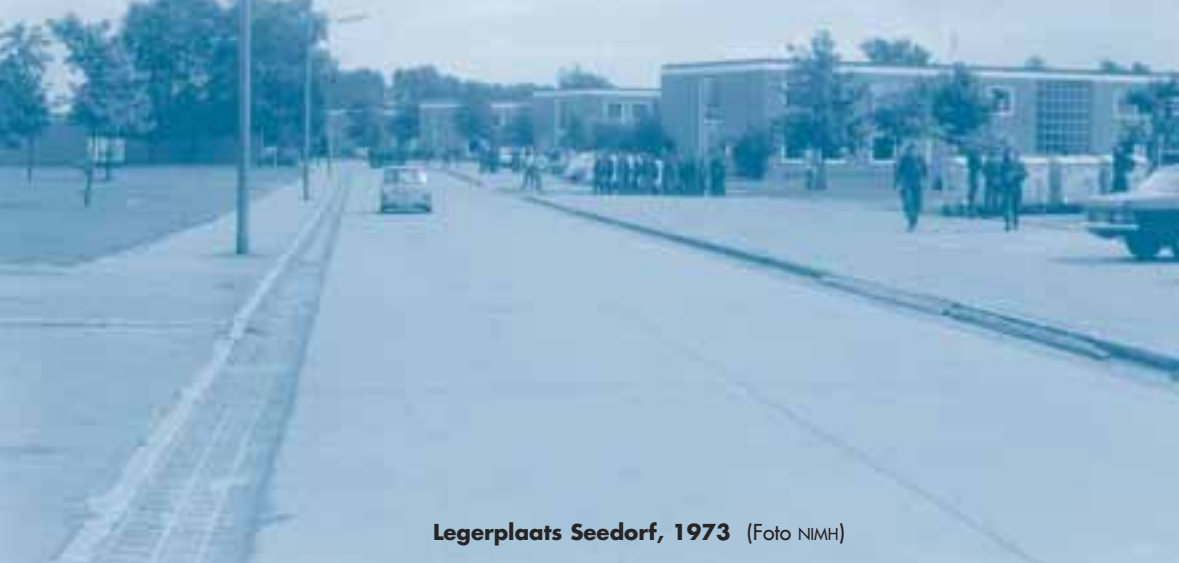
Legerplaats Seedorf, 1973

Transitieraden, de Herstructureringswerkgroepen, de Samsons of hoe de representanten van de Haagsche bureaucratische saneermachine ook mochten heten.