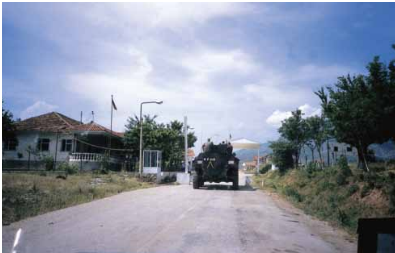
DEU 'Fuchs' near border crossing with Albania

nance personnel in Aachen will be shifted to Soesterberg/NLD. In return, training of PzH 2000 maintenance personnel in Aachen is depending on the training simulator – 'training equipment maintenance chassis' which will be provided by NLD.