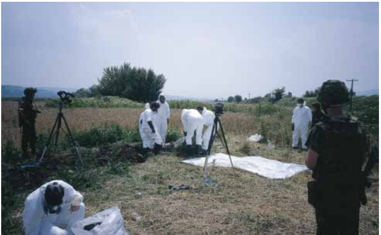
Forensische teams (ICTY) onderzoeken de 'plaats delict' bij Orahovac

Leidde de inzet van Duitse troepen in Kosovo in 1999 nationaal nog tot principiële discussies, nu beperkt de discussie zich tot technische kwesties (budget en capaciteit) en de waardering van risico's. De Duitse deelname aan internationale operaties is zelfs zo vanzelfsprekend geworden, dat het optreden als lead nation als inherent wordt beschouwd aan de omvang van het land en het 'expeditie-naire karakter' van de nieuwe structuur van de strijdkrachten.