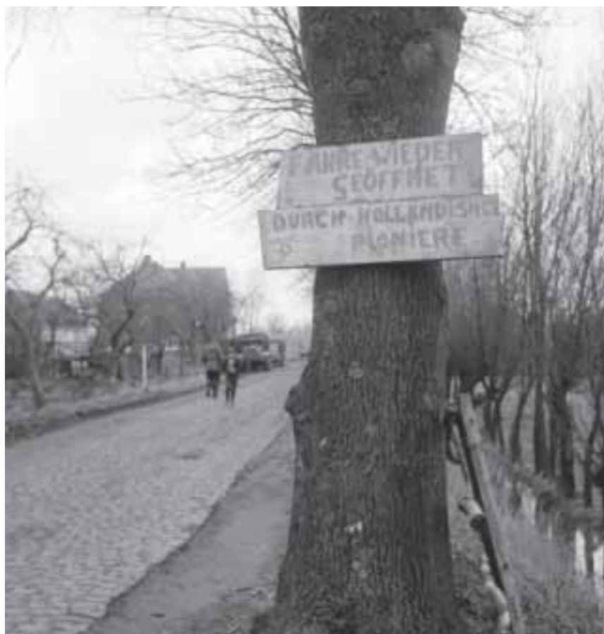
Nederlandse bijstand tijdens stormvloed bij Hamburg, februari 1962