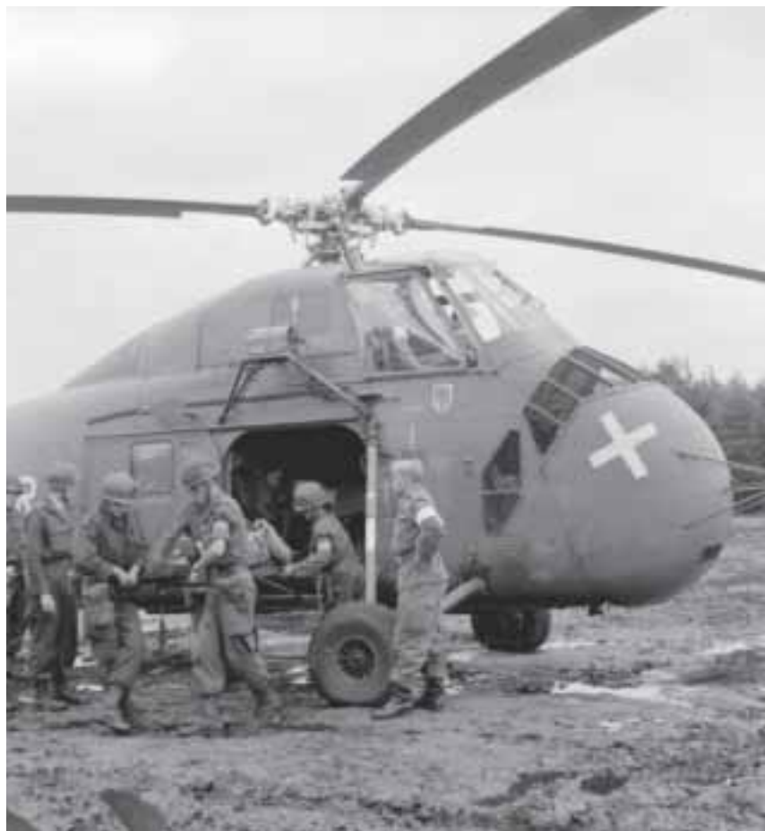
Gezamenlijke oefening van Nederlandse en Duitse eenheden, Lüneburger Heide, herfst 1965

Budel is dit jaar al door de Duitsers ontruimd. In de loop der jaren waren er nog enkele aanvullingen in de bezetting geweest. In de jaren zeventig heeft, naast de opleidingseenheden, enige tijd een geneeskundige com-