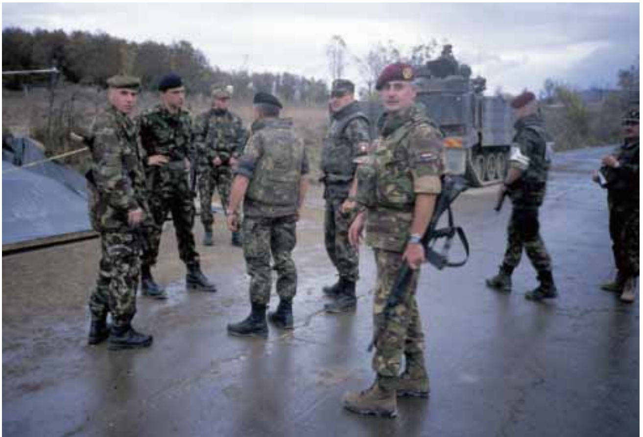
International 'Show of Force' near Roadblock

As of the 1 st of May 2006 two-turret trainer PzH 2000 will be installed at the Artillery school in IDAR-Oberstein, from 1 st of June on the Dutch training division in DEU will be manned until 1 st of October 2006 the students will follow. The current training course for German Fennek mainte-