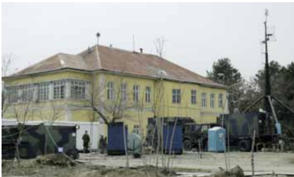
Headquarters International Security Assistance Force III, Kabul, Afghanistan (2003)

been indispensable. The deployment of the Corps to Afghanistan was the first time the two framework nations executed command together. The coordinated national C2 from two geographically divided operations centres in Potsdam and The Hague underlined the bi-national capability to command an operation.