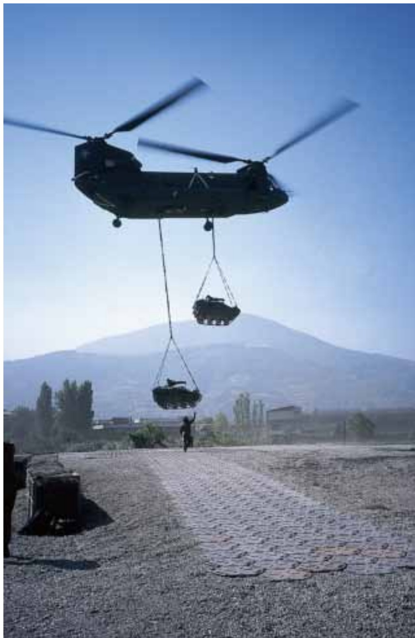
Nederlandse Chinook-helikopter met Duitse Wiesel-gevechtsvoertuigen als 'underslung'

gekende welvaart heeft gebracht, met hoge lonen, zeer gunstige arbeidsomstandigheden en een bevolking die gewend raakte aan materiële vooruitgang.