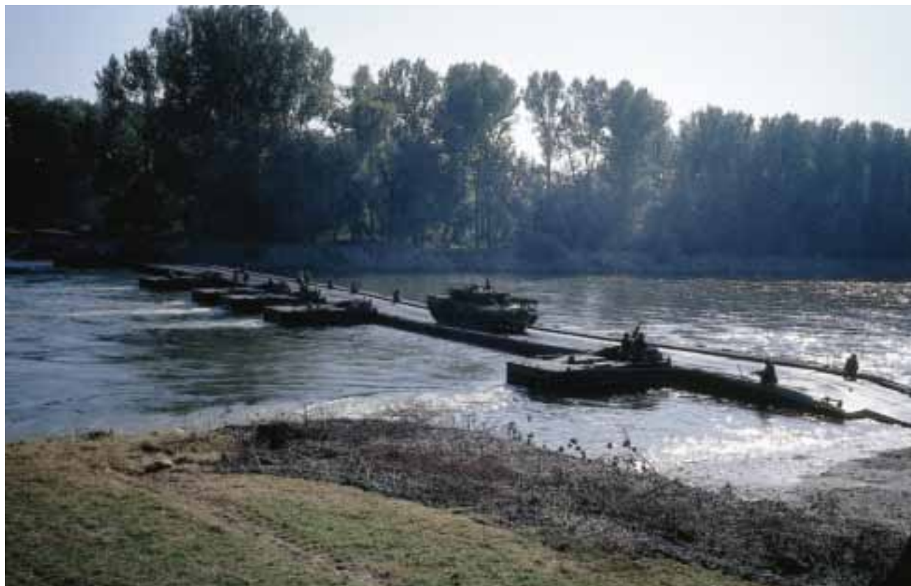
A Leopard-tank creates a cross over in the river

The implementation of the German Netherlands Army Steering Group (ASG), headed by representatives of both Army Staffs on one-star level, in 2004 was an important step into that direction and will be the primary forum to co-ordinate future efforts of both armies.