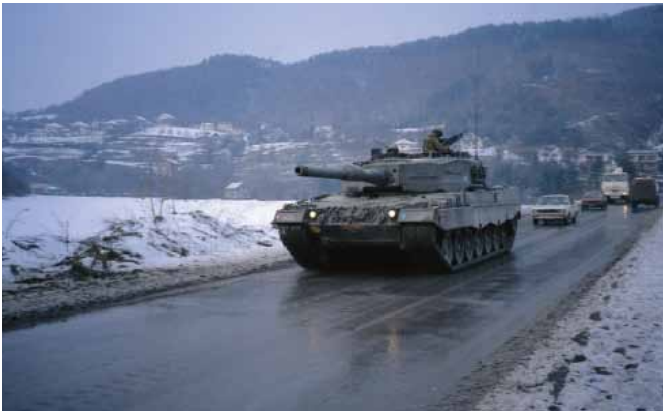
NLD Leopard II near Busovača (former Yugoslavia)

Common concepts, policy, doctrine and procedures are the essential basis for a systematic approach towards all subsequent areas of co-operation. Although within the NATO doctrinal