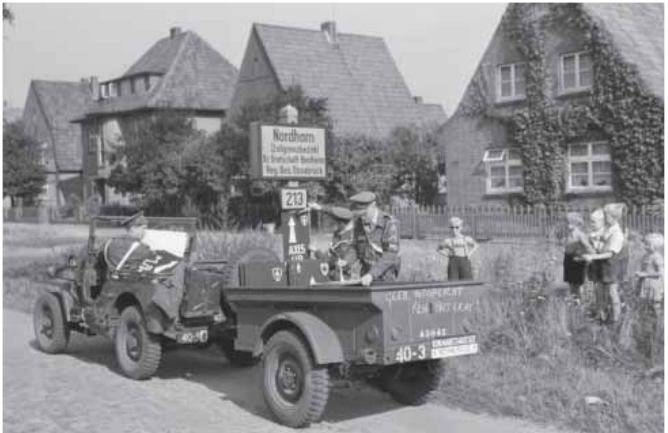
NAVO-oefening 'Grand Repulse', Duitsland, 1953