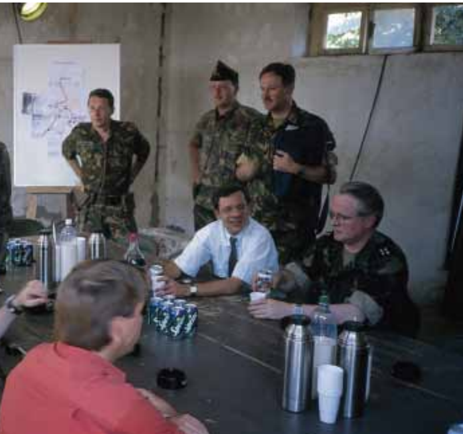
Politiek-operationeel overleg op hoog niveau, Prizren, 1999

Zoals reeds gezegd speelden bij de verkiezingen voornamelijk sociaal-economische thema's een rol. De huidige sociaal-economische omstandigheden moeten worden geplaatst tegen de achtergrond van het naoorlogse Wirtschaftswunder , dat Duitsland on-