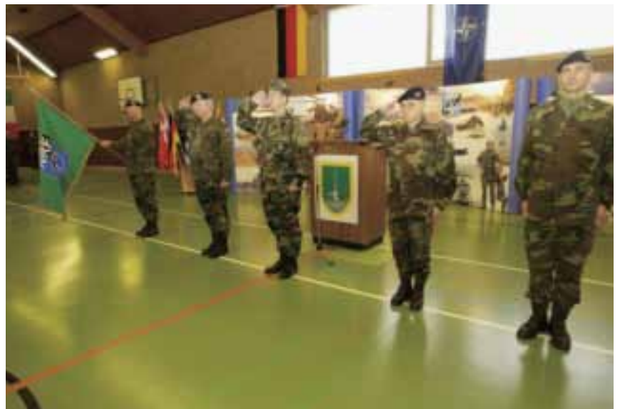
NRF handover ceremony: On 14 January 2005 Admiral Mullen, COM JFC Naples handed over the NRF LCC responsibilities from NRF3 LCC to NRF LCC, 1(GE/NL) Corps

As in other European countries, Germany is restructuring its armed forces and has had to set priorities in its commitments. Germany plans to focus its commitments to Multinational Corps HQ's based on partnership between nations and the high probability of a common deployment. It is generally assessed that the co-operation with the Netherlands through HQ 1 (GE/NL) Corps is successful and uncomplicated. For Germany HQ 1 (GE/NL) Corps has proven itself during the ISAF Mission and as the LCC for NRF 4, creating common standards on material, training, procedures and