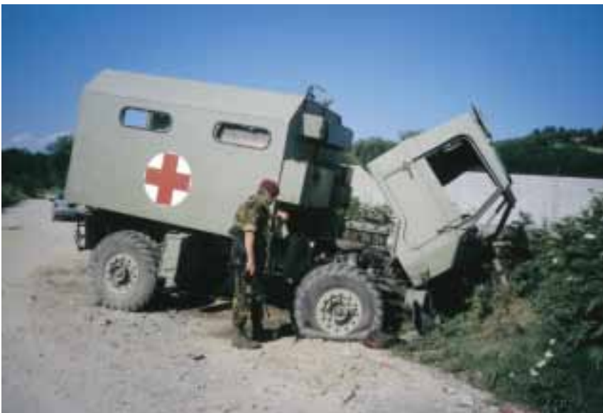
Kijk uit voor mijnen! Servische auto na mijnongeval

Dat is dan ook voor Nederland de overweging geweest het voorzitterschap van deze werkgroep te accepteren. Maar omdat zoals gezegd op