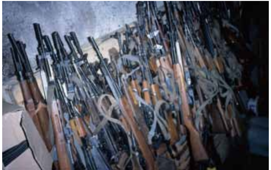
In beslag genomen handvuurwapens, Prizren, juli 1999