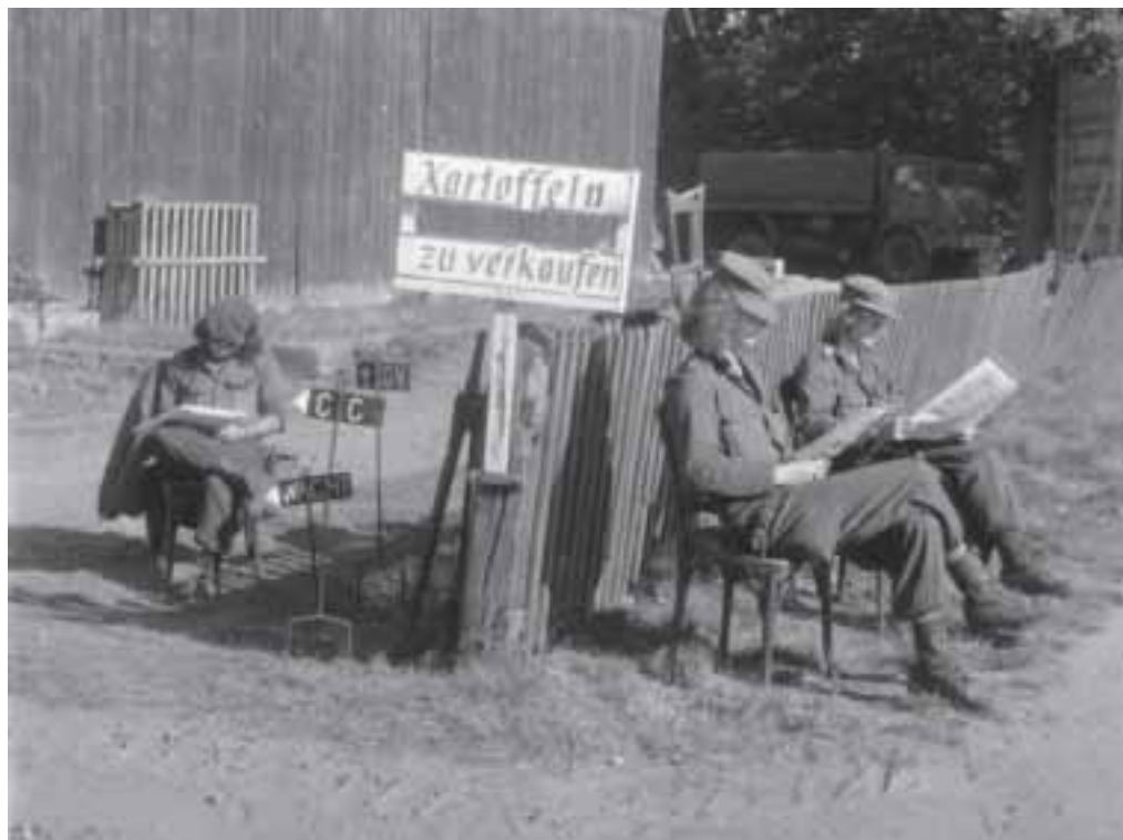
Oefening 'Big Ferro', Duitsland, 1973