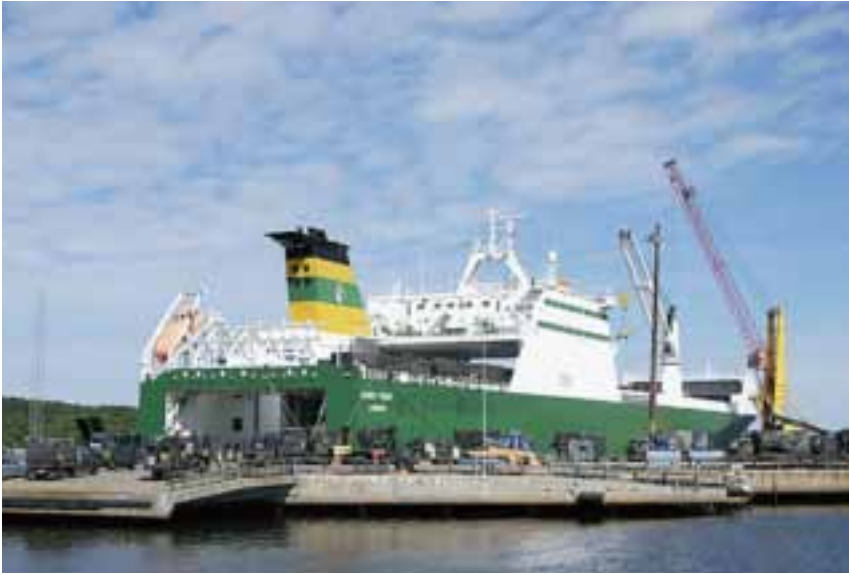
Strategic deployment during exercise IRON SWORD (Norway, May 2005)

is preparing, training and exercising in accordance with the Corps' motto for 2006: Strive for Excellence . Every individual is gaining and maintaining the required level of expertise, whilst training and on exercise. HQ 1 (GE/NL) Corps, including Staff Support Battalion and CIS Battalion, trains in operational planning and in operational deployments. For this reason the Corps incorporates Corps Troops to train and exercise with. In 2006, HQ 1 (GE/NL) Corps will organise and execute exercises JOINT SWORD and JAGGED SWORD. In exercise JOINT SWORD (April 2006), three divisional HQ's from Norway, France and Germany will participate. In exercise JAGGED SWORD (September/October 2006), 11 Air Manoeuvre Brigade will be trained.