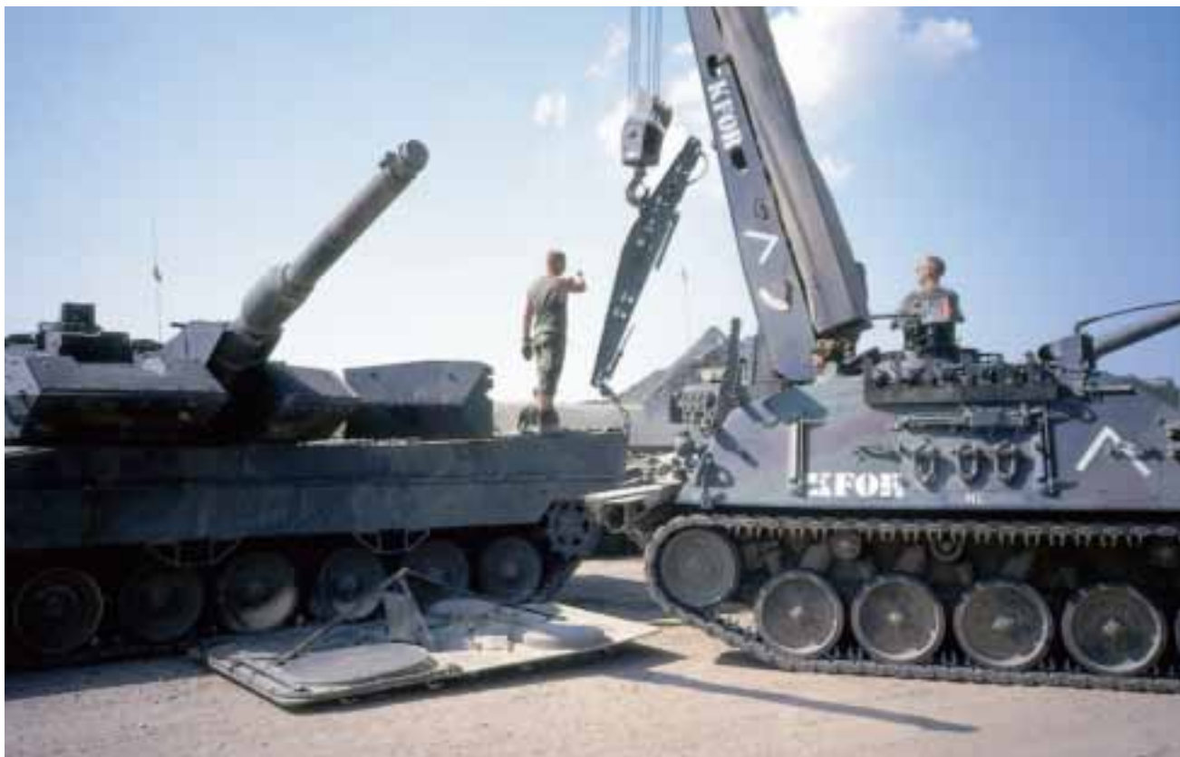
Onderhoud te velde