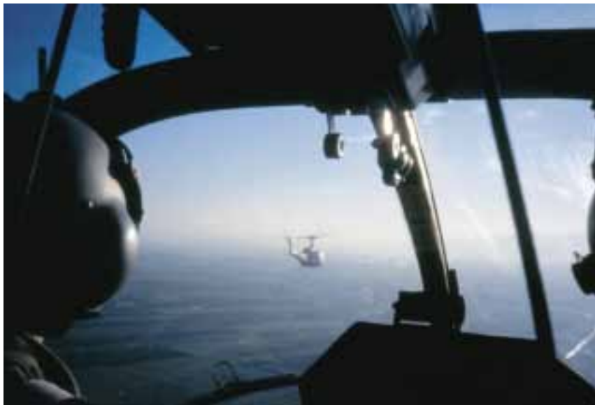
Verplaatsing per helikopter

Op basis van de Aanvullende Overeenkomst heeft het gastland recht op vergoeding van de restwaarde bij hergebruik door het gastheerland van de