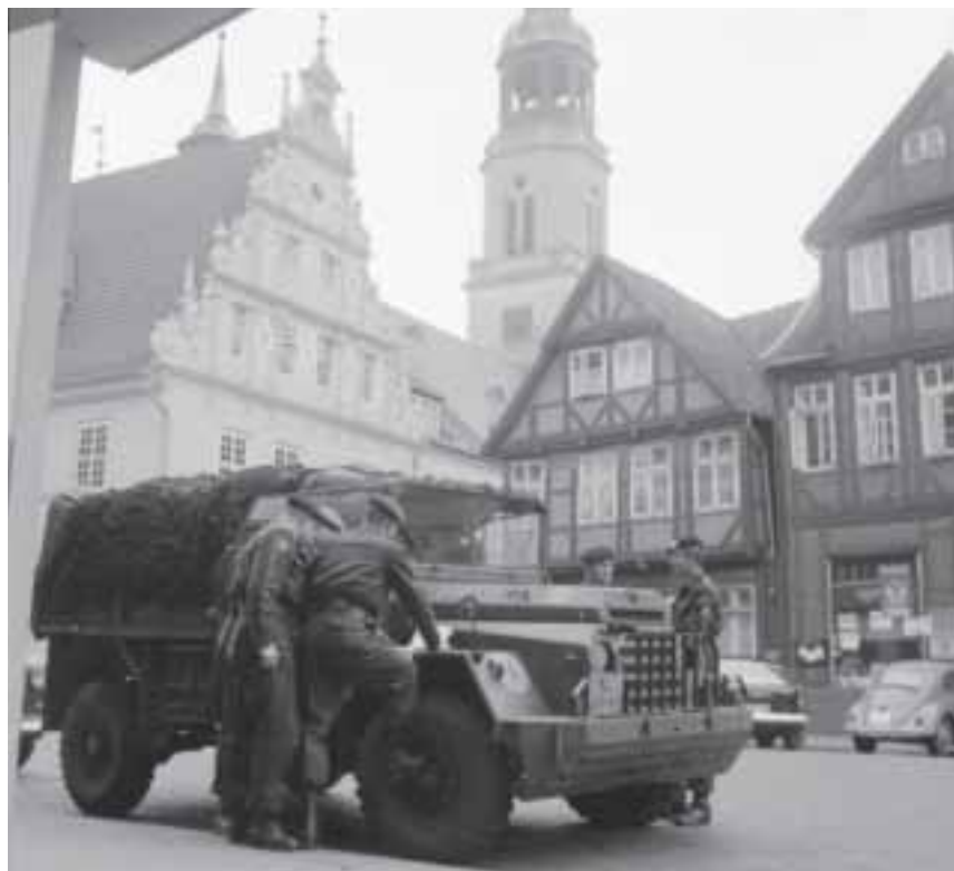
Oefening Lichte Brigade, omgeving Hohne, november 1961

tactische nucleaire wapens in de geallieerde defensie maakten het mogelijk in 1958 de hoofdverdedigingslinie 'vooruit' te schuiven naar de rivieren de Weser en de Fulda. Dat was voor Nederland strategisch gezien een historisch moment.