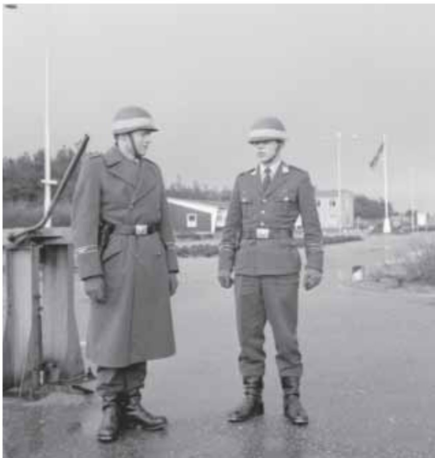
Duitse militairen in legerplaats Budel, 1967

snel bleek bovendien dat de militairen veel geld in de laatjes van de plaatselijke middenstand brachten.