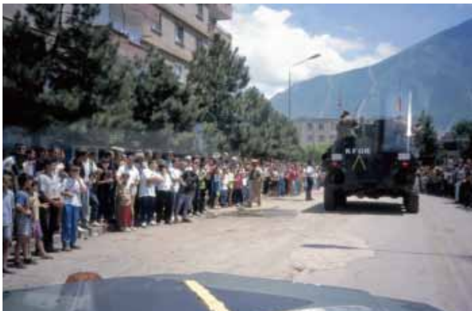
KFOR at Kukesch (Albania)

In addition, common procurement projects, first considerations on improving military effectiveness by making use of synergetic effects, co-operation in the field of training and exercise and efficiency in system management contributed to a deeper integration.