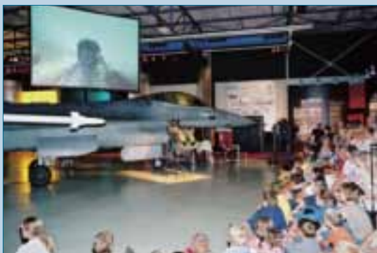
De theatervoorstelling 'Vlucht van de Eeuw' in het Militaire Luchtvaart Museum

De voorstelling 'Vlucht van de Eeuw' toont de bezoekers van het Militaire Luchtvaart Museum de hoogtepunten en ontwikkelingen in de geschiedenis van de luchtvaart. Van het eerste gemotoriseerde toestel, de Wright-Flyer, tot de hedendaagse 'fly-by-wire' F-16 straaljager. Ook de technische ontwikkelingen op het gebied van vliegtuigen en vliegtuigmotoren en de opkomst van de burgerluchtvaart worden op interessante wijze belicht.