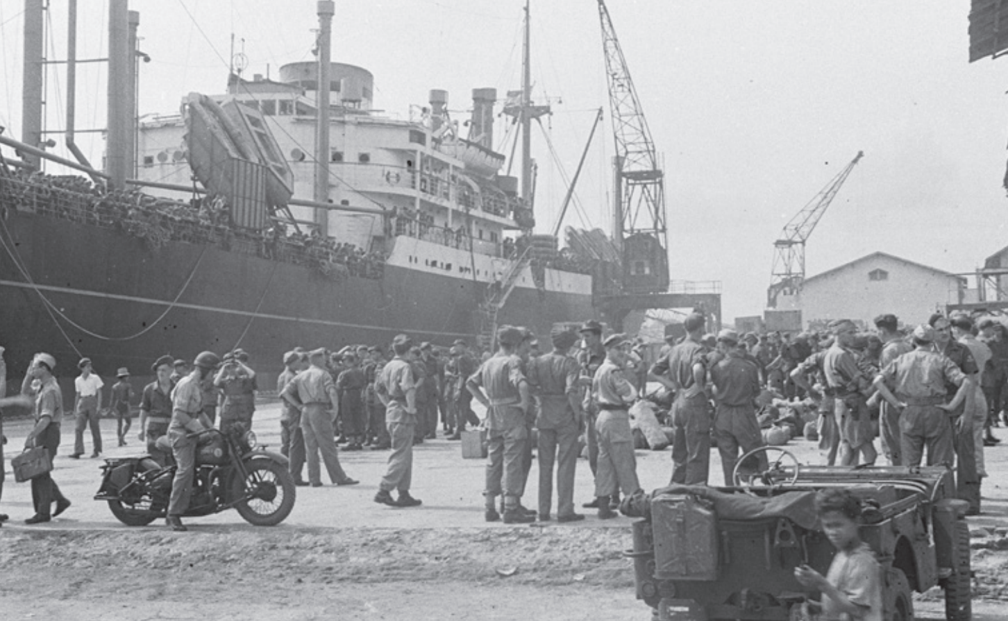
Aankomst van het troepen transportschip Sloterdijk in Tandjong Priok, 1946: 'Als ik veteranen persoonlijk sprak kwamen er meer dan eens verhalen los over wat ze aan nare zaken meegemaakt hadden, zoals een marteling of het platbranden van een kampong'