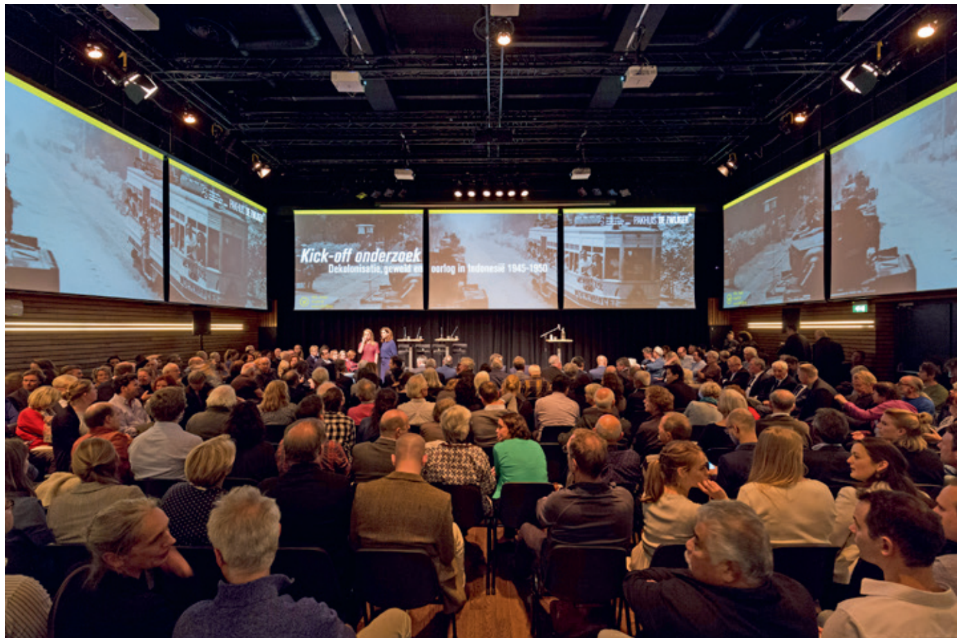
Kick-off onder grote publieke belangstelling van het grote Indië-onderzoek in Pakhuis De Zwijger in Amsterdam, 2017