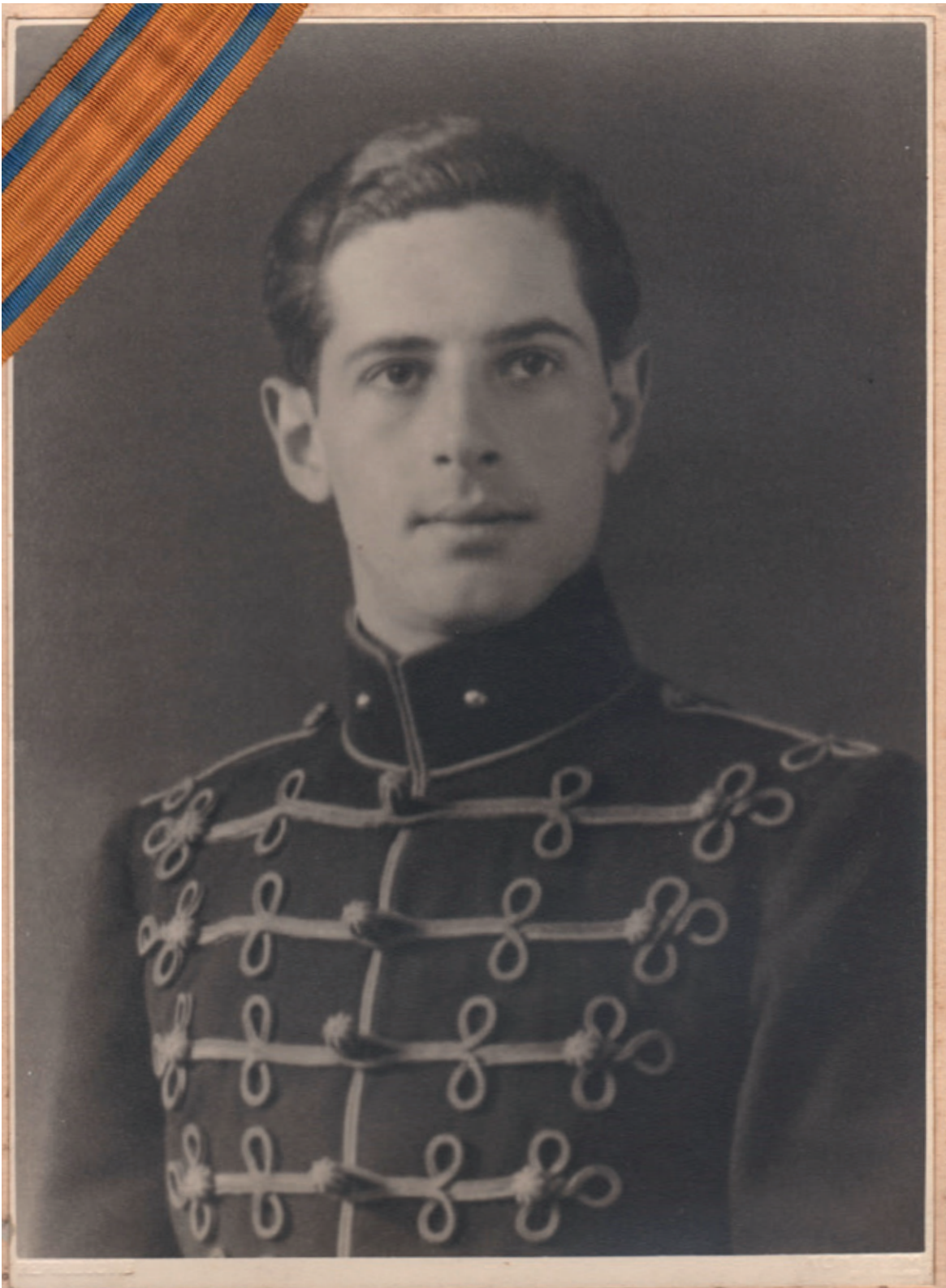
Van een zorgeloze student veranderde George Maduro uiteindelijk in een officier en verzetsstrijder