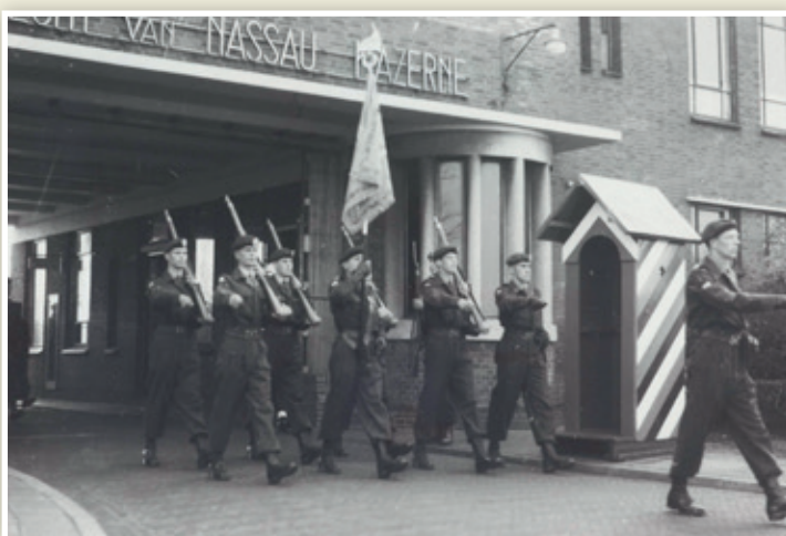
Volgens het Bureau Reglementen waren er ook militairen gesignaleerd 'die met passen van een meter liepen'