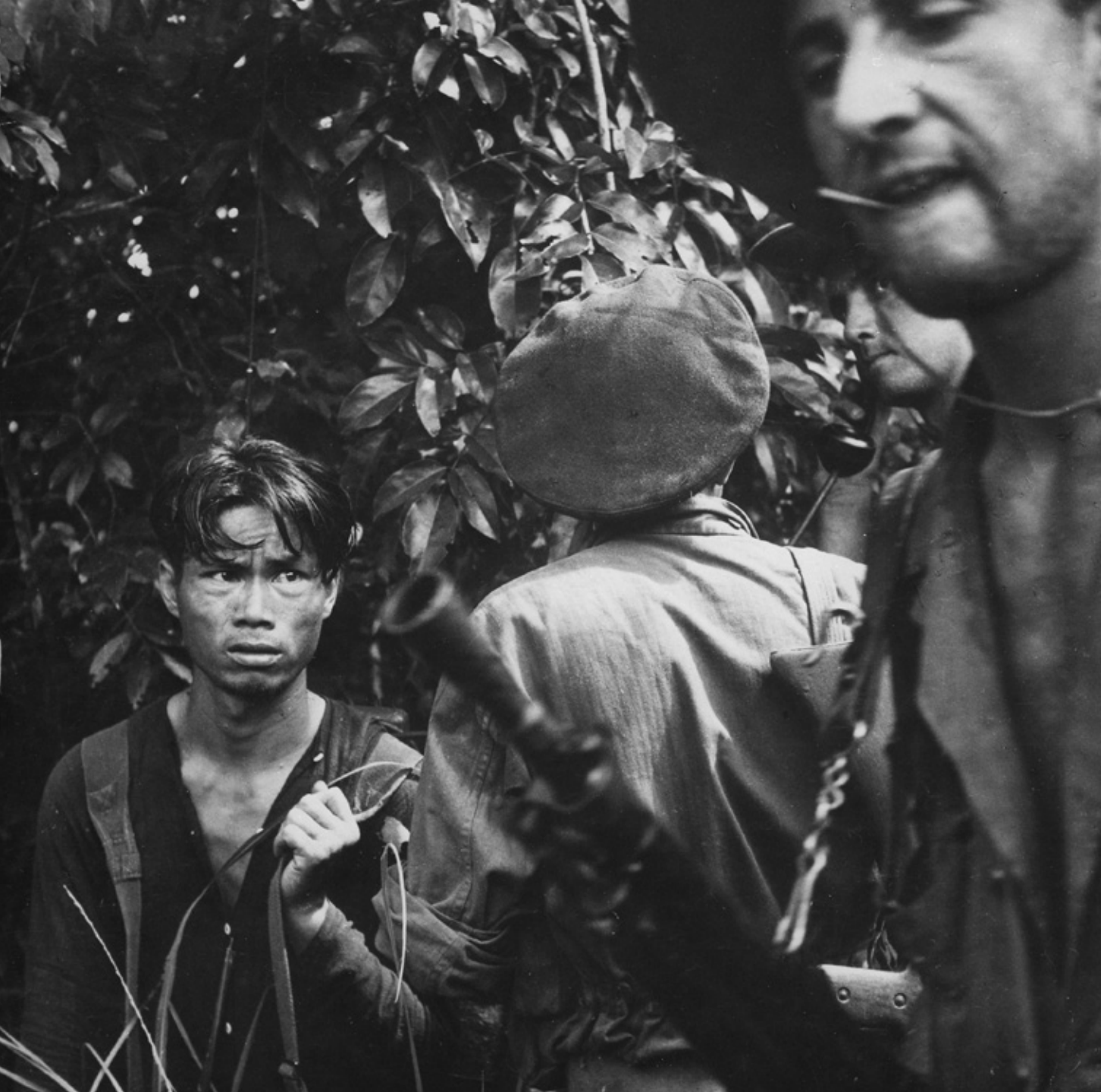
Franse Legionairs ondervragen een Vietminh-verdachte in 1953