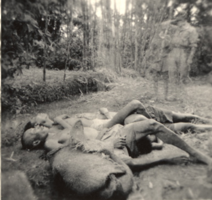
Een jonge Nederlandse infanterist fotografeerde in september 1947 op Midden-Java de executie van vier gevangengenomen Indonesiërs door zijn peloton. Achterop de foto's schreef hij: 'Het lot der rampokkers', 'Zij verkozen Merdeka boven samenwerking' en 'Als afschrikwekkend voorbeeld voor de bevolking'