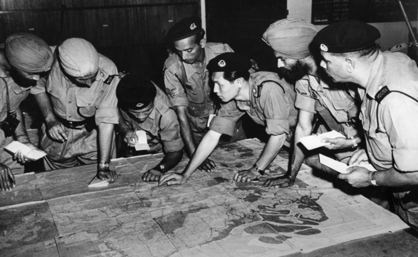
Briefing ter voorbereiding van een nachtelijke operatie tegen communistische opstandelingen tijdens de Malayan Emergency (1948-1960)