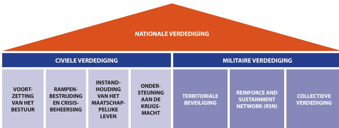
Figuur 1 Samenhang tussen civiele en militaire verdediging

verdediging zijn voortzetting van het bestuur; rampenbestrijding en crisisbeheersing; instandhouding van het maatschappelijke leven; en ondersteuning aan de krijgsmacht.