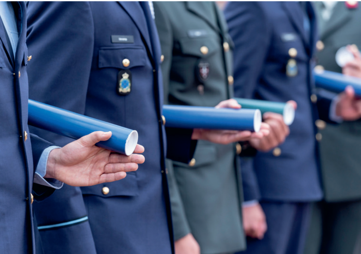
Buluitreiking op de NLDA. De sectie Irreguliere Oorlogvoering & Speciale Operaties is inmiddels met verschillende vakken actief in nagenoeg alle opleidingen van de NLDA