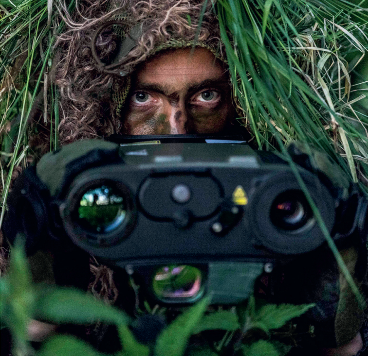
Special Reconnaissance was een van de taakstellingen voor speciale troepen na het einde van de Koude Oorlog