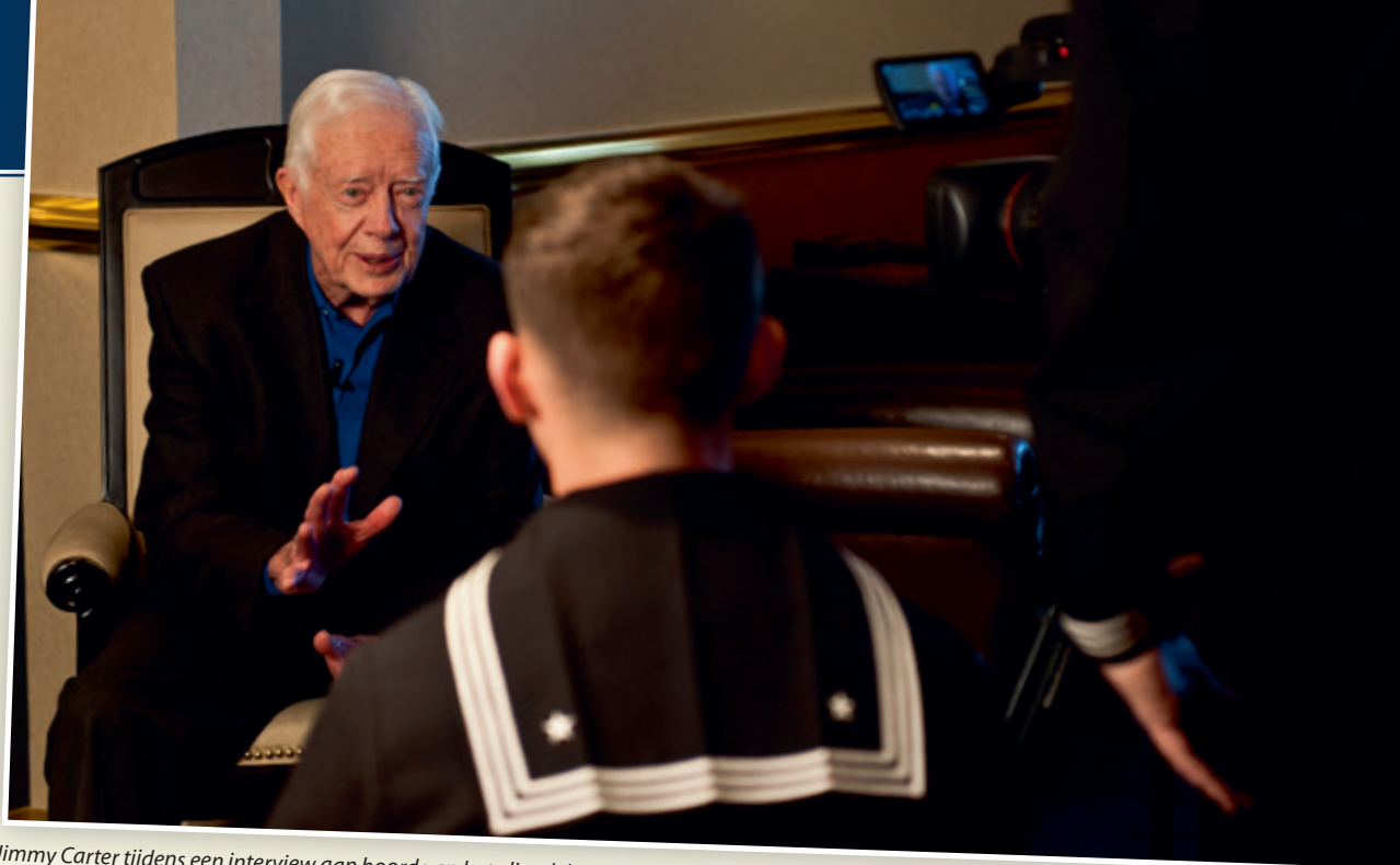
Jimmy Carter tijdens een interview aan boord van het vliegdekschip USS Carl Vinson: de voormalige president bleef de marine altijd een warm hart toedragen.

vliegdekschip USS Nimitz in de Indische Oceaan naar Desert One, een gebied met die codenaam in het midden van Iran. De helikopters werden bestuurd door vliegers van het US Marine Corps, gespecialiseerd in het vliegen bij nacht en op lage hoogte. In Desert One was een rendez-vous voorzien met zes C-130's van de US Air Force, met behalve brandstof en voorraden ook de 90 commando's aan boord, die daar op de helikopters zouden overstappen voor een korte vlucht richting Teheran. Het team moest zich verborgen houden in de bergen, tot vrachtwagens arriveerden die hen naar de hoofdstad zouden brengen. Nadat het reddingsteam de ambassade was binnengedrongen en de gijzelaars had bevrijd, zou iedereen per helikopter naar een verlaten vliegveld bij Teheran worden gebracht, waar twee C-141's zouden klaarstaan om via Saudi-Arabië de vrijheid tegemoet te vliegen. De helikopters zouden worden achtergelaten in Iran.