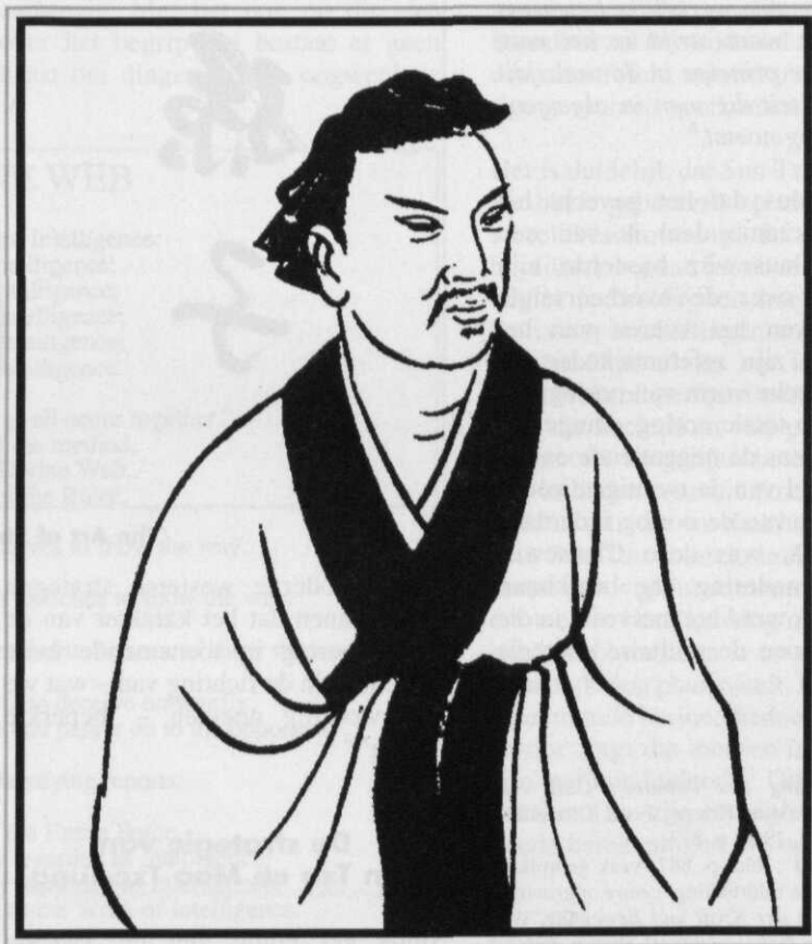
Portret van Sun Tzu (Uit: 'The Art of Strategy')

Als de aanname correct is dat kleinschaliger conflicten in de nabije toekomst zullen overheersen, dan passen Sun Tzu's ideeën beter bij de toekomstige behoefte van de westerse strategieën. Daarom moeten zij Sun Tzu's ideeën toevoegen aan hun gedachtegoed bij hun voorbereiding op potentiële conflicten.