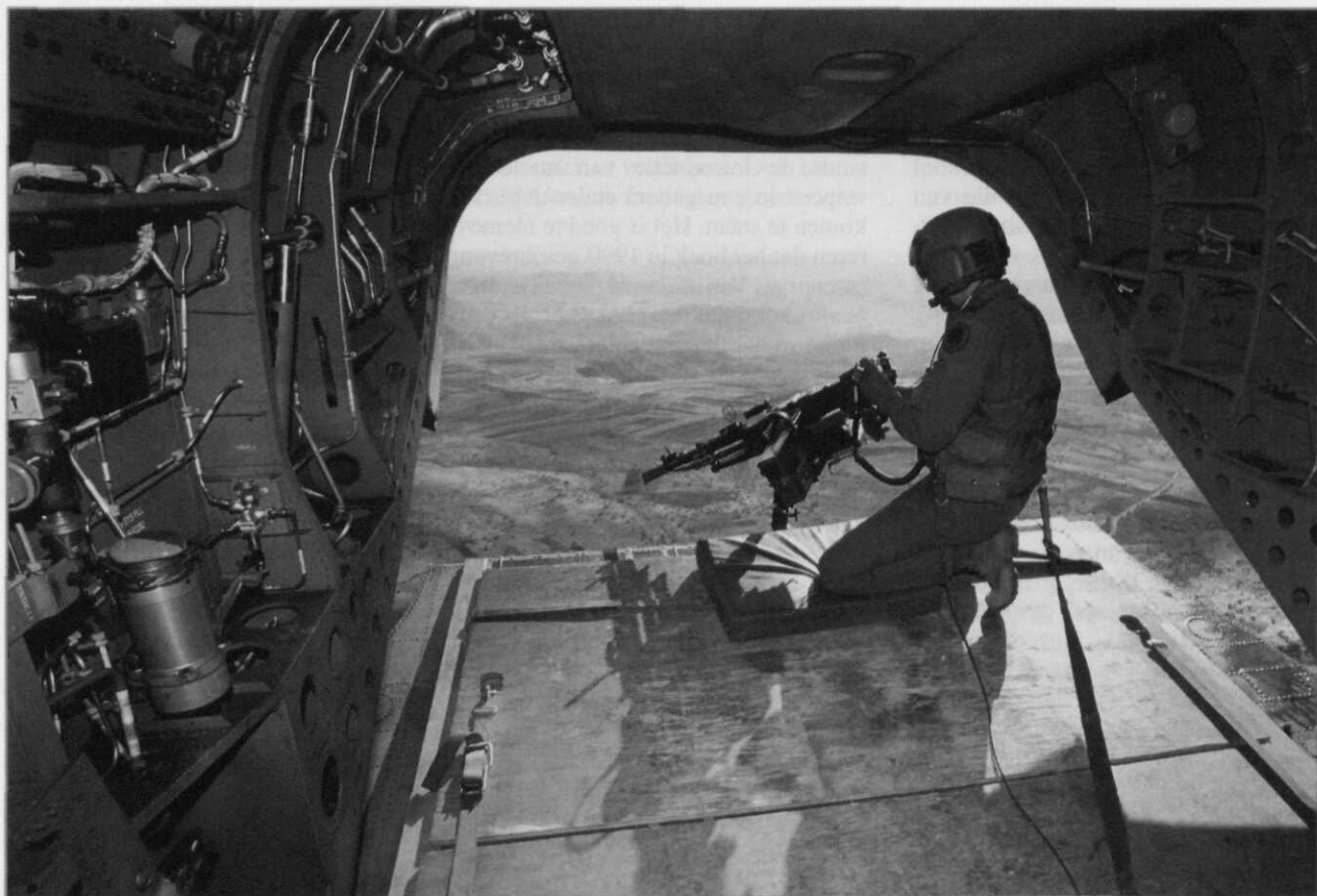
Het veelvuldig uitvoeren van joint-operaties maakt een herbezinning op de rol van de CBS noodzakelijk

Als dat laatste zou gebeuren, zou de Nederlandse krijgsmacht na een lange afwezigheid feitelijk weer over een eigen 'generale staf' beschikken, in de klassieke zin van het woord. Het zal immers gaan om een stafelement op het hoogste niveau van organisatie, direct verbonden met de politieke leiding, dat zich uitsluitend bezig zal houden met de planning en uitvoering van militaire operaties.