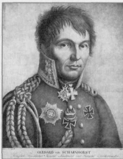
Gerhard von Scharnhorst heeft rond 1800 de basis gelegd voor het hogere militair onderwijs en de generale staf (Foto: Scharnhorsts Vermächtnis van prof.dr. Höhn, Bonn 1952)

Om dit alles te kunnen bewerkstelligen werden de officiersrangen ook opengesteld voor met name de burge-