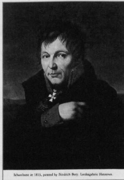
Scharnhorst in 1813, painted by Friedrich Bury, Landtagalerie Hannover.

Strenge selectie, gedegen opleiding, langdurige training en relevante tewerkstelling waren de kernbegrippen in dit systeem en om hierin te kunnen voorzien, werd de generale staf bewust in omvang zeer klein