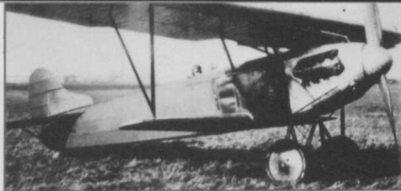
Afb. 4 Fokker D-XIII

Rond deze voor toenmalige begrippen zeer mo-