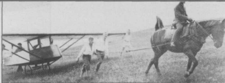
Afb. 2 Zweefvliegen met steun van de Reichswehr...