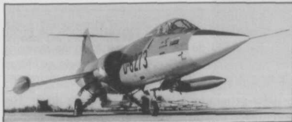
Afb. 2 Een door de Noordgroep geproduceerde en bij Fokker op Schiphol geassembleerde F-104G Starfighter, na testvlucht gereed voor aflevering aan de KLu; op de achtergrond enkele machines voor de Luftwaffe

De productie binnen de Noordgroep van 350 vliegtuigen (255 voor de BRD en 95 voor Nederland) was als volgt geregeld. De Duitse fabrieken Focke-Wulf en Weserflug bouwden samen romp-middenstukken, die naar Aviolanda werden vervoerd. Samen met door Hamburger Flugzeugbau gefabriceerde rompvoorstukken bouwde Aviolan-