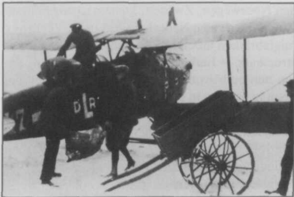
Afb. 1 Luchtpost met voormalige militaire toestellen. . .

Duitsland was na de Eerste Wereldoorlog in economisch en militair opzicht vrijwel leeggebloed. In totaal verloor het Duitse Rijk een zevende van zijn gebied en een tiende van de bevolking. Uit militair oogpunt moest het land t.o.v. de Ententemogendheden feitelijk weerloos worden gemaakt, zonder het nu direct van een grensbescherming of politiemacht te beroven. De dienstplicht werd afgeschaft. Het leger mocht niet meer dan 100.000 en de marine niet meer dan 15.000 uitsluitend beroepsmilitairen tellen. De Generale Staf werd verboden, wapenning en munitievoorraden werden beperkt. Pantsereenheden, luchtmacht, onder-