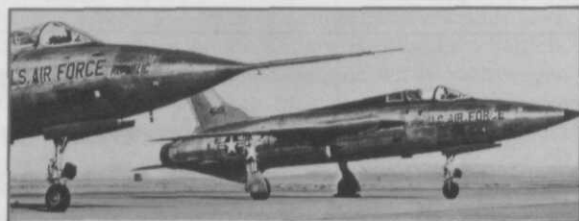
Afb. 1 De USAF koos aan het eind van de jaren '50 voor zware gespecialiseerde gevechtsvliegtuigen, zoals de hier afgebeelde Republic F-105B jagerbommenwerper voor het aanvallen van gronddoelen; Duitsland, en later ook Nederland en België, kozen daarentegen voor een multi-role -gevechtsvliegtuig voor offensieve en defensieve taken

In de VS was in de tweede helft van de jaren '50 een groot aantal gevechtsvliegtuigen in ontwikkeling. Lockheed was met een zeer revolutionair ontwerp gekomen voor een lichte onderschepingsjager met grote prestaties, de F-104A Starfighter, die maar in kleine serie door de USAF was besteld, evenals de hieruit ontwikkelde F-104C-variant voor het aanvallen van gronddoelen. De USAF prefereerde voor die taken twee toestellen die aanmerkelijk groter, zwaarder en duurder waren, de Republic F-105 (afb. 1) voor het aanvallen