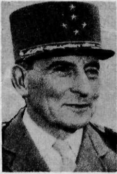
Generaal Jean de Lattre de Tassigny (2 feb. 1889 - 11 jan. 1952) werd in 1952 postuum tot maarschalk benoemd

ter sterkte van ongeveer 240.000 man, niet eens tegen.