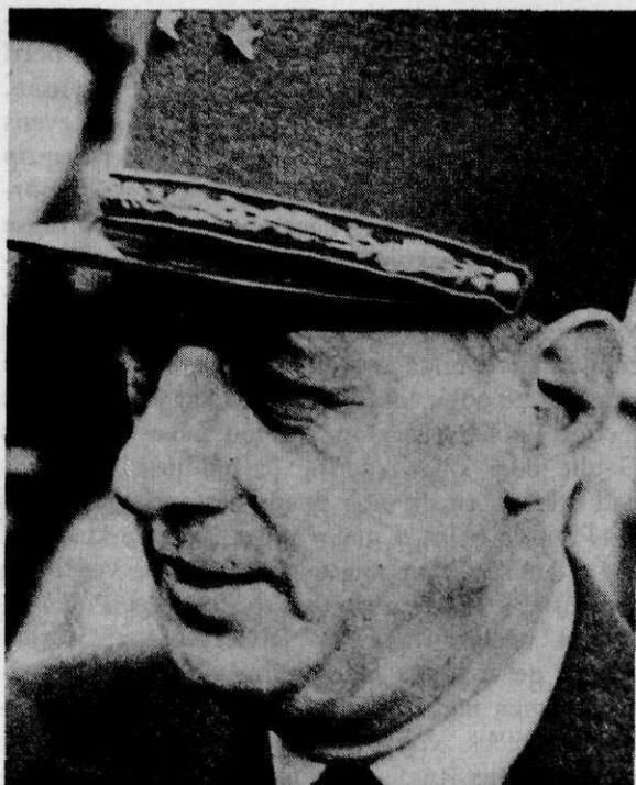
Generaal Charles de Gaulle (22 nov. 1890 - 9 nov. 1970)

Op 8 oktober 1944 werd de herstelde en gerepatrieerde generaal Giraud door De Gaulle ontvangen. Het werd opnieuw een hoffelijk gesprek, maar toch meende Giraud de hem aangeboden allerhoogste onderscheiding van het legioen van eer te moeten weigeren. Slechts korte tijd daarna