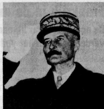
Generaal Henri-Honoré Giraud (18 jan. 1879 - 13 maart 1949)

De spectaculaire ontsnapping van generaal Giraud uit fort Königstein werd eveneens op 18 april 1942 bekend, een ontvluchting die in Duitsland ontsteltenis teweegbracht. Hitler was niet alleen op de hoogte van de internationale bekendheid die Giraud genoot, maar zag in hem tevens de auteur van het door hem zo bewonderde boek van De Gaulle „Vers l'armée de métier”. In zijn ogen was Giraud gelijkwaardig aan een tiental divisies en prompt werd een prijs van RM 100.000 op zijn hoofd gezet. Toen een Gestapo-onderzoek aantoonde dat Giraud een groot gedeelte van zijn vluchtroute per trein had afgelegd en dat hij in zijn coupé zelfs met een Duitse officier uitgebreid van gedachten had gewisseld over de prestaties van het Afrika-Korps, kende Hitlers woede geen grenzen meer. Op 24 april bleek Giraud veilig en