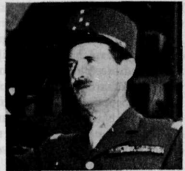
Generaal Philippe Leclerc de Haute-cloque (1902-1947) werd in 1952 postuum tot maarschalk benoemd

Februari zorgde nog voor een typische situatie,