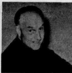
Sir Samuel Hoare, de zo succesvolle Britse ambassadeur in Madrid

Het zal voor iedereen begrijpelijk zijn, dat de op 1 juni als Engels ambassadeur in Madrid begonnen Sir Samuel Hoare (de latere Viscount Templewood) zich voor hete vuren zag geplaatst. Deze kundige staatsman en diplomaat kweet zich echter op voortreffelijke wijze van zijn vooral in de beginperiode zo ondankbare taak. Bij het aanbieden van zijn geloofsbriefjes aan Franco verkreeg Hoare direct al iets meer dan gebruikelijk was, want Franco sprak langer met hem dan protocollair noodzakelijk was en spreidde daarbij grote hoffelijkheid ten toon. Verder hadden de Engelsen in deze periode nog een voordeel, namelijk de gezindheid van de Spaanse minister van buitenlandse zaken kolonel Beigbeder, die beslist niet anti-Brits was en daarvoor ook nog durfde uitkomen. Beigbeder stelde in een korte spanne tijds — hij werd nog in 1940 vervangen door Franco's zwager Serrano