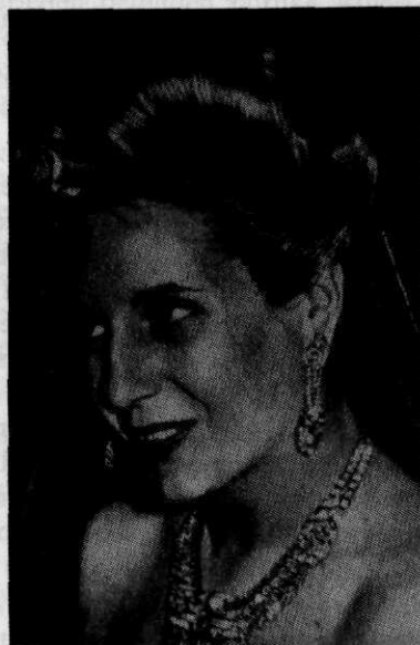
Evita Peron, de populaire echtgenote van de Argentijnse president, bracht in juli 1947 een uitgebreid bezoek aan Spanje

Op 20 september 1948 werd het vriendschapsverdrag met Portugal met tien jaar verlengd; kort daarna (10 oktober) werd de oprichting van de Castiliaanse marine in 1248 met werkelijk Spaanse