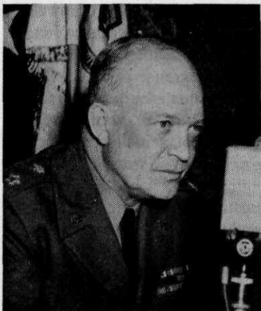
President Dwight Eisenhower, voorstander van goede Amerikaans-Spaanse betrekkingen

grandeur herdacht. In 1951 werd door Washington een begin gemaakt met de economische-steunverlening aan Spanje; bij de besprekingen, die daaraan voorafgingen, werd voor het eerst door de Amerikanen de idee geopperd voor een toekomstige Amerikaans-Spaanse samenwerking in de militaire sector. Het door beide partners gewenste bondgenootschap kwam in 1953, het jaar waarin de Spanjaarden tevens een concordaat met het Vaticaan sloten, tot stand. Het Amerikaans-Spaanse verdrag werd op 23 september getekend. De twee naoorlogse sleutels, die de Middellandse Zee zouden kunnen afsluiten, waren nu in handen van de Amerikanen, want de toetreding van Turkije tot de NAVO in 1952 had hen reeds in het bezit gesteld van de andere sleutel.