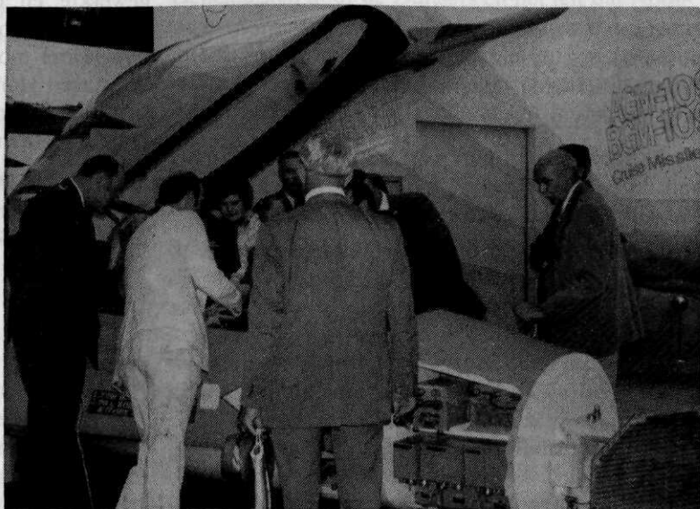
Afb. 1 Het cockpitmodel F-16 van General Dynamics trok veel belangstellenden

Honeywell exposeerde o.m. 20 en 30 mm munitie met diverse ontstekers, automatische testbanken voor zeer uiteenlopende vliegtuigtypen, zoals de DC-10 jumbojet, het kolossale C-5A transportvliegtuig, het F-15 gevechtsvliegtuig en het ALCM-B cruise missile. Verder diverse typen radarhoogtemeters, boordcomputers, geminiaturiseerde Forward looking infrared apparatuur (FLIR), ionisatiedetectoren, enz. Veel belangstelling trok de demonstratie van de ingenieuze „Integrated helmet mounted sight/display", waarbij de piloot in zijn helmvizier via een glasvezelkabel tegelijkertijd een beeld krijgt geprojecteerd dat is opgenomen door een sensor als bijvoorbeeld een low-light-level-TV-camera, een radar, een FLIR of een infrared rear warning.