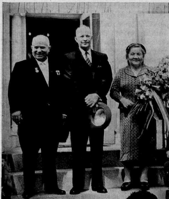
Na de afspraken van Camp David, 15 september 1959

in de periode die wij de „vreedzame coëxistentie” noemen. De letterlijke vertaling uit het Russisch van de oorspronkelijke benaming luidt: „de leninistische koers van vreedzame wedijver tussen de landen met een verschillend maatschappelijk systeem”. En dát is beslist iets anders dan „vreedzame coëxistentie”, welke term eigenlijk als een vorm van vertaal-simplificatie is ontstaan.