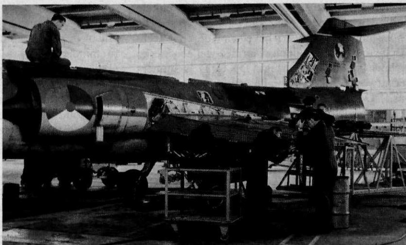
Afb. 3 Een F104G in 200-PE-inspectie

aan de vele noodstroomaggregaten die op en rond de basis aanwezig zijn.