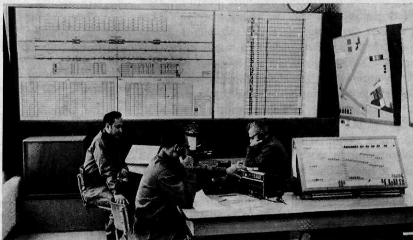
Afb. 2 Kantoor werklasterbeheersing

Het bureau kwaliteitsbeheersing heeft als voornaamste taak het verzekeren van een hoge kwaliteit van de onderhoudswerkzaamheden aan alle