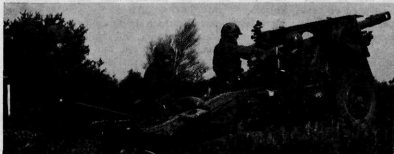
Afb. 1 Onze trouwe 25-ponder ging verregaande ouderdomsverschijnselen vertonen