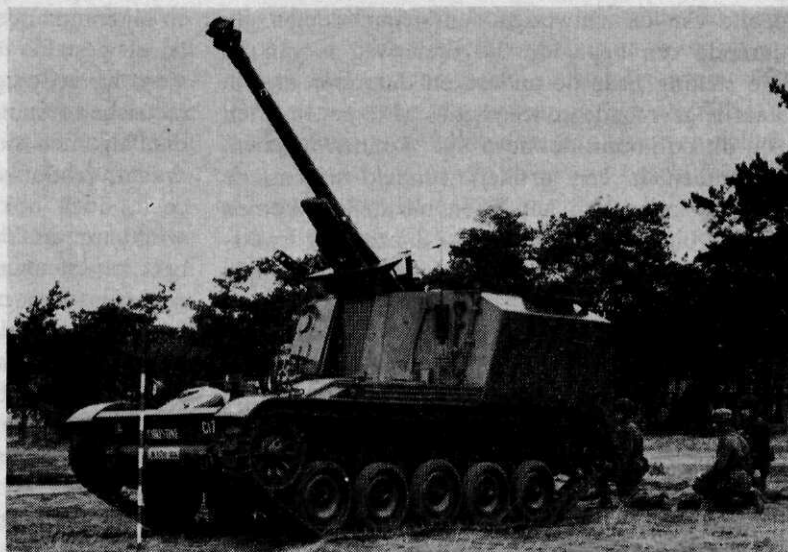
Afb. 2 Houwitser 105 mm 1 30 AMX, in 1965 ingevoerd bij drie afdelingen veldartillerie

veldartillerie moest of kon veranderen. Een citaat 2 :