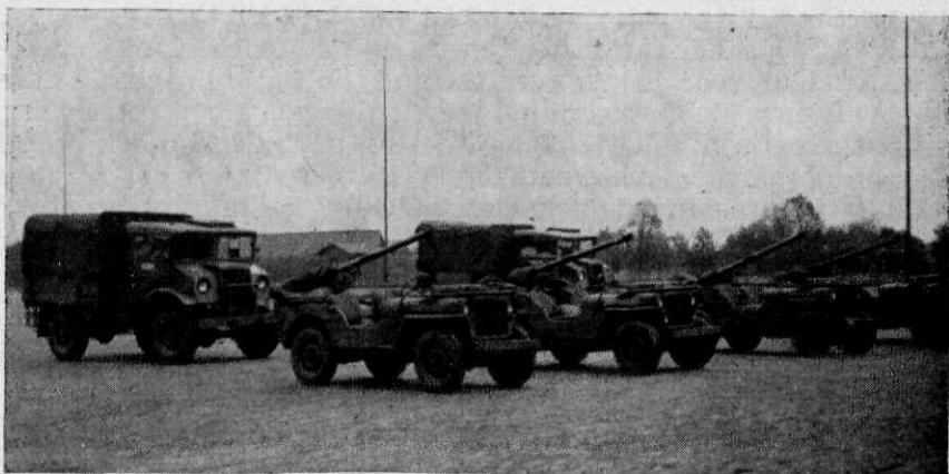
Afb. 1 2 groepen tlvn, gereed voor een tactische oefening. Opgemerkt dient te worden, dat hier tlvn 75 mm zijn afgebeeld, daar de tlv 106 mm nog niet in voldoende aantal ter beschikking is voor oefeningsdoeleinden. Wel wordt echter gewerkt alsof hier tlvn 106 mm op de voertuigen stonden gemonteerd.