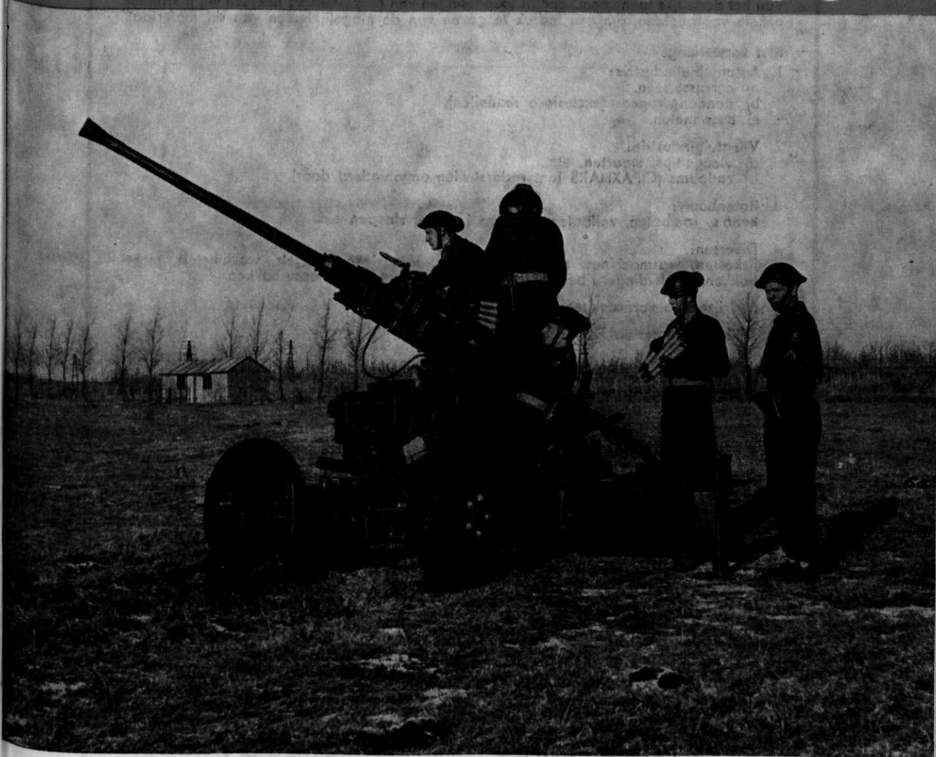
HET LUCHTDOELARTILLERIEKANON VAN 40 MM IN STELLING

WAARIN OPGENOMEN DE OFFICIELE MEDEDELINGEN VAN HET MINISTERIE VAN OORLOG