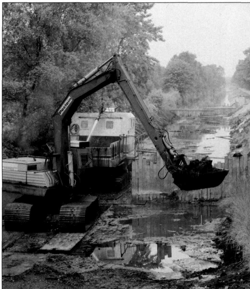
De EOD ruimt munitie in een sloot in de Peel. De apparatuur is gepantserd, Griendstveen, 1988

Het werkverband sprak de verwachting uit dat het werkaanbod in de toekomst alleen maar verder zou stijgen. Het ruimen van explosieven uit de Tweede Wereldoorlog zou in de loop van de tijd ingewikkelder worden, meer tijd vergen en tot omvangrijkere