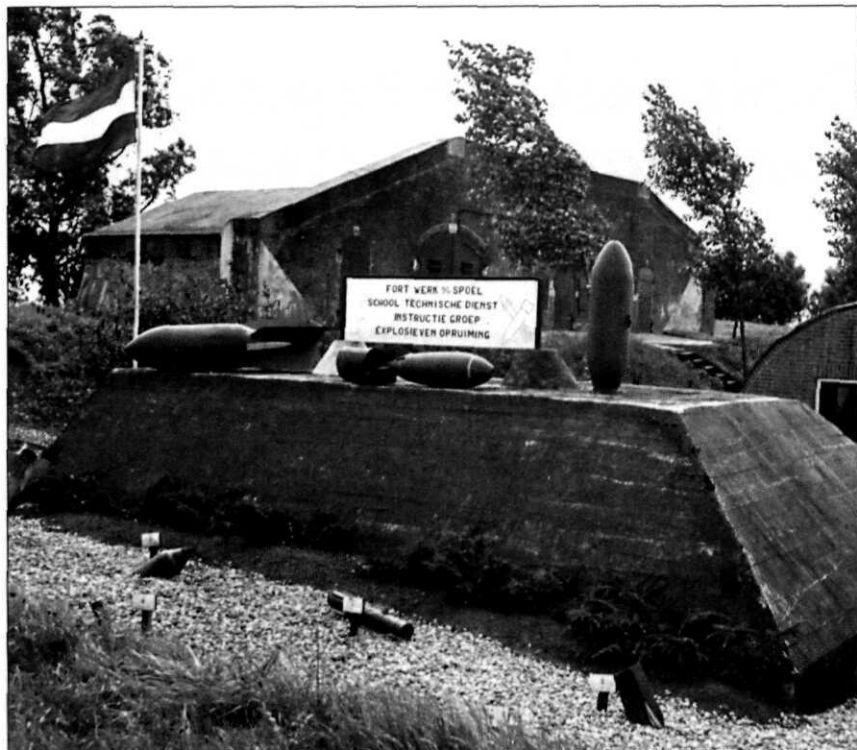
De bommentuin van de Instructiegroep Explosieven Opruiming op Werk aan het Spoen, Culemborg

bommen zouden gaan ruimen en personeel voor dit werk zouden gaan opleiden.