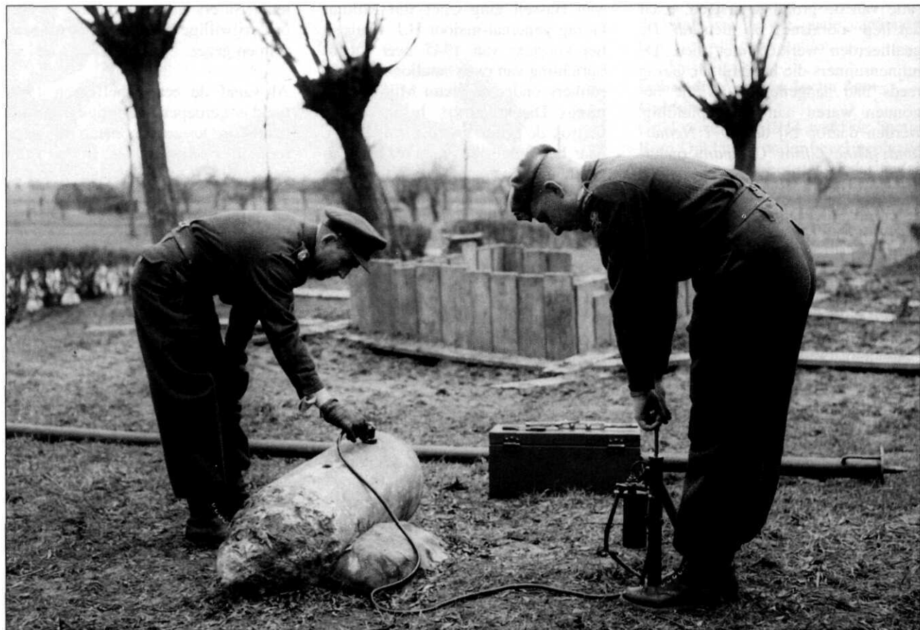
Het injecteren van een bombuis met een stollende vloeistof om het ontstekingsmechanisme tot stilstand te brengen opdat het explosief 'veilig' kan worden gedemonteerd, Werk aan het Spoel, Culemborg, 1959