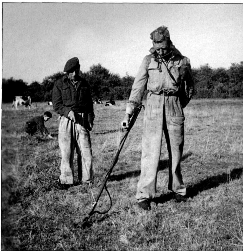
Militairen zijn met prikker en mijndetector op zoek naar landmijnen, circa 1946

Na afloop van de Tweede Wereldoorlog bleef Nederland zitten met grote aantallen landmijnen, een grote hoeveelheid niet-gebruikte munitie en veel niet-gedetoneerde (ongesprongen) vliegtuigbommen. Die moesten na de oorlog zo snel mogelijk worden