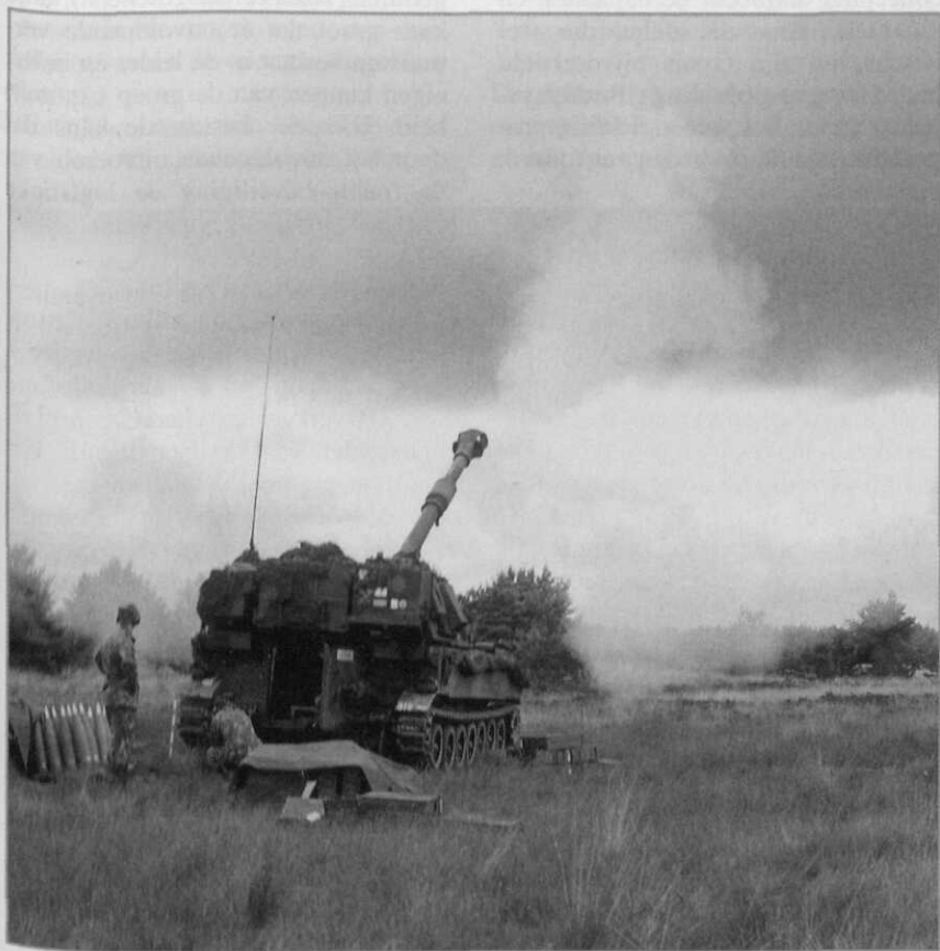
Mogelijke steun in het achtergebied

– Als de eigen nabij-beveiliging van de FD-eenheden niet voldoende is,