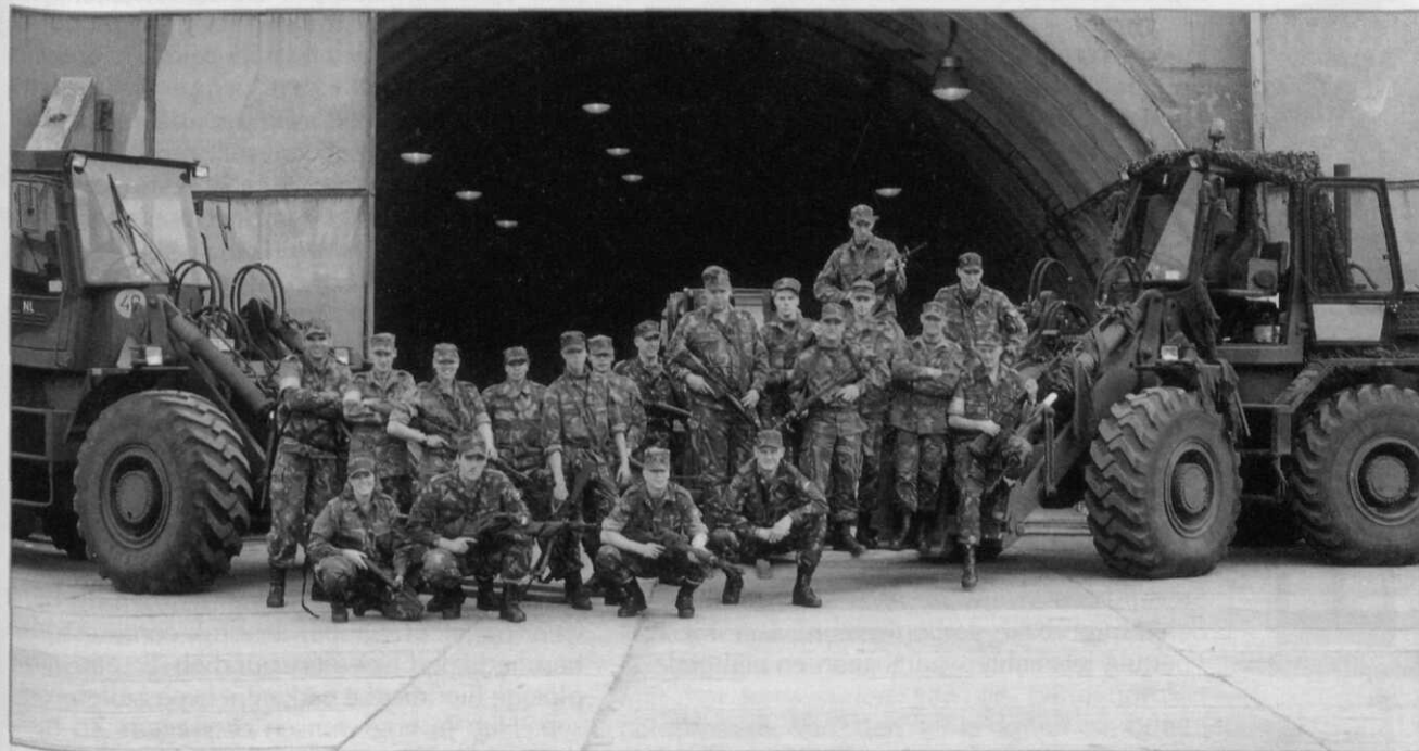
Het dienstvak van de logistiek: niet alleen een goede dienstverlener maar ook een operationele partner!

Het Dienstvak van de Logistiek: niet alleen een goede dienstverlener maar ook een operationele partner!