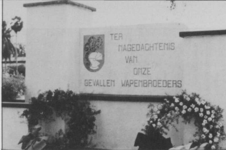
Monument van de U-brigade op het ereveld Belantoeng te Padang, Sumatra

gin december 1950 de belangrijkste plaatsen op Ambon in Indonesische handen waren, mochten de militairen wel naar Ambon vertrekken. De Ambonese voormannen wezen dit op hun beurt af en eisten afvoer naar onbezet gebied. Na koortsachtig overleg tussen alle betrokken partijen, na rechtszaken en gewapende schermutselingen werd ten slotte in februari 1951 overeengekomen de 4000 Molukse ex-KNIL-militairen en hun familieleden, in totaal ongeveer 12.5000 personen, tijdelijk naar Nederland te sturen. Een noodoplossing! De militairen werd niet verteld dat zij bij aankomst in Nederland uit militaire dienst zouden worden ontslagen. Totaal onvoorbereid en ongewild kwamen zij in een onbekend land terecht, met een ongewisse toekomst voor zich.