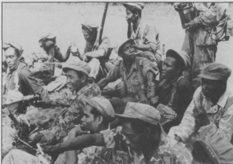
Molukse KNIL-militairen: onvoorbered en ongewild naar een onbekend land

P. Westerling. Deze militair, die bekendheid genoot door zijn optreden in Zuid-Celebes in 1947, was sinds begin 1949 ambteloos burger. Rond zijn persoon was een geweldige mythevorming ontstaan. Ontevreden KNIL-militairen, onder wie Ambonezen van het Regiment Speciale Troepen (RST), hadden hun hoop op hem gevestigd. Ook genoot hij grote faam onder de Islamitische bevolking in de deelstaat Pasoendan (West-Java). Voor de Republikeinse autoriteiten was hij de grote onberekenbare, gelijk Patton voor de Duitsers in de Tweede Wereldoorlog: waar zou deze gevreesde tegenstander opduiken en zijn slag slaan? Westerling had een legertje ontevredenen en avonturiers om zich verzameld, onder wie 310 KNIL-militairen, van wie er 141 tot het RST behoorden. Hen was voorgehouden dat veel KNIL-militairen, politiemannen en zelfs TNI'ers zich bij een eventuele coup zouden aansluiten. Op 23 januari deed het legertje een amateuristische poging enkele punten in Bandoeng te bezetten. De verwachte steun bleef echter uit. De nietige coup mislukte jammerlijk, maar had wel grote gevolgen.