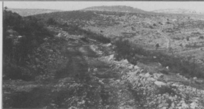
Afb. 3 Een van de vele nauwelijks berijdbare wegen

men slechts deel aan patrouilles of andere gevechtstaken in opdracht van C-Dutchbatt;