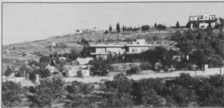
Afb. 5 Gezicht op CP-Dutchbatt te Haris

Een waarnemingspost meldt dat een groep infiltranten zich in de richting van de AnNafka-wadi beweegt. Een patrouille, die zich reeds in deze wadi bevindt, krijgt de opdracht een „blocking position” in te nemen, de infiltranten op te vangen en te ontwapenen. Met behulp van nachtzichtapparatuur worden de infiltranten ontdekt. Als ze tot op enkele tientallen meters zijn genaderd, worden zij door middel van een „tanbih, wa illa nutlig” (halt of ik schiet) tot staan gebracht terwijl ze tegelijkertijd met schijnwerpers in het volle licht worden gezet en omsingeld. Vanaf nu zijn alle mogelijke scenario's denkbaar. De patrouillecommandant probeert erachter te komen tot welke groepering ze behoren om zodoende via het bataljon de desbetreffende LSO te kunnen oproepen. De compagniescommandant heeft inmiddels de arabische tolk naar de plaats van actie gedirigeerd. Als alles gunstig verloopt