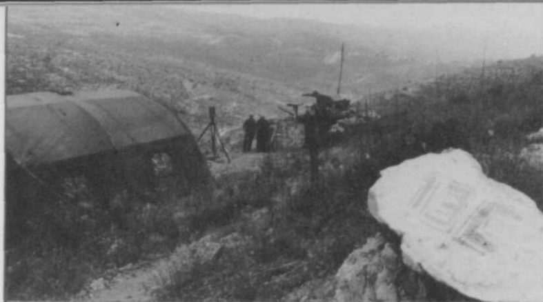
Afb. 4 Waarnemingspost 7-13 C

terwijl in het gehele gebied een volkomen gezagsvacuüm bestond, oftewel de „wet van de jungle” heerste. Gezien die situatie diende op twee „fronten” te worden opgetreden.