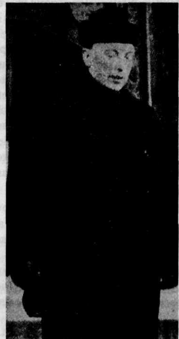
Risto Ryti, president van Finland (eind 1940-augustus 1944); hij werd in 1946 tot tien jaar dwangarbeid veroordeeld

In het begin van december hadden de Russen Paasikivi ervan op de hoogte gesteld dat zij bepaalde verwachtingen koesterden van de komende Finse presidentsverkiezingen, die nodig waren geworden doordat op 27 november president Kallio om gezondheidsredenen was afgetreden. De Russen verklaarden nu dat de verkiezing van Tanner, Mannerheim, Svinhufvud of Kivimäki — de Finse gezant in Berlijn — als een onvriendelijke daad ten opzichte van de Sovjet-Unie zou worden beschouwd. Gelukkig kwam Ryti uit de bus, een verkiezing die geen moeilijkheden meebracht. Ryti werd als premier opgevolgd door Rangell, die uit het vorige kabinet Witting en de minister van oorlog generaal Walden overnam. Maar de Sovjets kregen toch een indirecte tegenzet te verwerken voor hun bemoeiingen met de presidentsverkiezing. Dat was de benoeming van Annala als mi-