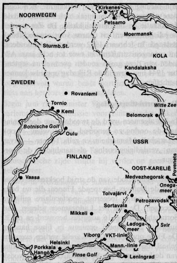
Finland: grenzen van vóór en ná de Tweede Wereldoorlog

De Duits-Finse betrekkingen beleefden zelfs nog een keer een hoogtepunt. Op 4 juni 1942 vierde maarschalk Mannerheim zijn 75e verjaardag en Hitler achtte het nuttig hem persoonlijk in Mikkeli te gaan gelukwensen. Uiteraard passeerde de gehele internationale toestand de revue, want tevens waren president Ryti en de meeste Finse ministers aanwezig. Hitler's toelichting kwam erop neer dat, gezien de Duitse successen van het ogenblik, de Sovjet-Unie zich ten hoogste tot het einde van de komende herfst zou kunnen staande houden. Maar de Finnen, met inbegrip van de maarschalk, lieten zich niet in slaap wiegen door de mooie doch vage prognoses. In juli was het de beurt van generaal Jodl om Mikkeli met een bezoek te vereren. Ook hij waagde zich aan een voorspelling: nu zou Leningrad het beleg niet lang meer kunnen doorstaan; hij kondigde de val van de stad aan tegen