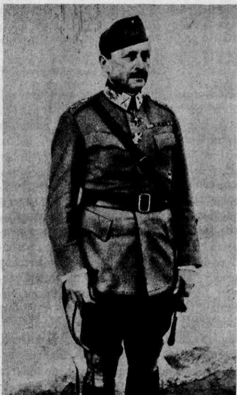
Generaal Mannerheim (1867-1951), maarschalk van Finland vanaf eind mei 1933

bijna overal de orde hersteld en het land werd van Roodgardisten gezuiverd; van hun totale sterkte, bijna 80.000 man, was het merendeel in gevangenschap geraakt, de rest was naar de Sovjet-Unie gevlucht.