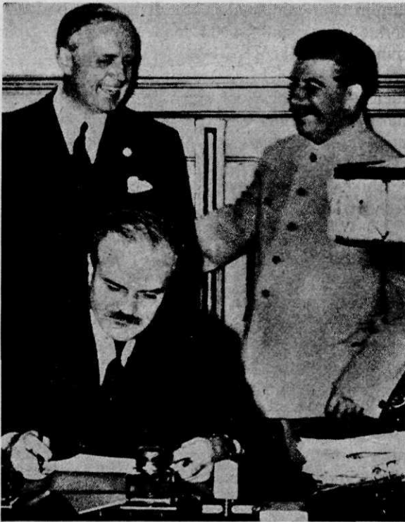
Moskou, 23 augustus 1939: Molotov ondertekent het verdrag; Stalin en von Ribbentrop steken hun ingenomenheid niet onder stoelen of banken

er alweer een zaak bij die op de Russen zeer onprettig overkwam. De Sovjet-Unie wenste een strikt neutraal Finland, zoals onder meer bleek uit een hoofdartikel in de Pravda van 13 juni 1939. Ten overvloede hielden de Finnen hun zomermanoeuvres vlak aan de grens met de Sovjet-Unie. Deze oefeningen waren van een omvang die voorheen hoogst ongebruikelijk was. Alle in Helsinki geaccrediteerde militaire attachés, met uitzondering van de Russische, woonden deze grote militaire demonstratie bij. Op verschillende nieuwe bunkers waren voor iedereen leesbaar anti-Sovjet-leuzen aangebracht. Dit alles kon niet meer als ondiplomatiek worden gezien, het ging al veel verder: het kleine Finland was overmoedig geworden en had in feite de grote Sovjet-Unie uitgedaagd.