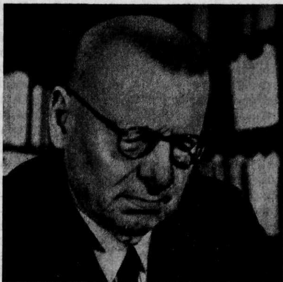
Juno Paasikivi, Rusland-expert bij uitstek; de nog bestaande Finse onafhankelijkheid is voornamelijk aan hem te danken

had daar zijn visitekaartje achtergelaten: op zijn bevel was het gehele plaatsje vernietigd, doordat enkele met munitie geladen goederenwagens tot explosie waren gebracht. Medio oktober rukten de Finnen een nog slechts smeulende puinhoop binnen. Ook hier dus weer een Duitse aftocht die hetzelfde beeld te zien gaf als overal elders: brandstichting en vernietiging. De totale schade, door de Duitsers in deze streken aangericht, werd begroot op een bedrag dat aanzienlijk hoger lag dan 300 miljoen dollar.