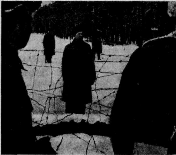
De vrede van Moskou (maart 1940) is gesloten; een Finse militaire delegatie maakt contact met de Sovjets

den bedroeg 43.000 man; ongeveer 10.000 daarvan zouden voorgoed invalide blijven.