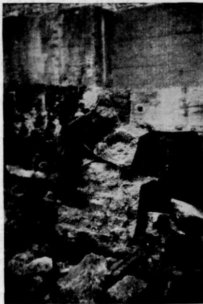
Afb. 2. Het resultaat van een ontploffing.

(afb. 1). In elk dezer gaten werd een kleine lading van 0,15 kg trotyl aangebracht en zorgvuldig opgestopt. Een aantal van deze ladingen werd gelijktijdig electrisch ontstoken (afb. 2). Op deze wijze werd versnijding na versnijding opgeruimd, zonder dat beschadiging van het overige deel van den pijler werd veroorzaakt.