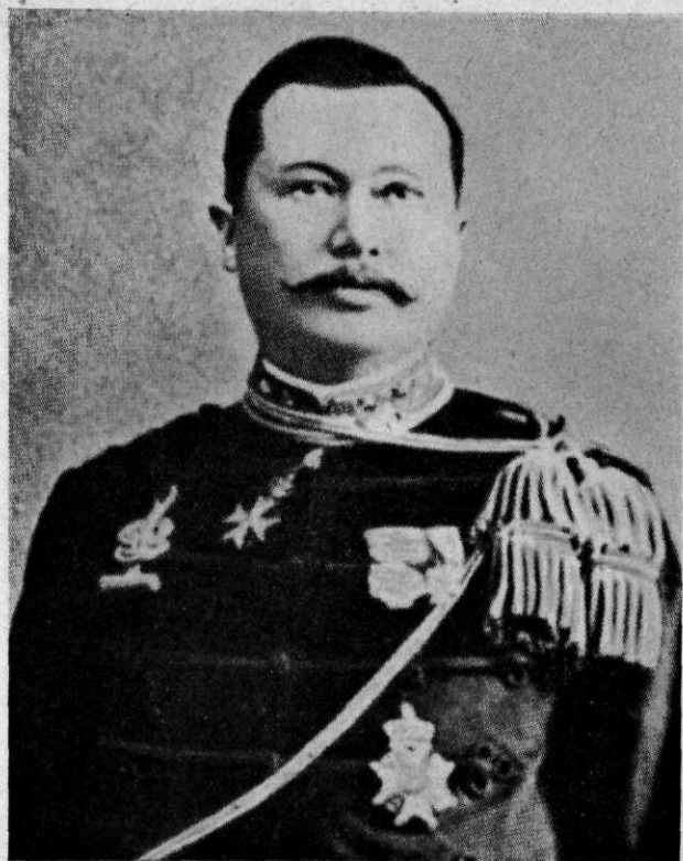
Generaal G. C. E. van Daalen