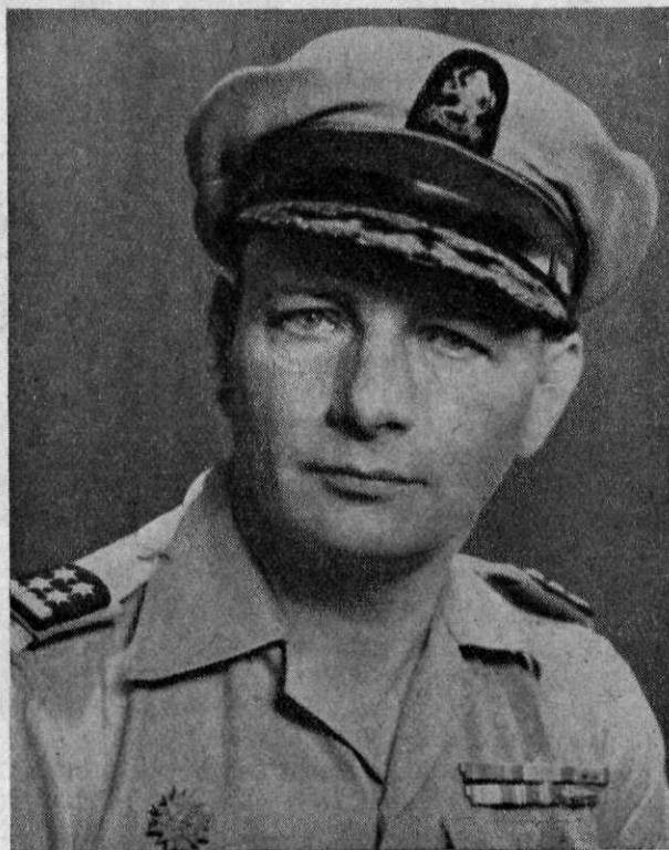
Generaal S. H. Spoor