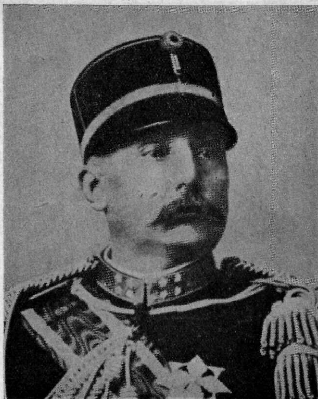
Generaal J. B. van Heutsz