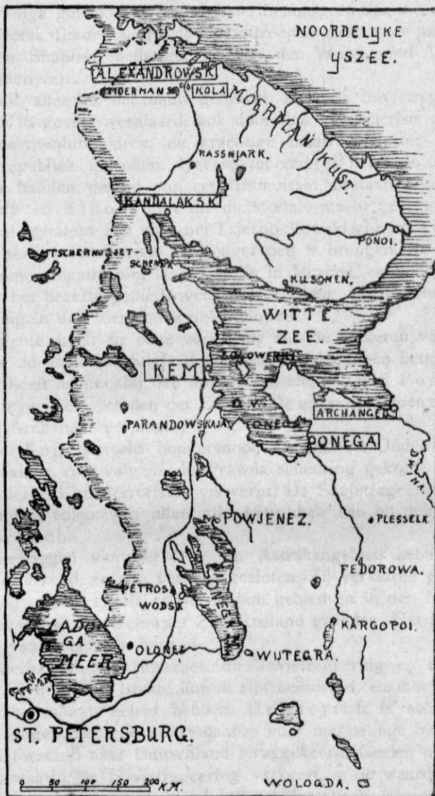
MOERMAN GEBIED EN MOERMAN SPOORWEG. [DE OMRANDE PLAATSEN ZIJN IN HET BEZIT VAN DE ENTENTE].