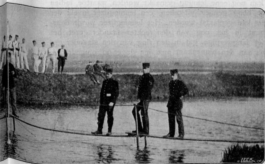
...aan, terwijl twee andere manschappen de zijtouwen vastzetten.

het juk geleidelijk zakt. Vervolgens schopt hij zoo noodig, steunende op het trekijzer, de plank met één voet in het midden van het steunijzer, waarbij de andere voet op dat ijzer rust. Daarna het trekijzer losmaken en op den wal leggen, waarna de tweede plank wordt gelegd.