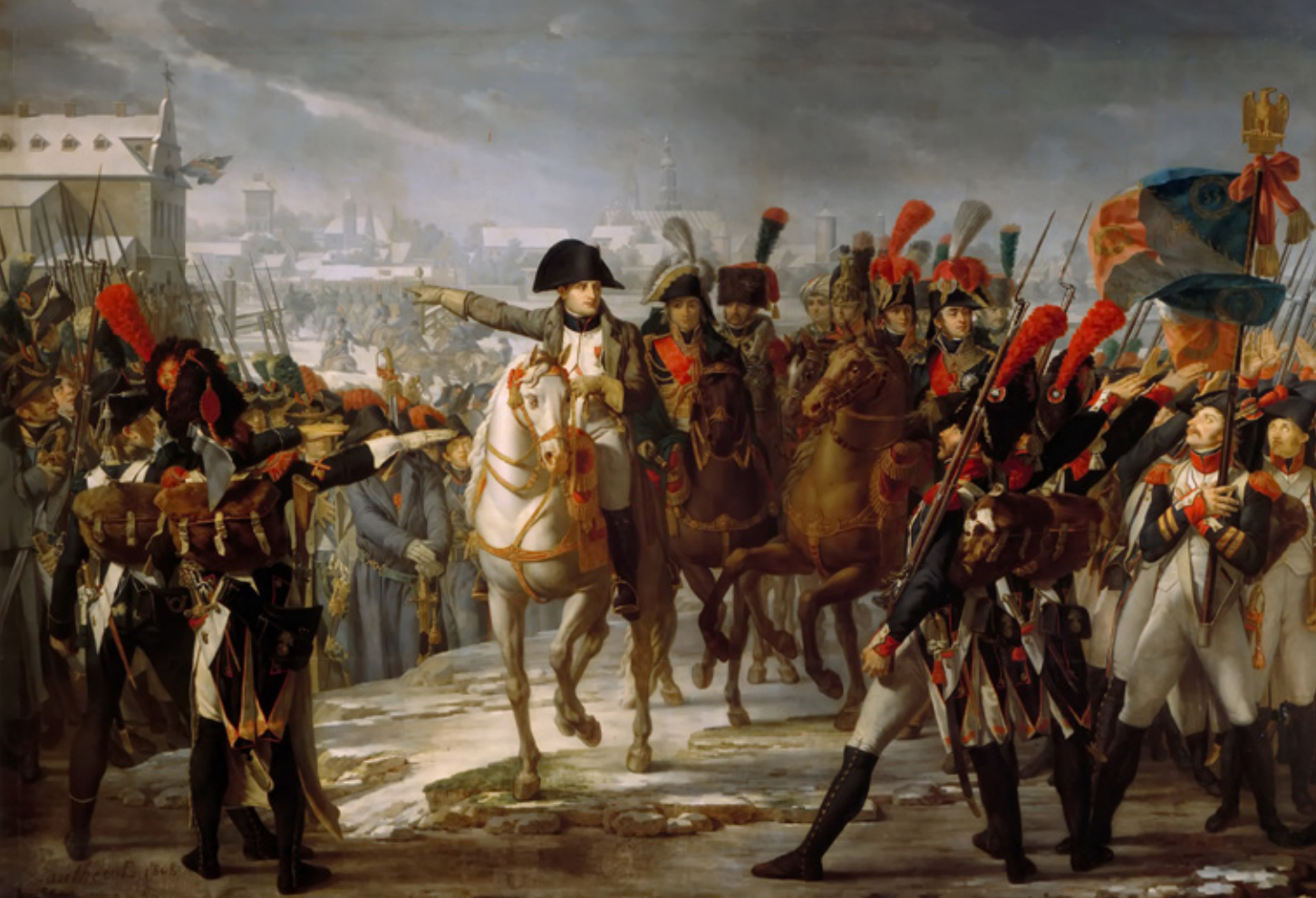
Napoleon spreekt zijn troepen toe bij de brug over de Lech bij Augsburg. In de 19e eeuw groeiden militaire eenheden in omvang