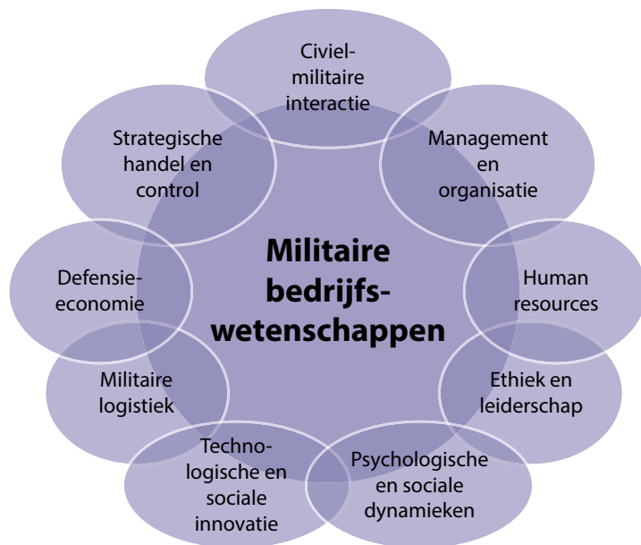
Figuur 1 De militaire bedrijfswetenschappen en de samenhangende vraagstukken die ze bestuderen. Geïnspireerd door figuur 6 uit E-H. Kramer, De Militaire Bedrijfswetenschappen in Tien Stellingen: Een Sociotechnisch Perspectief , 34

van de zeventiende eeuw mogelijk om de strijd op te kunnen nemen tegen het machtige Spaanse wereldrijk. 7 Later tijdens de Napoleontische oorlogen 8 zagen we bovendien een nog altijd inspirerende aandacht voor gedegen planning met kwantitatieve en kwalitatieve analyses