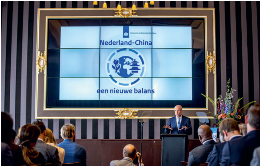
Minister Stef Blok (Buitenlandse Zaken) presenteert de China-strategie (2019). Hoe beschermt Nederland zijn belangen bij een Chinese civiel-militaire fusie?

uiteenlopende gebieden zoals personeel, technologie, R&D en het productieproces. Dit maakt het onduidelijk wat nog precies militair is en wat niet.