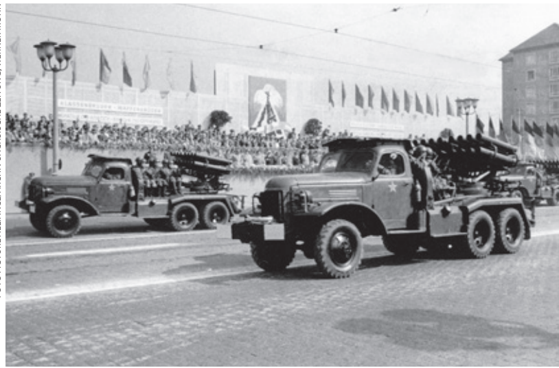
Sovjeteenheden tijdens een parade in Dresden in 1963. De hoofdverdedigingslinie van de NAVO schoof dat jaar op naar de Duits-Duitse grens en in het dreigingsbeeld gingen kernwapens een grotere rol spelen