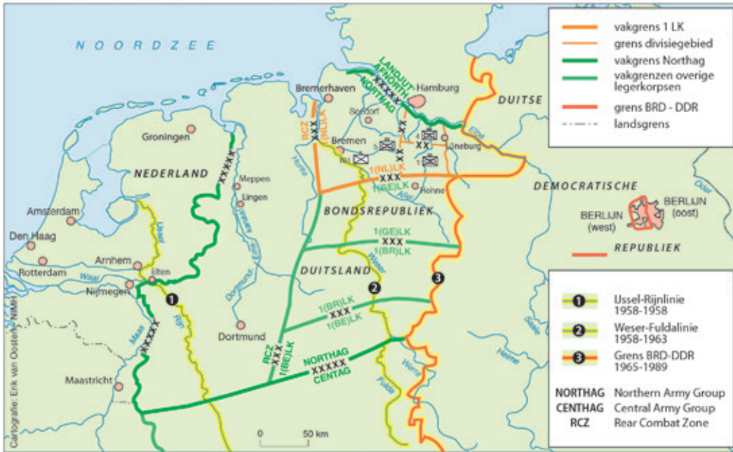
CARTOGRAFIE: ERIK VAN OOSTEN, NIMH

vijand nog weinig concreet. Het Rode Leger werd voorgesteld als een goed geoliede machine. 5 Het zou, mogelijk gemaakt door een snel verkregen luchtoverwicht, binnen enkele dagen aan de IJssel verschijnen. Dan moesten de daar voorbereide inundaties zijn gesteld. Verwacht werd dat ‘het eerste doel van de vijand zal zijn de functie van ons land als étapegebied [voor in de Bondsrepubliek opererende troepen] en basis voor luchtacties te elimineren’. Het afwerpen van een atombom op Rotterdam, Amsterdam of eventueel Den Haag diende volgens een rapport ter voorbereiding van de civiele verdediging uit 1950, na 1952 ‘als mogelijk te worden beschouwd’. De uitwerking daarvan zou ‘in grote trekken [overeenkomen] met die van de grootste bombardementen op de Duitse steden in de afgelopen oorlog, en dus te overzien [zijn]’ (sic). 6