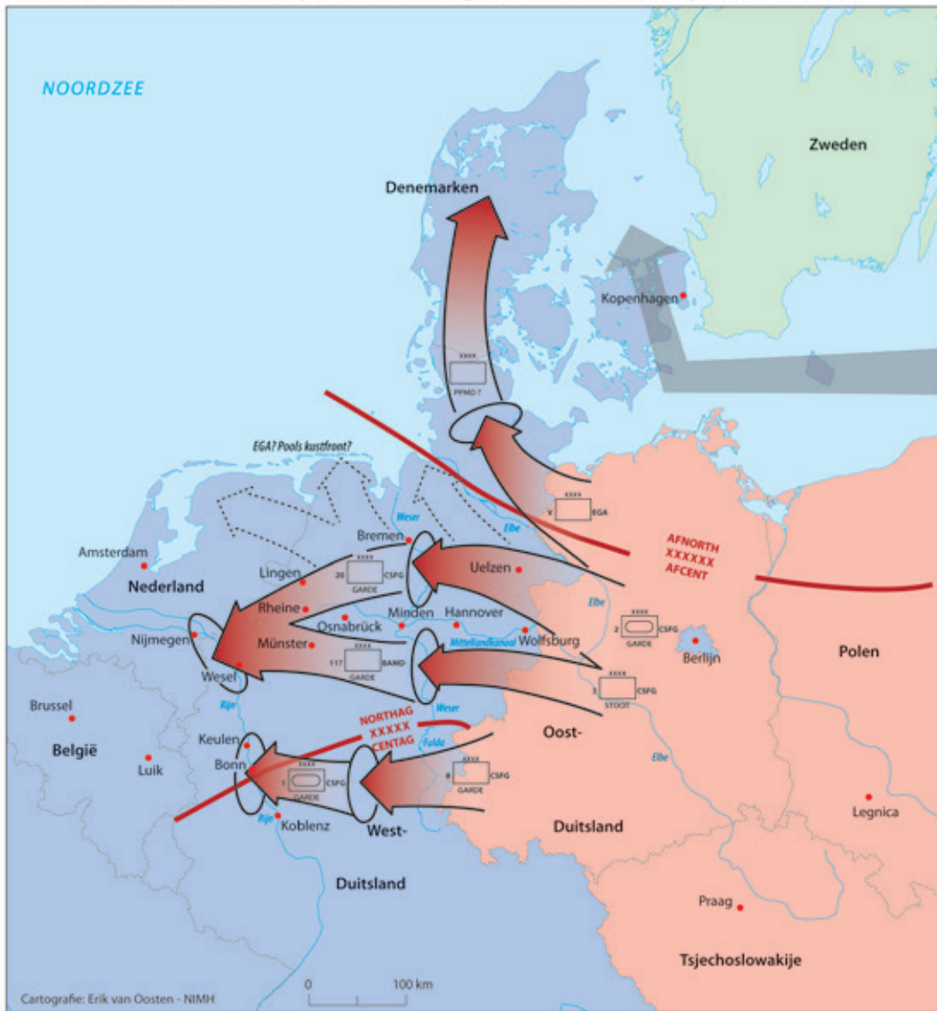
CARTOGRAFIE: ERIK VAN OOSTEN, NIMH