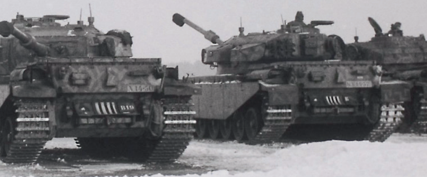
Het Bravo eskadron van 101 Tankbataljon was tijdelijk gelegerd in het NAVO-kamp Bergen-Hohne in Duitsland. De inlichtingendiensten wezen in deze tijd nadrukkelijk ook op zwakke punten van het militaire vermogen van de Warschaupactstrijdkrachten