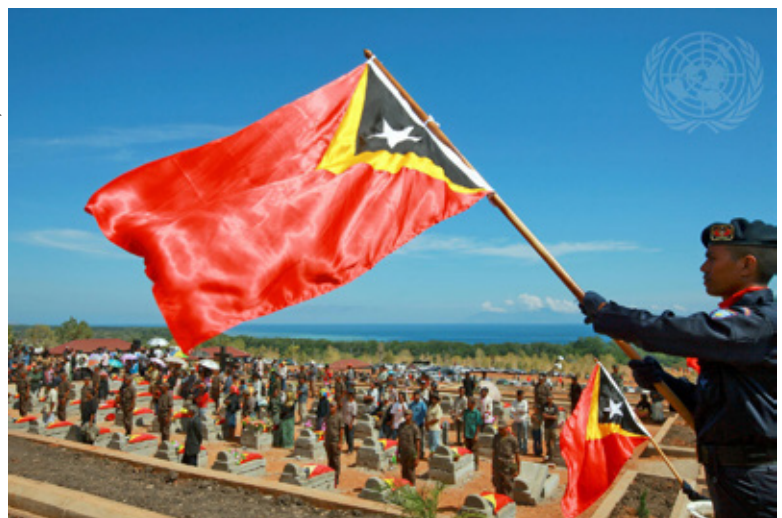
Herbegravenis van gevallen FALINTIL-strijders in Metinaro: onder meer de moeizame vredestransformatie in Oost-Timor was voor onderzoeker Stephen Stedman aanleiding de aandacht te vestigen op peace spoilers